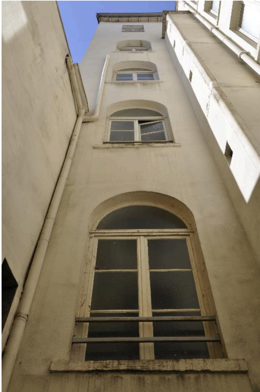
Vue partielle de l'élévation sur cour (cage d'escalier)