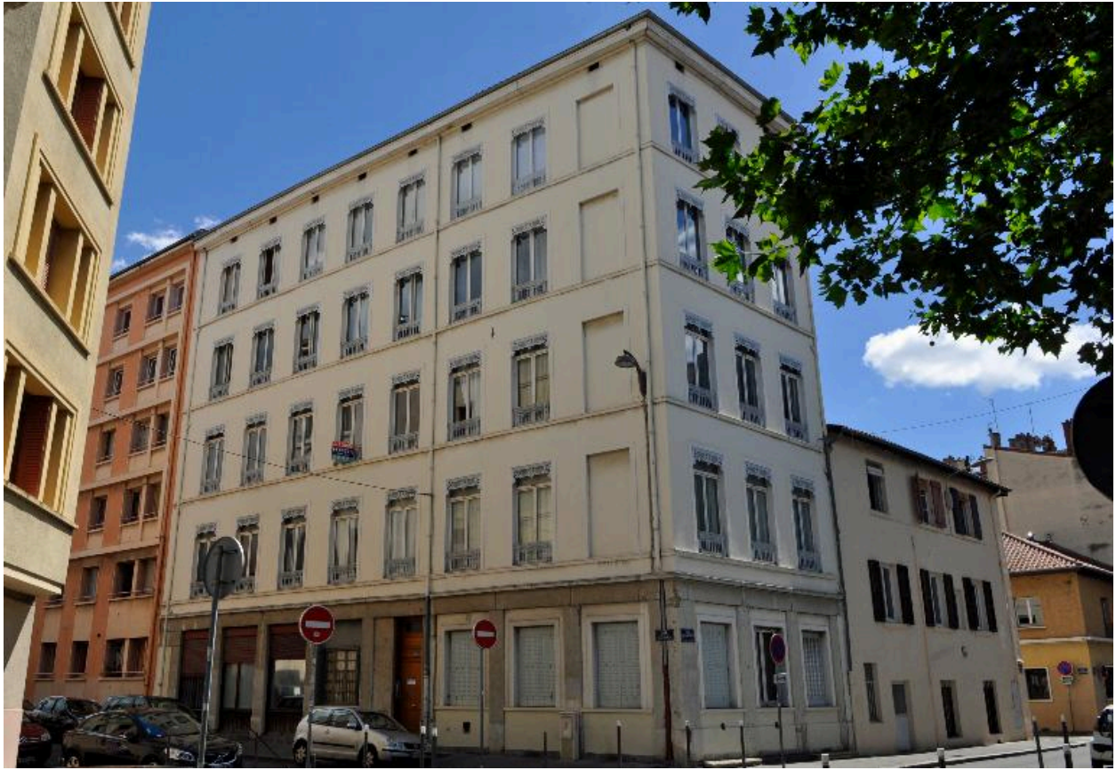
Vue d'ensemble de l'immeuble et de la maison accolée