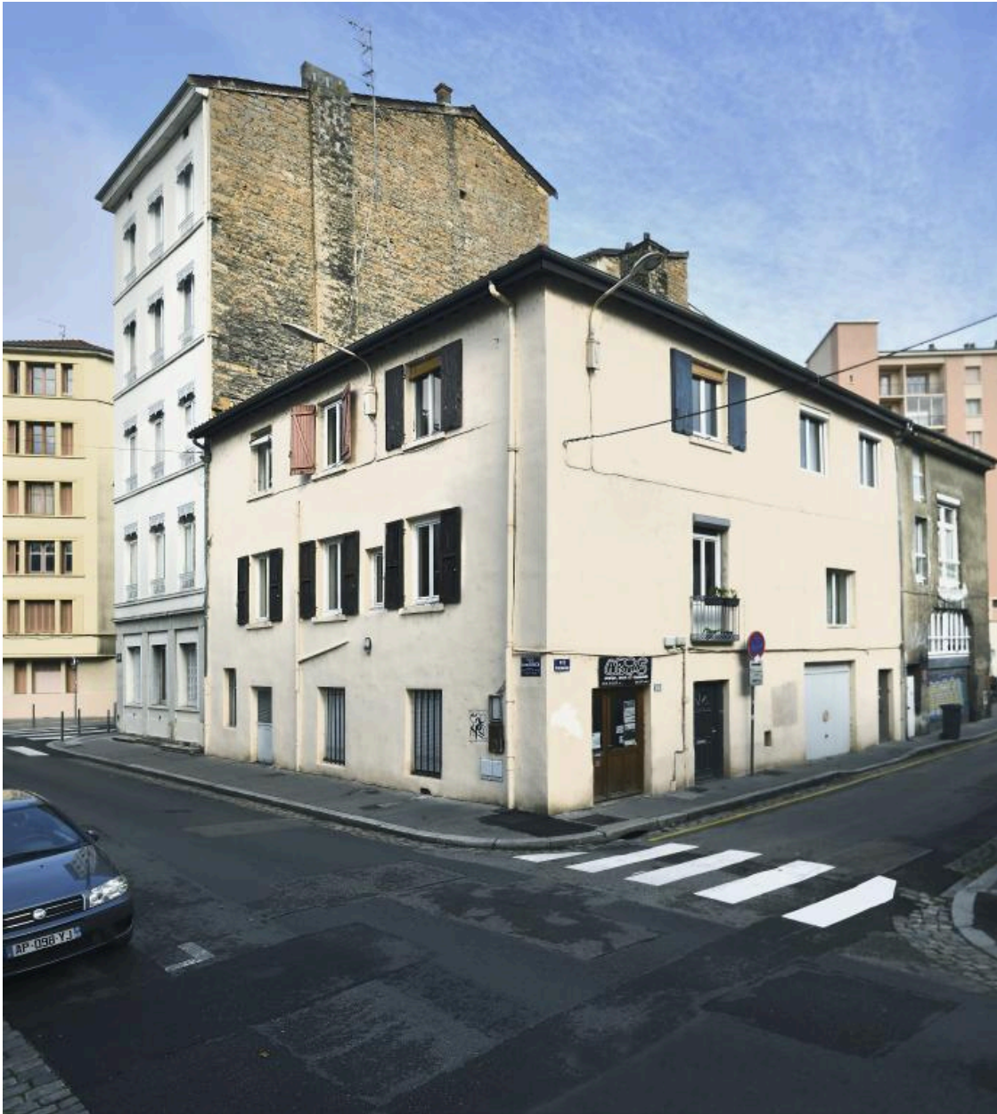
Vue du mur pignon depuis l'est