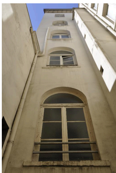
Vue partielle de l'élévation sur cour (cage d'escalier) IVR84_20166900766NUCA