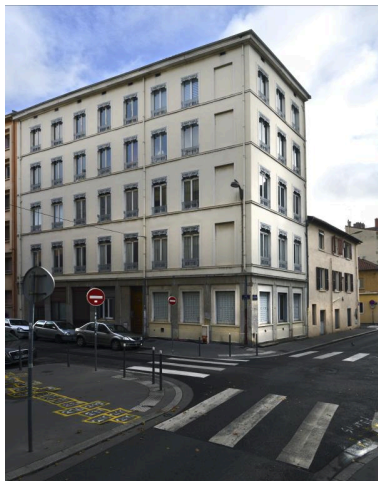
Vue d'ensemble depuis le sud-ouest IVR84_20186901161NUCAQ