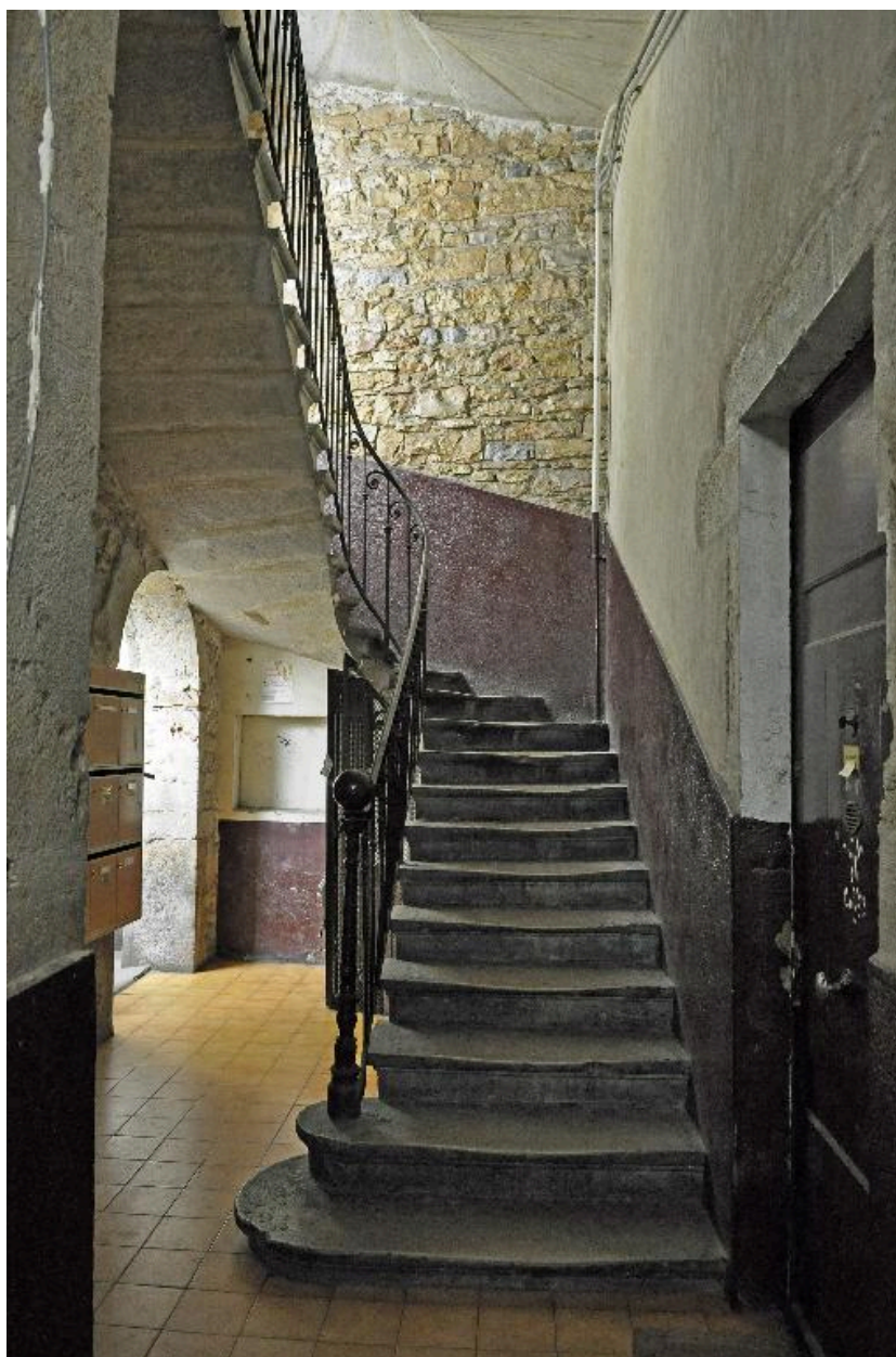
Vue intérieure : le départ de l'escalier