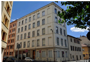
Vue d'ensemble de l'immeuble et de la maison accolée