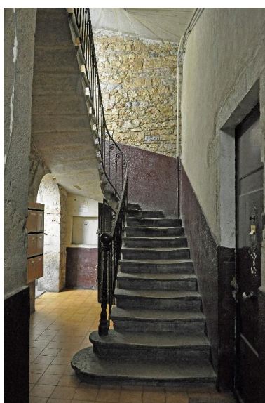
Vue intérieure : le départ de l'escalier