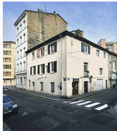
Vue du mur pignon depuis l'est IVR84_20186901163NUCAQ