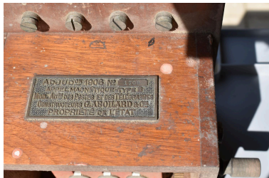
Détail inscriptions IVR84_20226300732NUCA