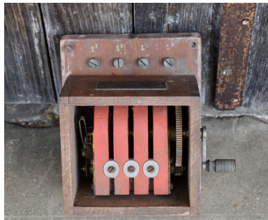
Vue générale IVR84_20226300731NUCA