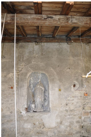
Vue d'ensemble de la niche à statue. Saint Joseph cassé dans la niche. IVR82_20134203407NUCA