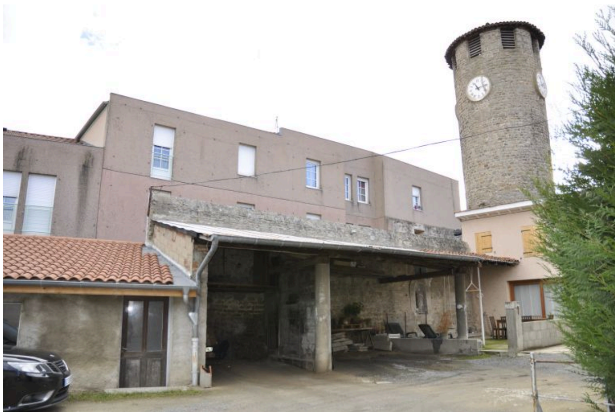
Vue d'ensemble de la cour avec le préau.