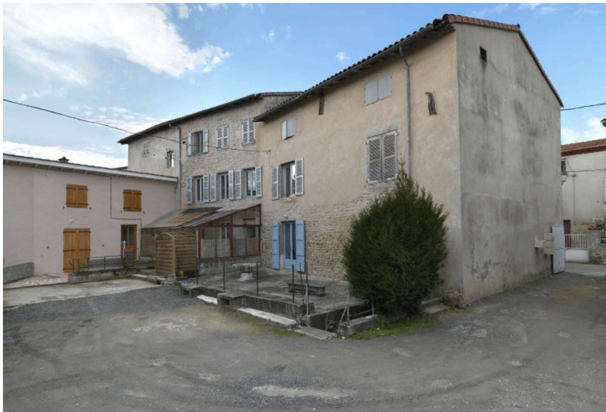
Vue d'ensemble des élévations arrières sur cour.