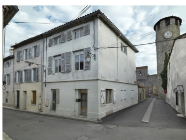
Vue générale sur rue IVR82_20144200075NUCAQ