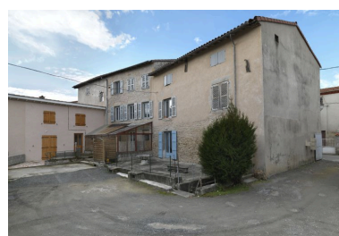
Vue d'ensemble des élévations arrière sur cour. IVR82_20144200079NUCAQ