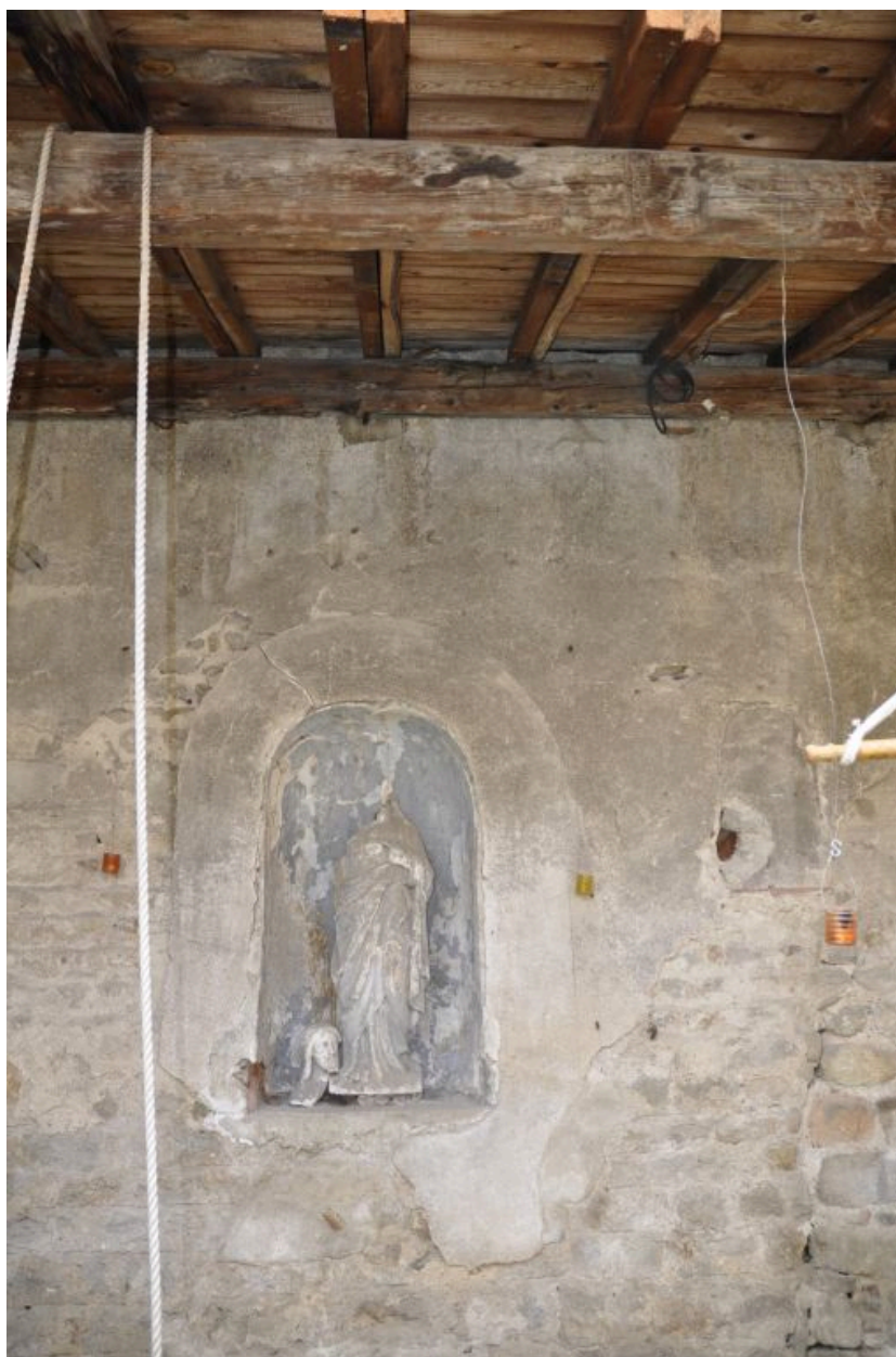
Vue d'ensemble de la niche à statue. Saint Joseph cassé dans la niche.