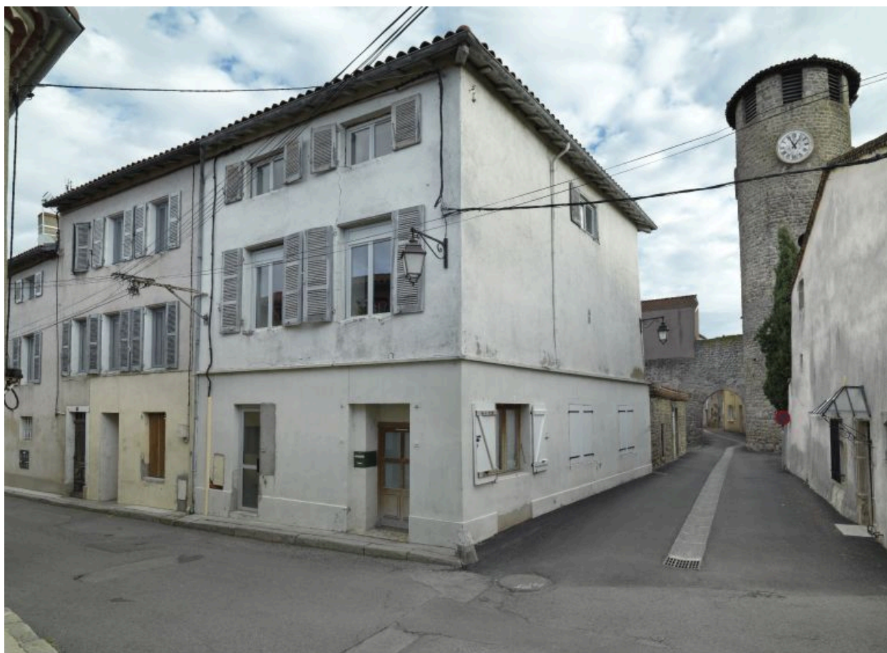
Vue générale sur rue