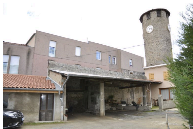
Vue d'ensemble de la cour avec le préau.