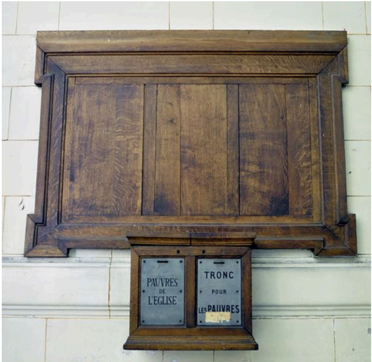
Vue du tronc situé à droite du tambour de la porte d'entrée.