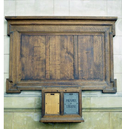
Vue du tronc situé à gauche du tambour de la porte d'entrée.