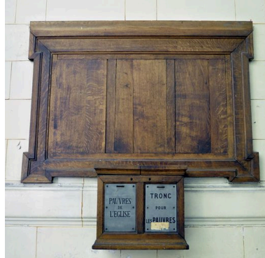
Vue du tronc situé à droite du tambour de la porte d'entrée.