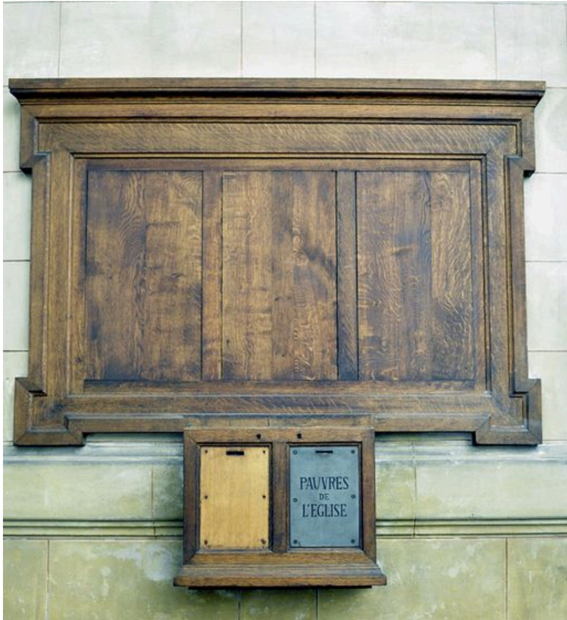
Vue du tronc situé à gauche du tambour de la porte d'entrée.