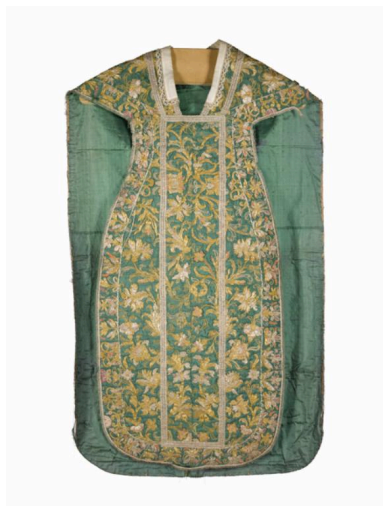
Vue du devant de la chasuble