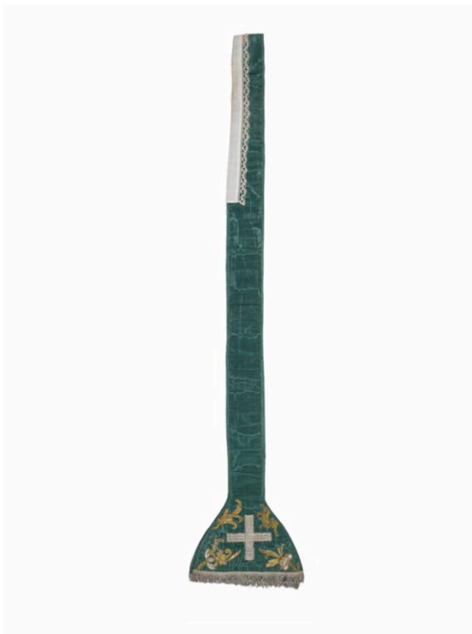
Vue de l'étole