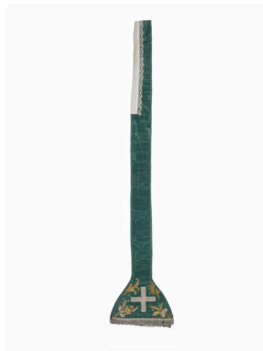
Vue de l'étole