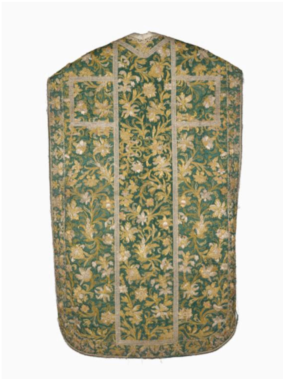
Vue du dos de la chasuble