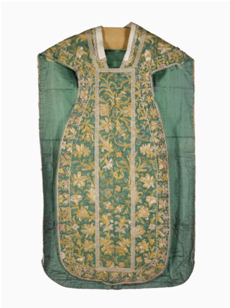
Vue du devant de la chasuble