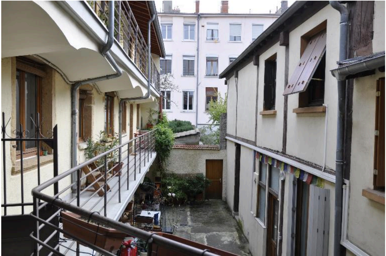
Vue de la cour depuis le palier du premier étage