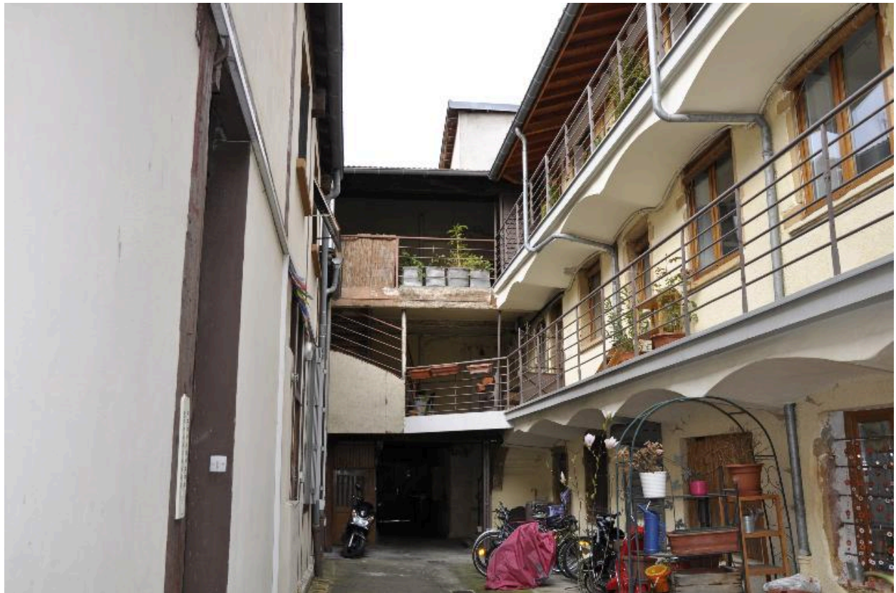
Vue est depuis la cour