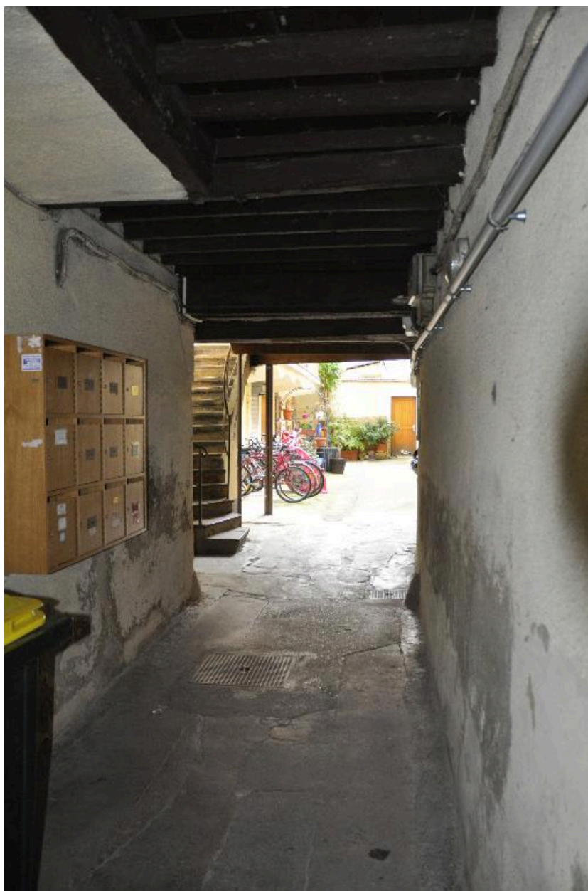
Vue de l'allée