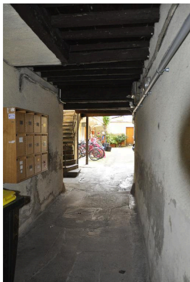
Vue de l'allée IVR82_20146900314NUCA