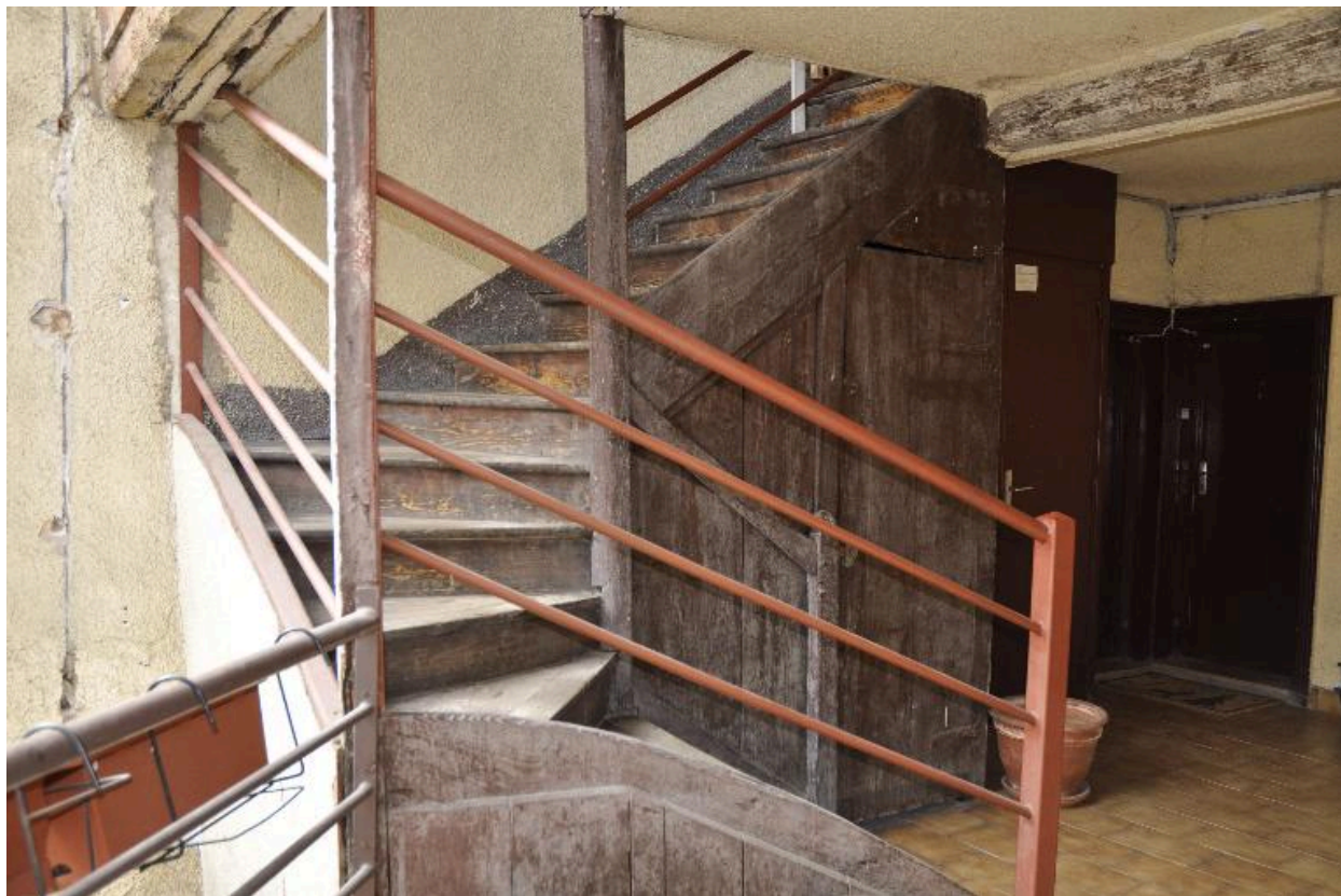
Vue de l'escalier depuis le palier du premier étage