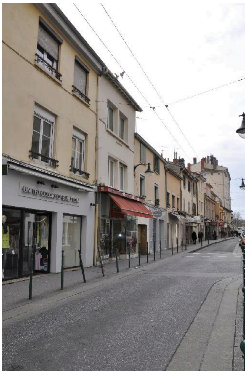
Vue d'ensemble nord ouest