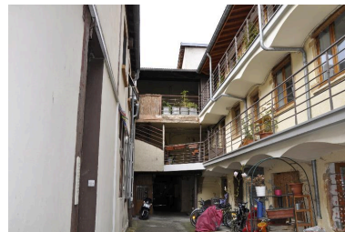
Vue est depuis la cour