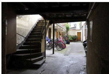
Vue de l'escalier