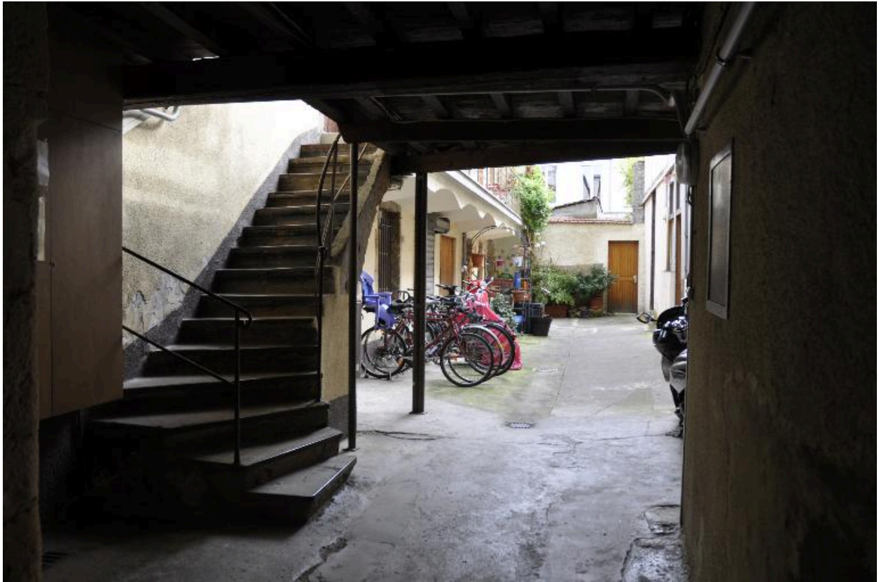
Vue de l'escalier