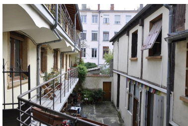
Vue de la cour depuis le palier du premier étage IVR82_20146900320NUCA