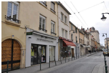
Vue d'ensemble nord ouest de l'immeuble de deux étages