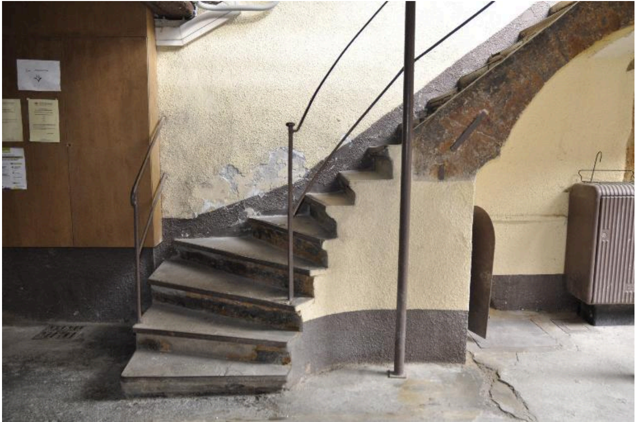
Vue du départ de l'escalier