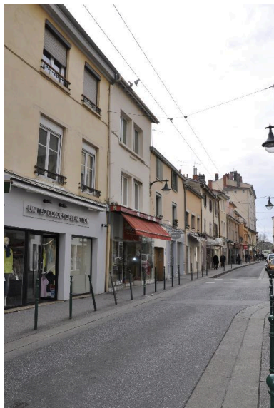
Vue d'ensemble nord ouest IVR82_20146900311NUCA