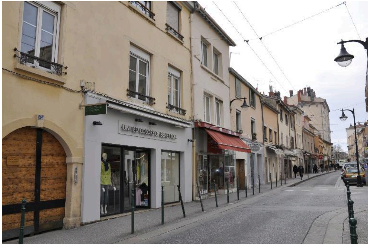
Vue d'ensemble nord ouest de l'immeuble de deux étages