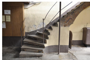
Vue du départ de l'escalier IVR82_20146900317NUCA