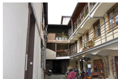
Vue est depuis la cour IVR82_20146900316NUCA