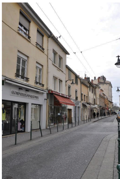
Vue d'ensemble nord ouest IVR82_20146900311NUCA