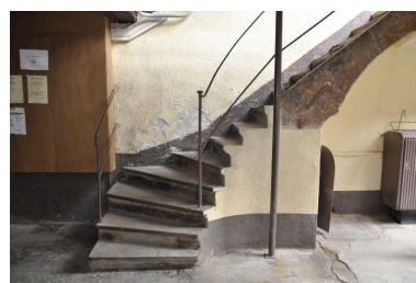
Vue du départ de l'escalier