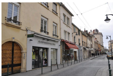
Vue d'ensemble nord ouest de l'immeuble de deux étages IVR82_20146900312NUCA