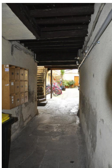
Vue de l'allée