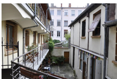
Vue de la cour depuis le palier du premier étage IVR82_20146900320NUCA