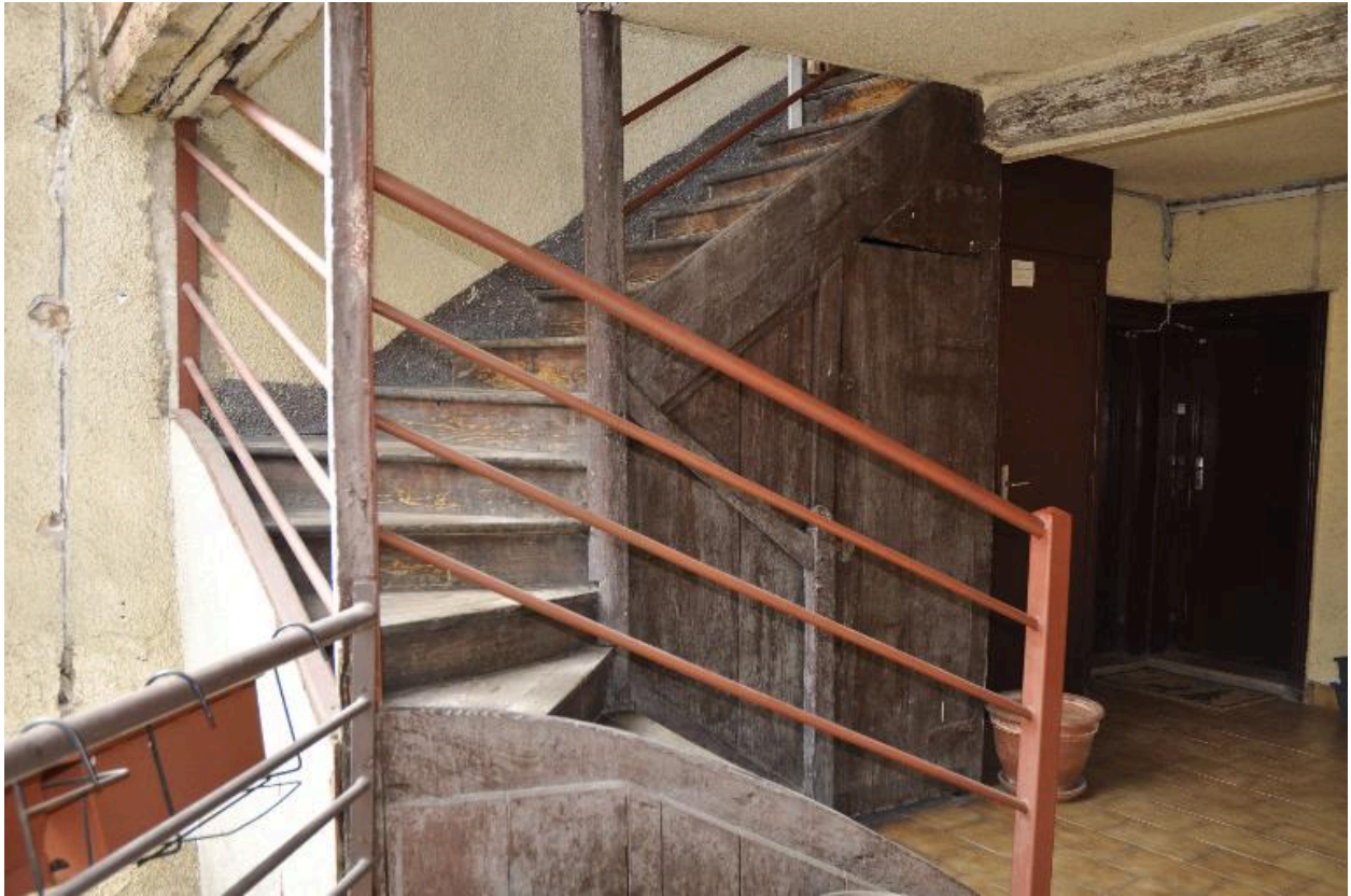
Vue de l'escalier depuis le palier du premier étage