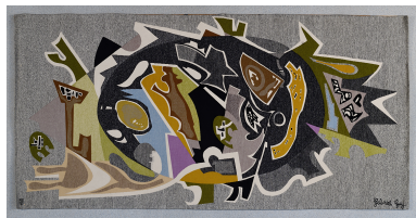
Vue d'ensemble IVR84_20230100013NUCAQ