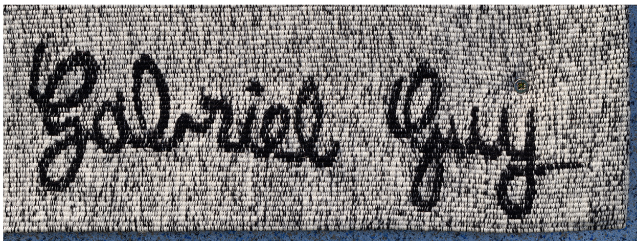
Signature de G. Guy