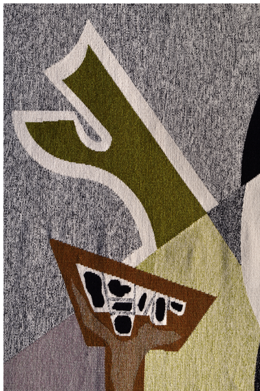
Détail IVR84_20230100014NUCA