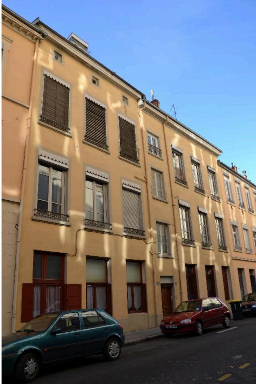
Vue d'ensemble n°20 et 22