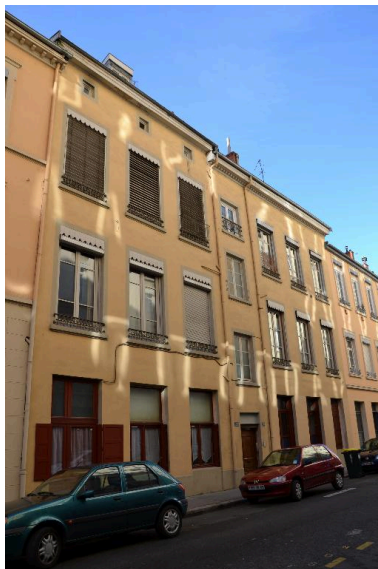
Vue d'ensemble n°20 et 22 IVR82_20156900512NUCA