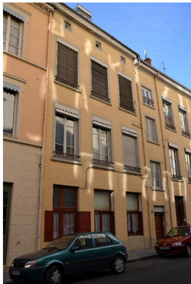
Vue d'ensemble IVR82_20156900511NUCA