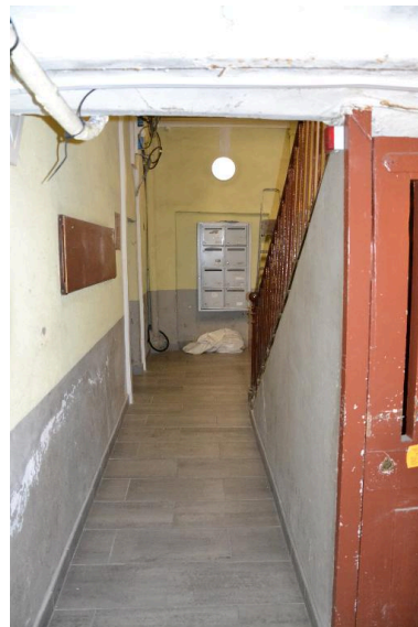
Entrée IVR82_20156900513NUCA