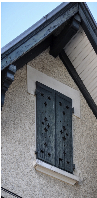
Détail du pignon IVR82_20117300598NUCA