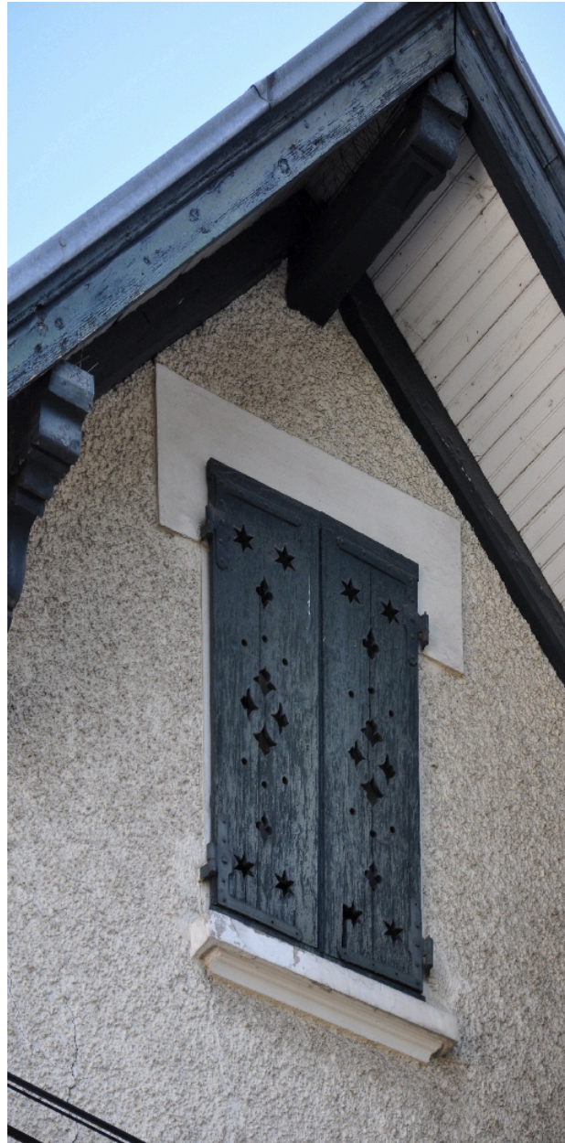
Détail du pignon