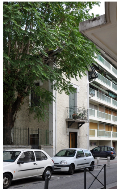
Elévation latérale IVR82_20117300599NUCA