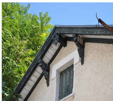
Avant-toit IVR82_20117300597NUCA