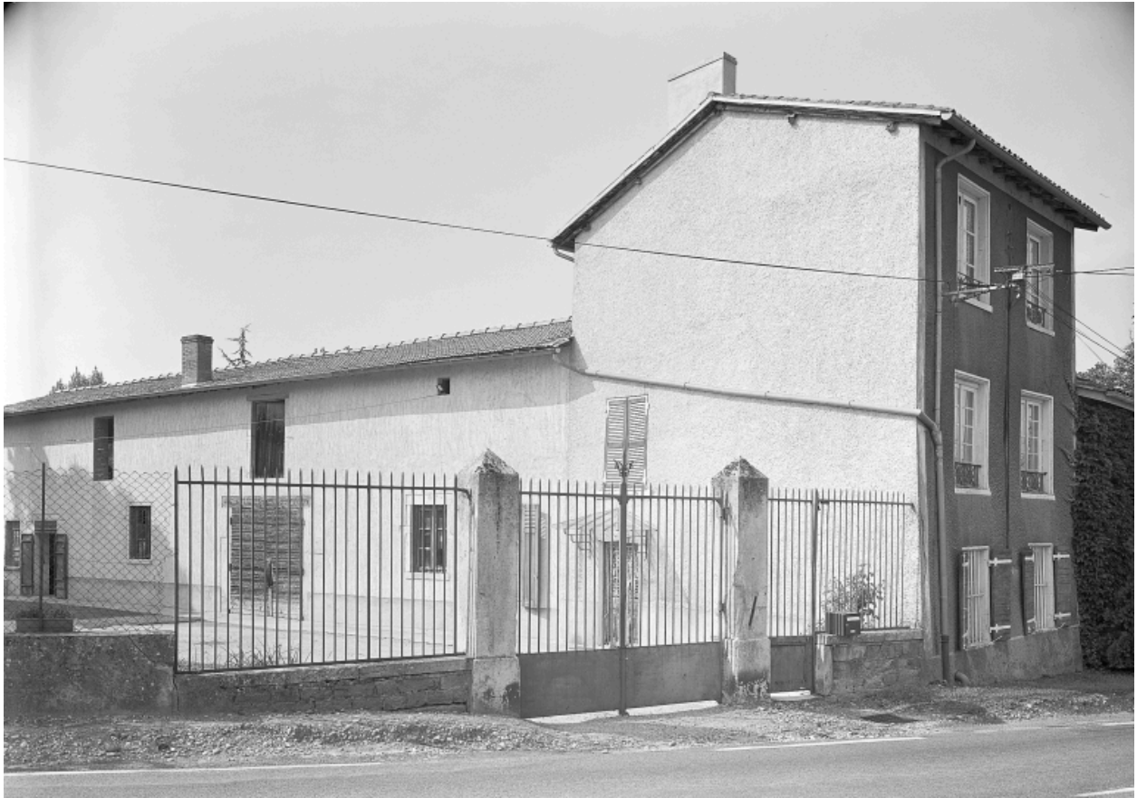
Vue de trois-quarts : logis à droite et dépendances sur cour.