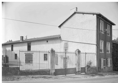
Vue de trois-quarts : logis à droite et dépendances sur cour. IVR82_19910100826P