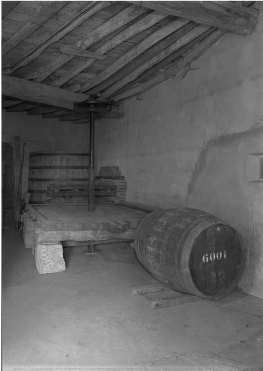
Pressoir et cuvage.