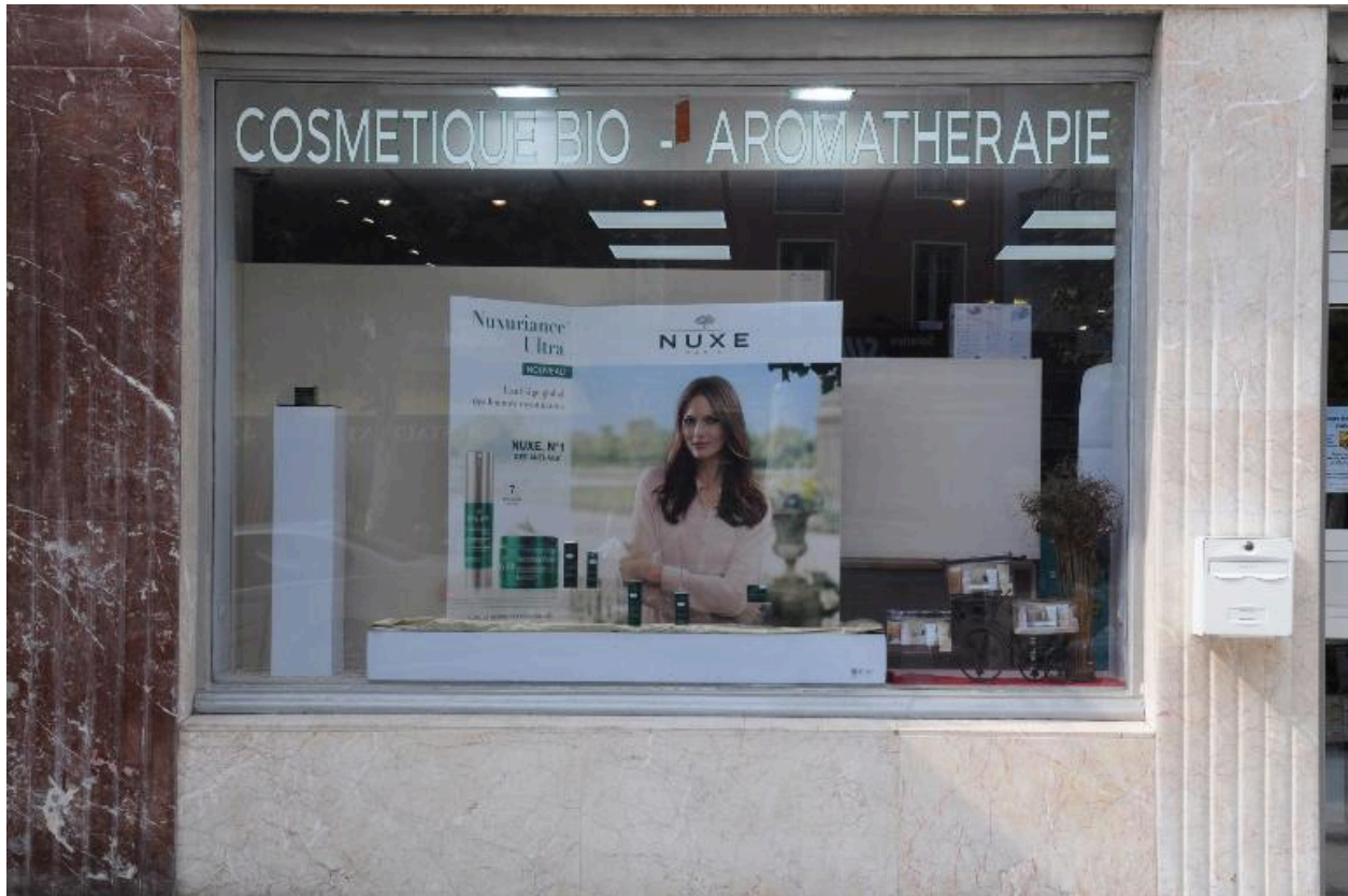
Marbres polychromes de la vitrine