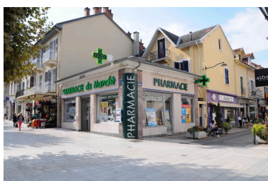
Vue d'ensemble IVR82_20157300954NUCA