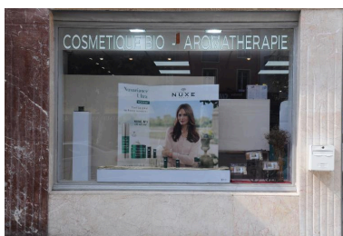
Marbres polychromes de la vitrine

Phot. Denys Harreau IVR82_20157300955NUCA