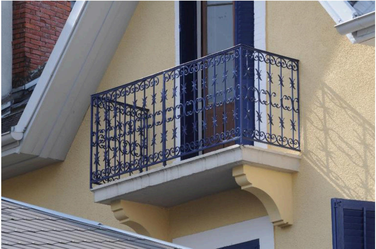
Balcon sur le fronton pignon