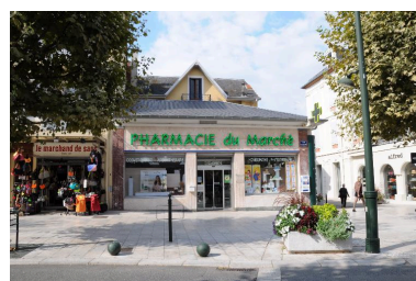
Façades principales IVR82_20157300952NUCA