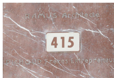
Signatures sur la façade principale