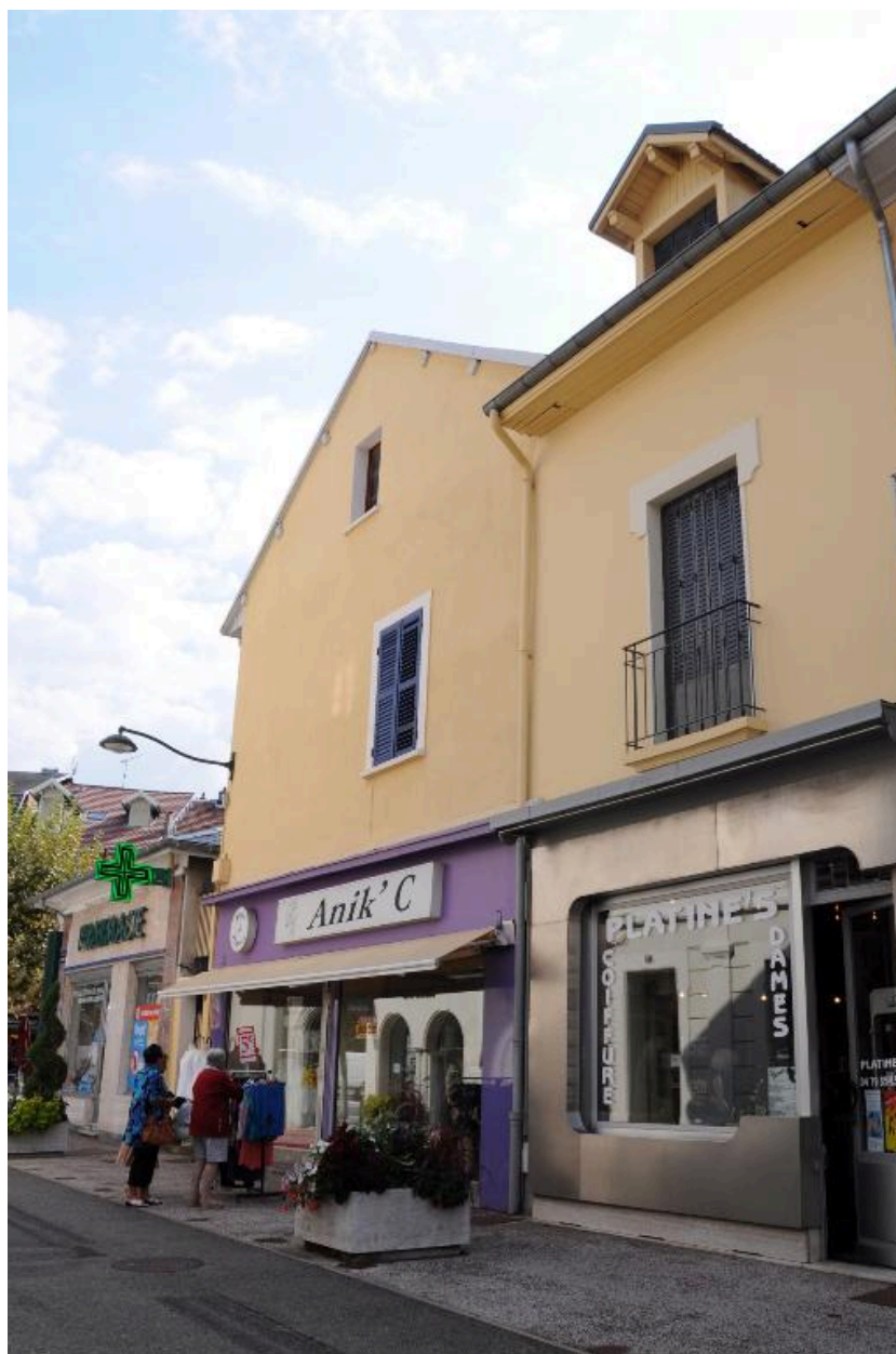
Façades latérales (rue du Commerce)