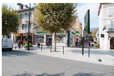
Vue d'ensemble depuis la rue de Genève IVR82_20157301244NUCA