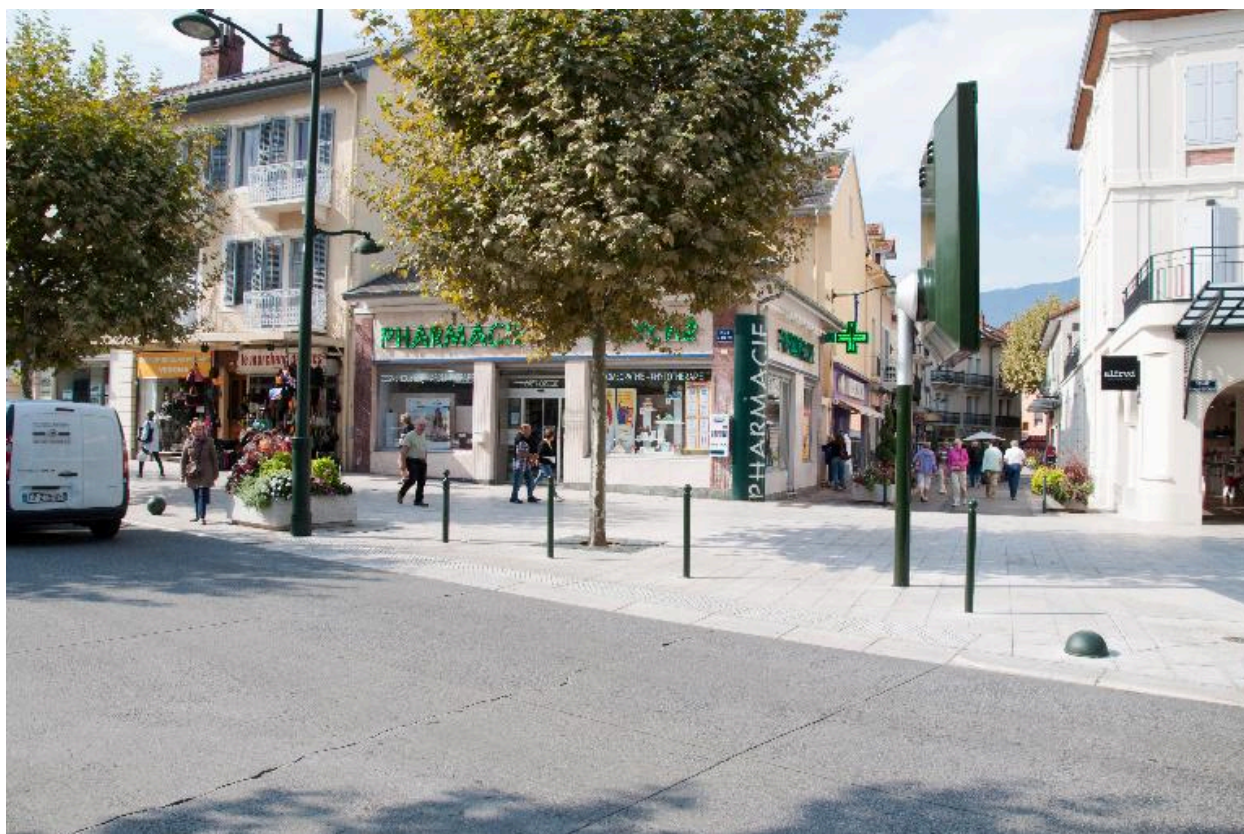
Vue d'ensemble depuis la rue de Genève