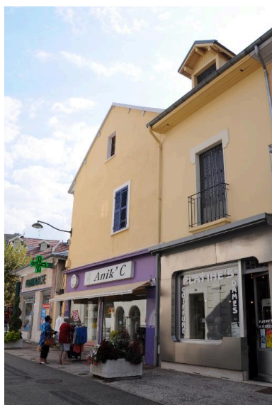
Façades latérales (rue du Commerce)

IVR82_20157300955NUCA