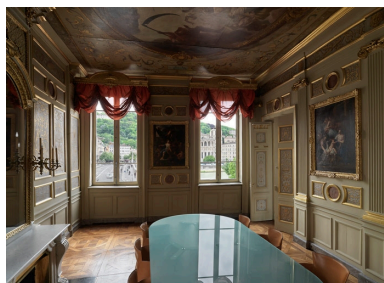
Moitié ouest