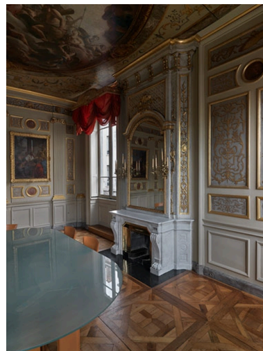
Angle sud-est IVR82_20106902341NUCA