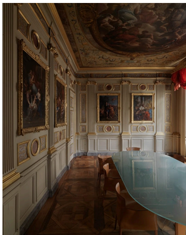
Murs est et nord IVR82_20106902339NUCA