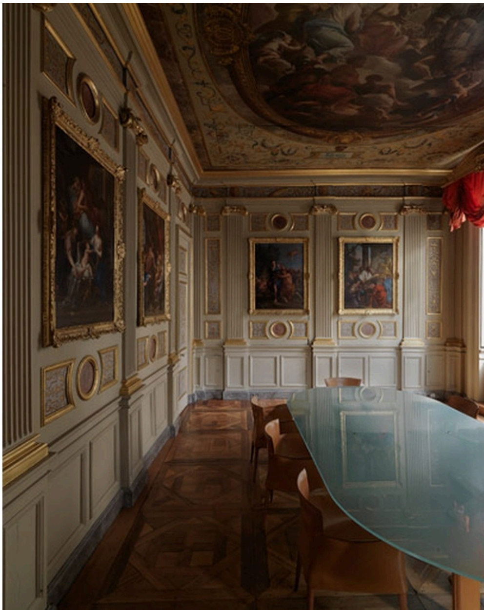
Murs est et nord