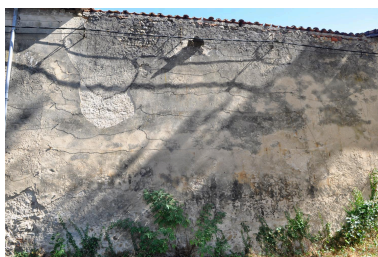
Mur de clôture enclavé entre la maison du jardinier et l'orangerie IVR84_20200101136NUCA