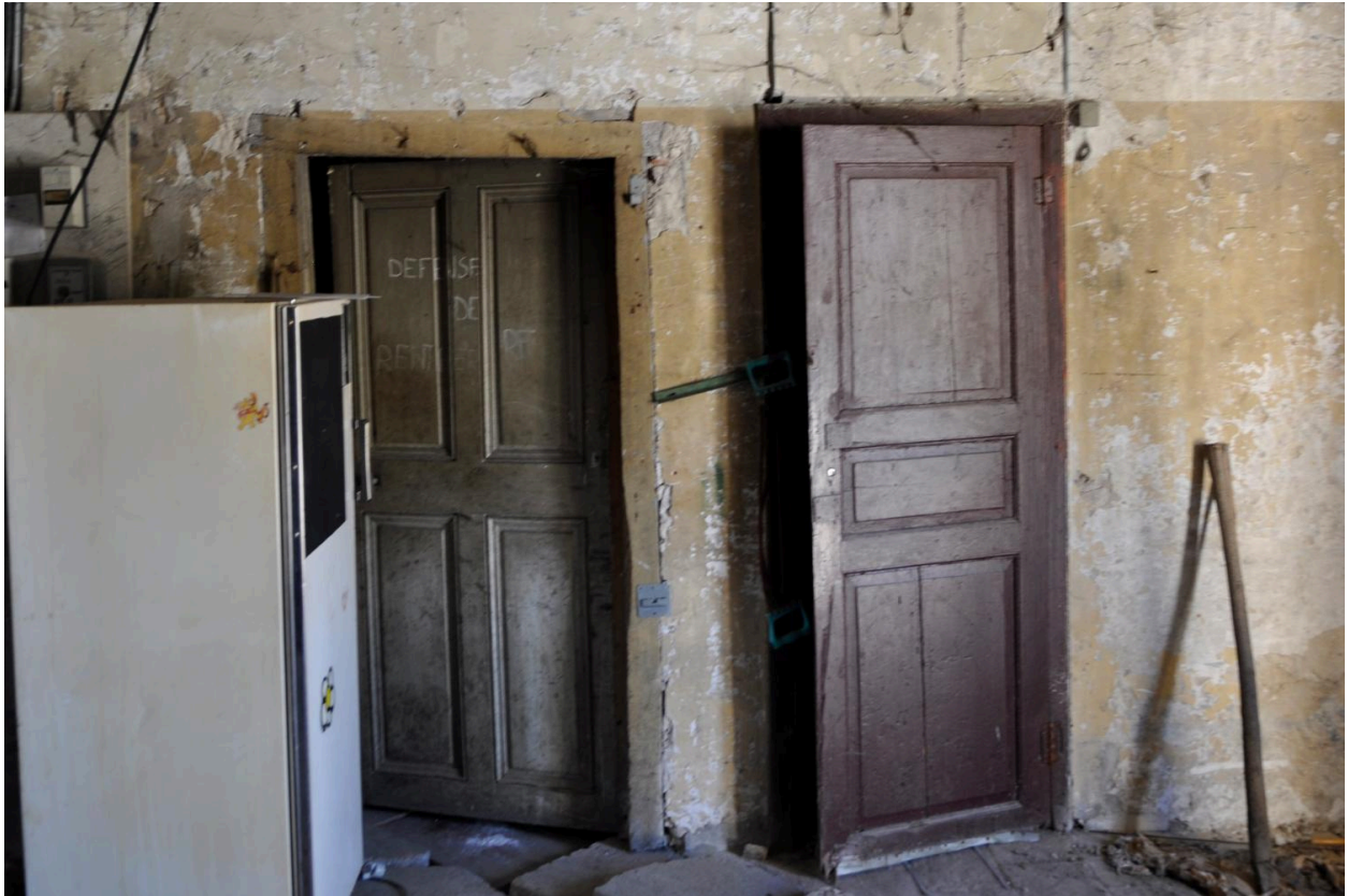
Cuisine, deux portes intérieures jumelées, ouvrant à l'est