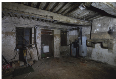
Maison du jardinier, vue intérieure IVR84_20200100864NUCAQ