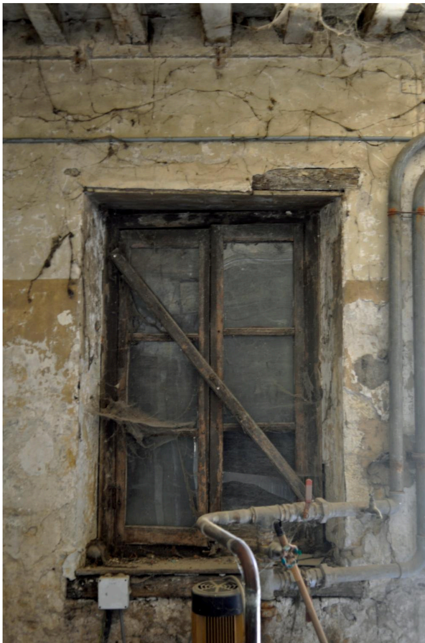
Détail de menuiserie de fenêtre