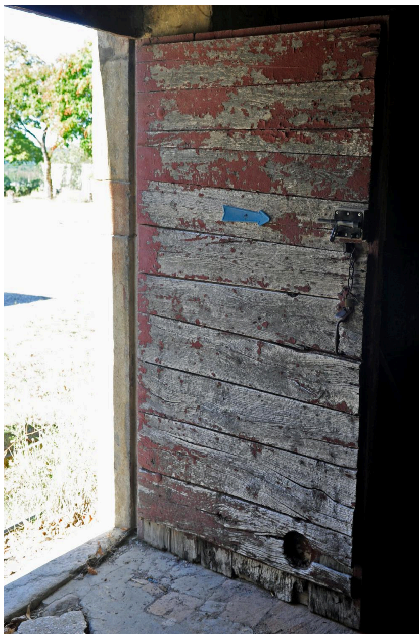
Détail de menuiserie de la porte