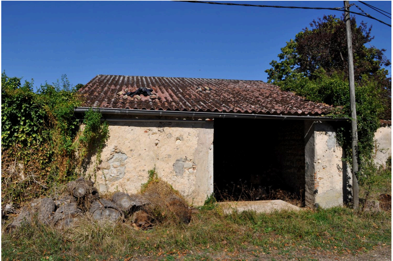
Bûcher, vue frontale