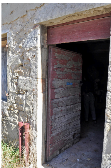
Porte piétonne, vue extérieure IVR84_20200101133NUCA