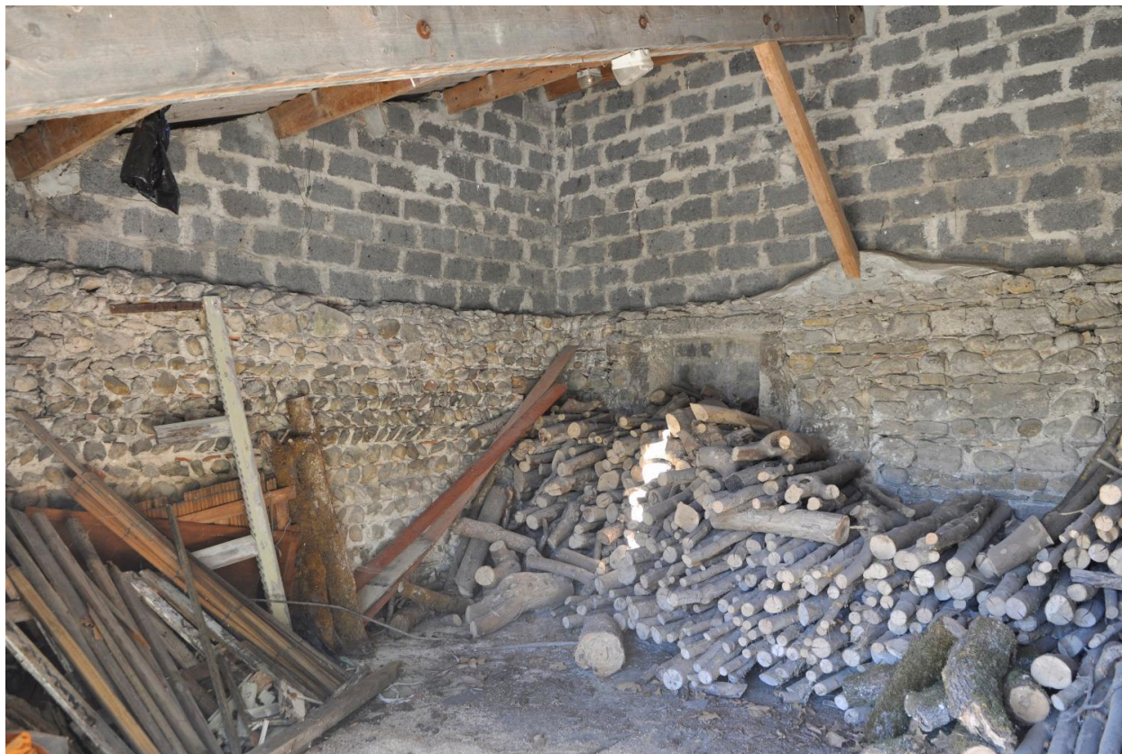
Bûcher, vue intérieure