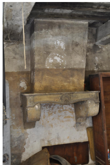
Cuisine, linteau de cheminée du 18e siècle, en remploi