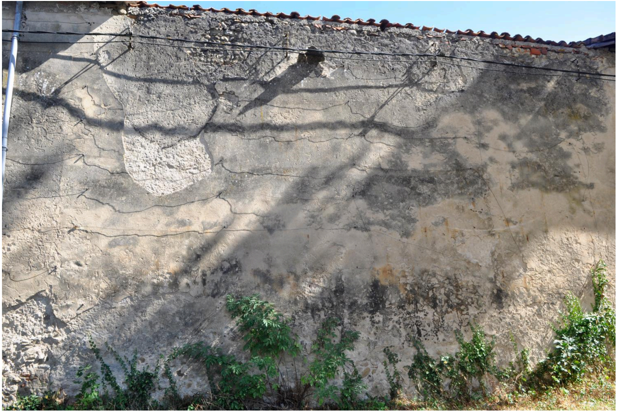
Mur de clôture enclavé entre la maison du jardinier et l'orangerie