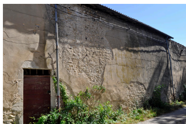
Portion de mur enclavée entre la maison du jardinier et l'orangerie, maçonnerie de galets IVR84_20200101135NUCA