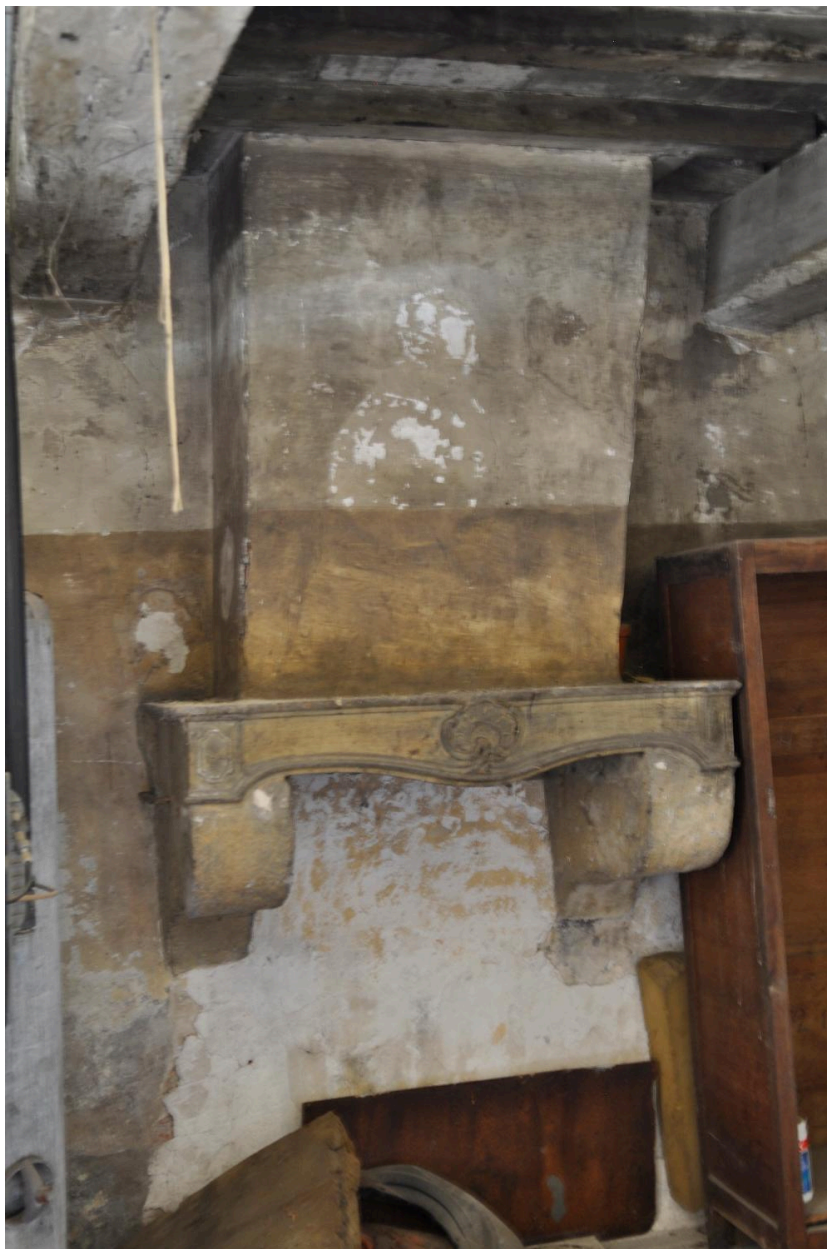
Cuisine, linteau de cheminée du 18e siècle, en emploi