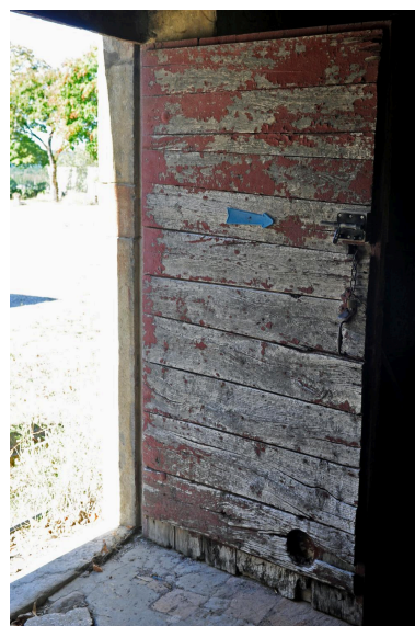
Détail de menuiserie de la porte IVR84_20200101019NUCA