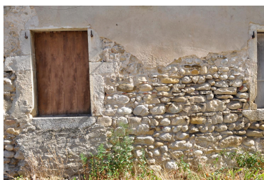
Détail de la maçonnerie en façade