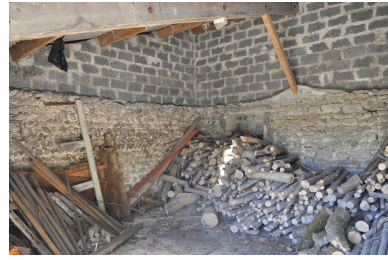
Bûcher, vue intérieure IVR84_20200101129NUCA