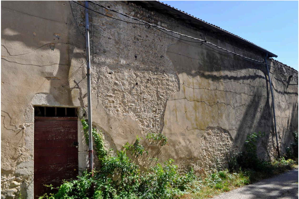
Portion de mur enclavée entre la maison du jardinier et l'orangerie, maçonnerie de galets