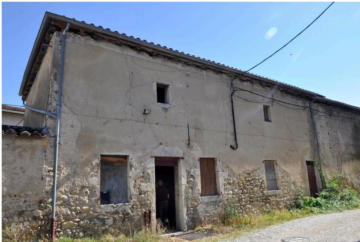
Maison du jardinier, vue extérieure