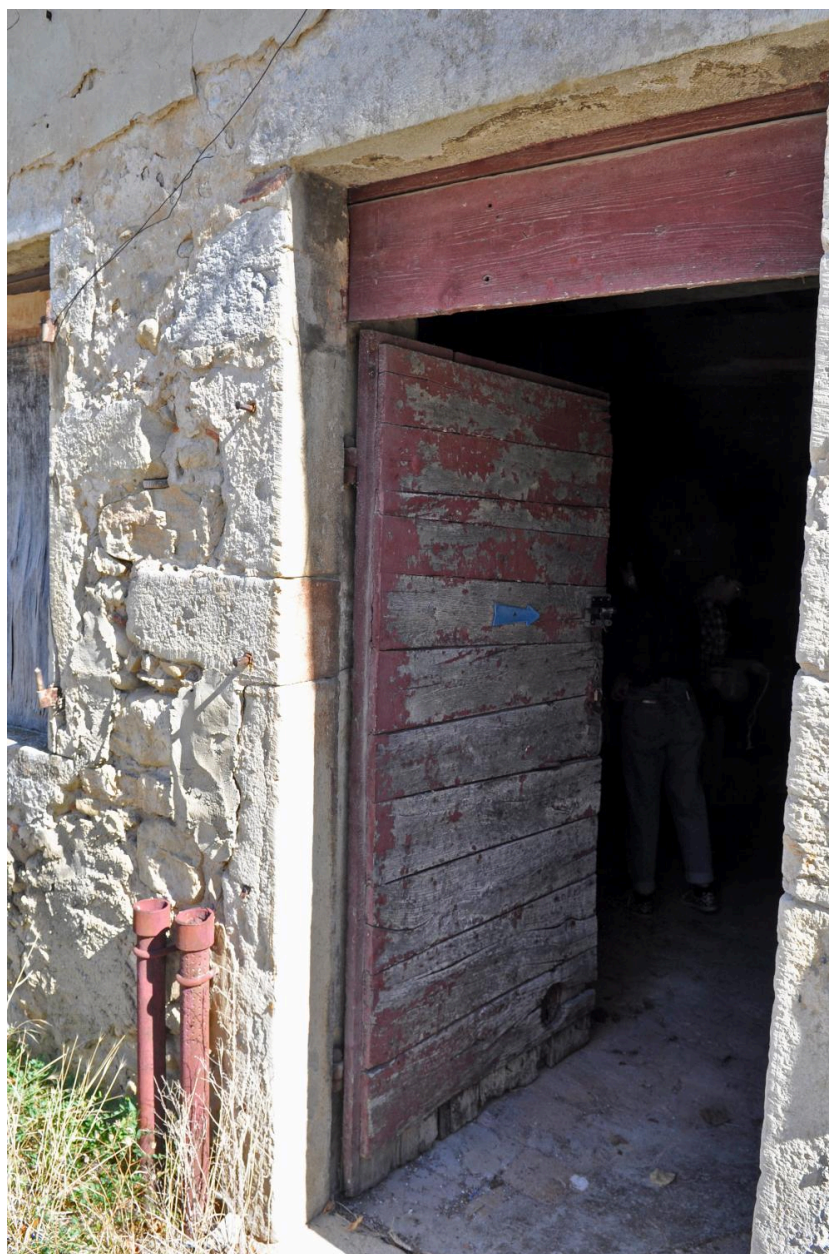
Porte piétonne, vue extérieure