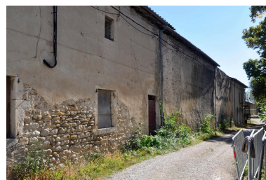
Ensemble du bâtiment dépendant de l'ancienne ferme du château, avec la maison du jardinier à gauche de l'image IVR84_20200101131NUCA