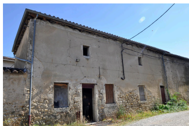
Maison du jardinier, vue extérieure IVR84_20200101130NUCA