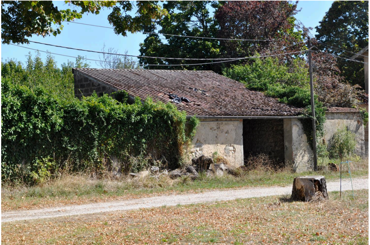
Bûcher, vue générale