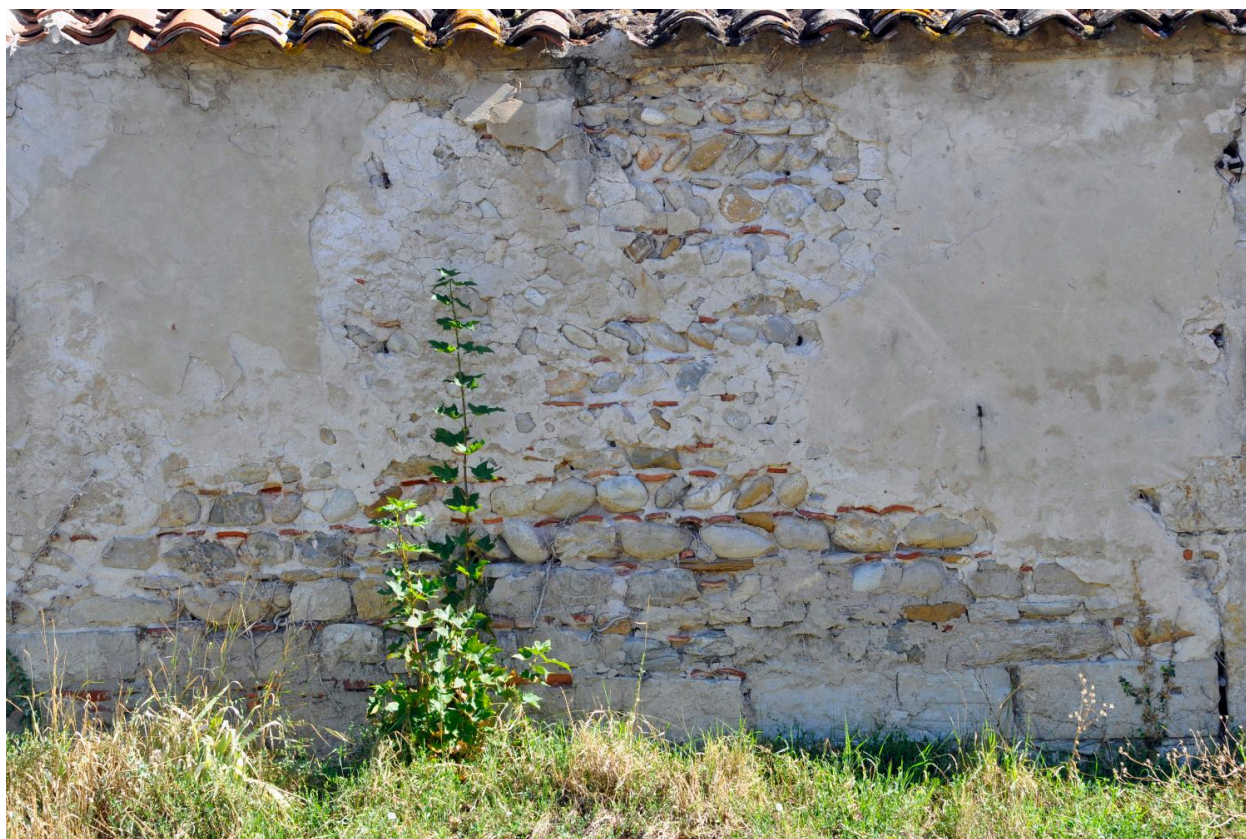
Mur de clôture à l'ouest de la maison du jardinier, maçonnerie de moellons, galets et tuiles