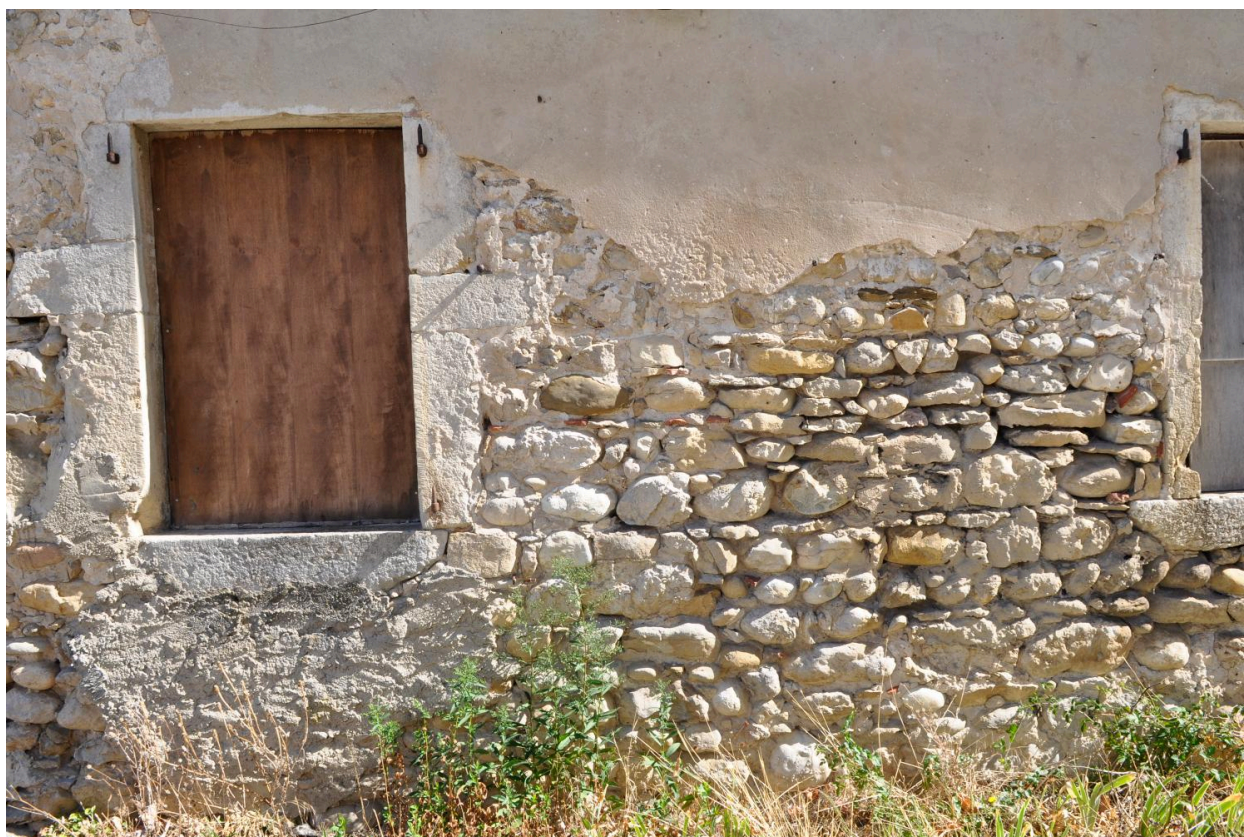
Détail de la maçonnerie en façade