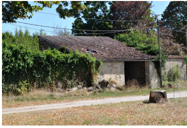
Bûcher, vue générale IVR84_20200101049NUCA