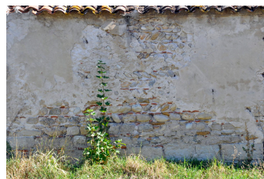
Mur de clôture à l'ouest de la maison du jardinier, maçonnerie de moellons, galets et tuiles IVR84_20200101018NUCA