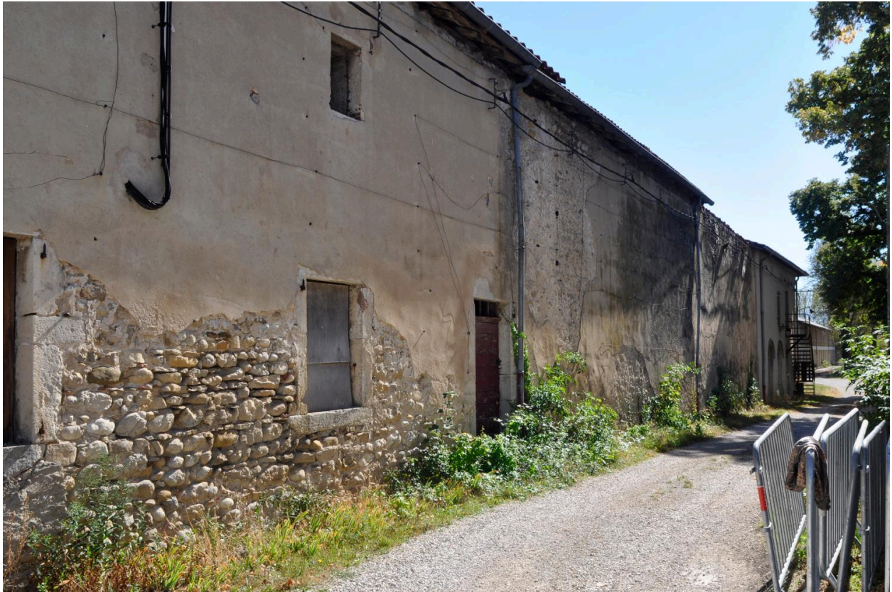
Ensemble du bâtiment dépendant de l'ancienne ferme du château, avec la maison du jardinier à gauche de l'image