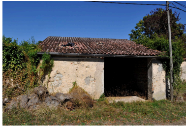
Bûcher, vue frontale