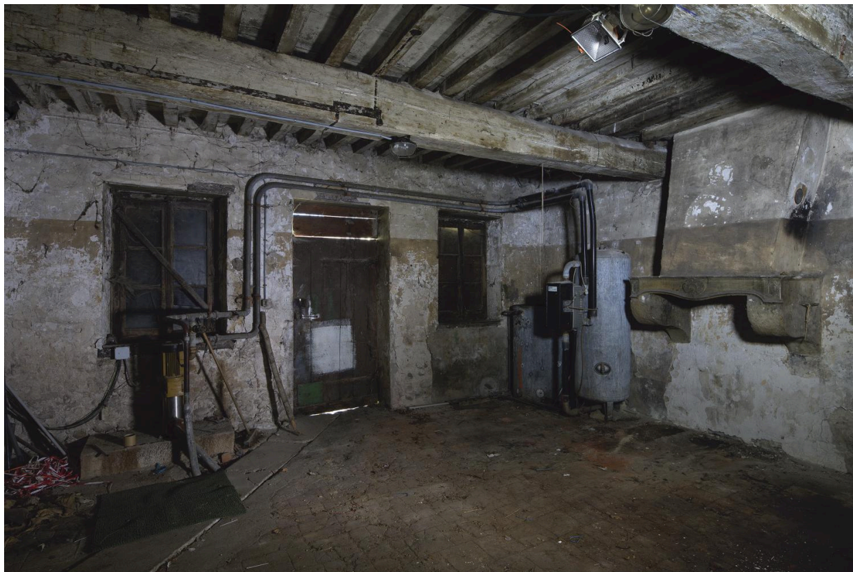
Maison du jardinier, vue intérieure