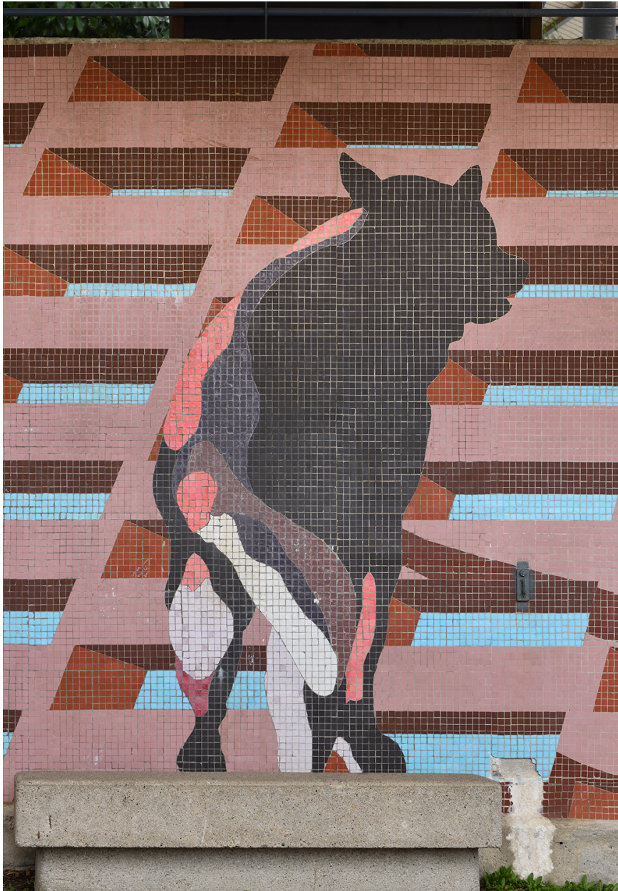
Détail : la louve