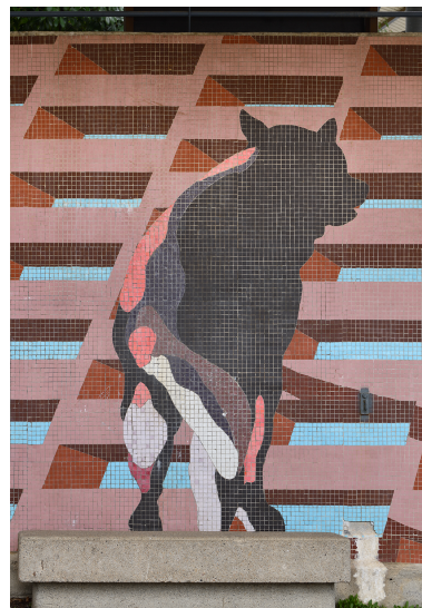
Détail : la louve IVR84_20230100026NUCAQ