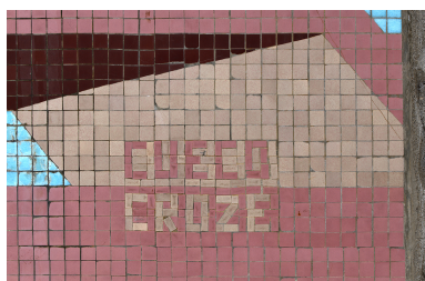
Signature