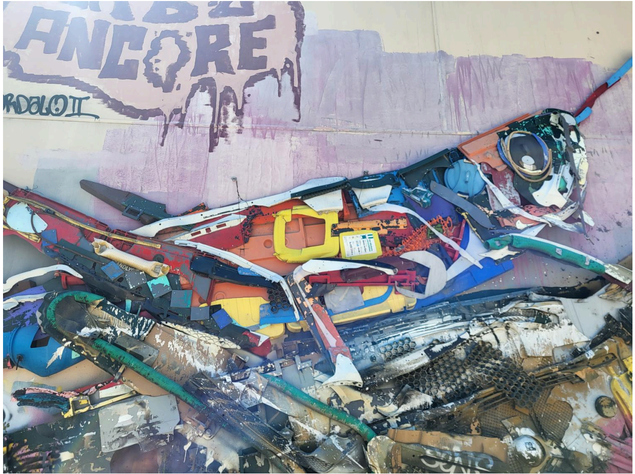
Entrepôt industriel Gerland, art urbain, ou street art