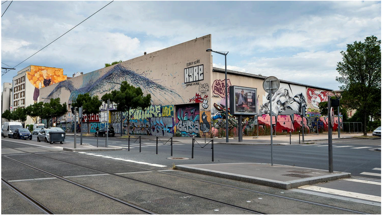
Entrepôt industriel rue Debourg