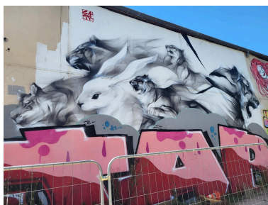
Entrepôt industriel Gerland, art urbain, ou street art IVR84_20266900335NUCA