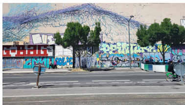
Entrepôt industriel Gerland