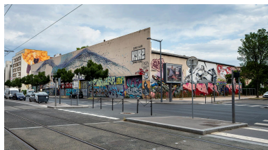
Entrepôt industriel rue Debourg IVR84_20256900909NUCA