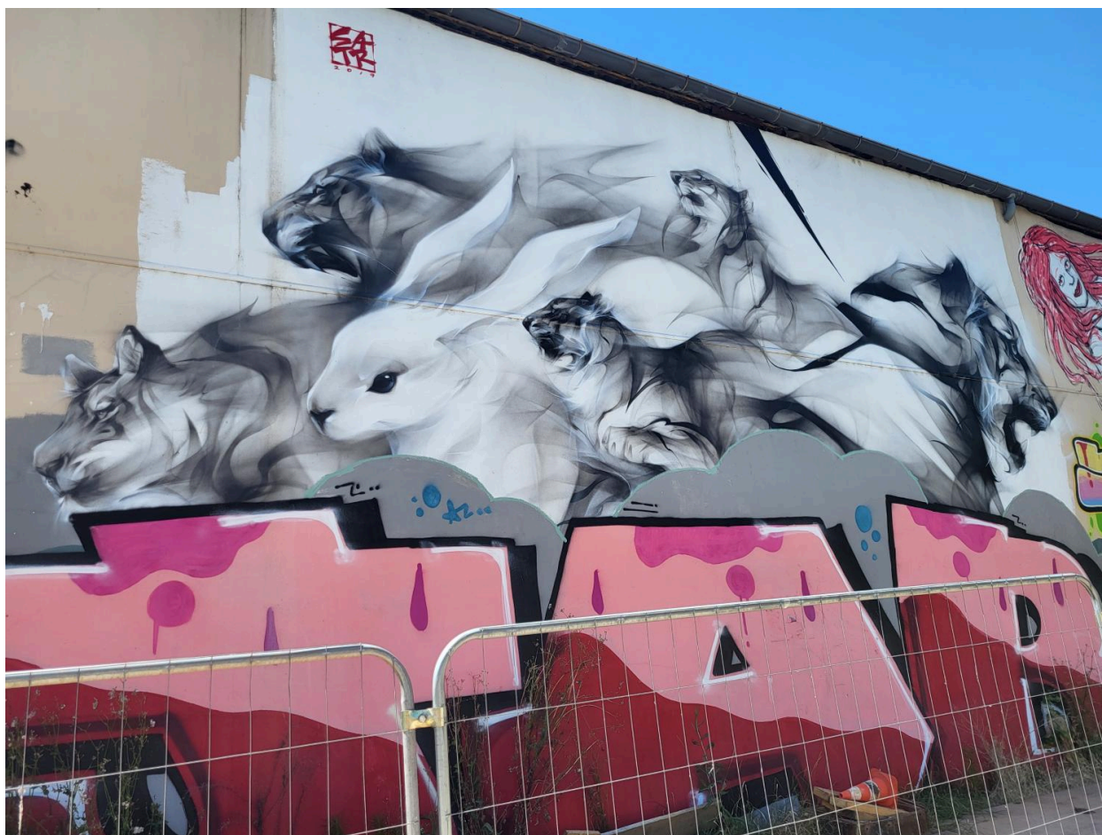
Entrepôt industriel Gerland, art urbain, ou street art