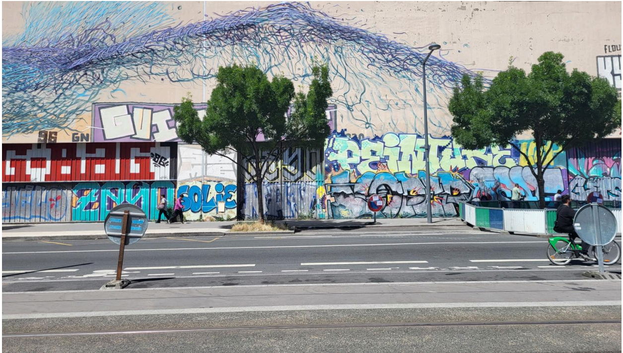
Entrepôt industriel Gerland