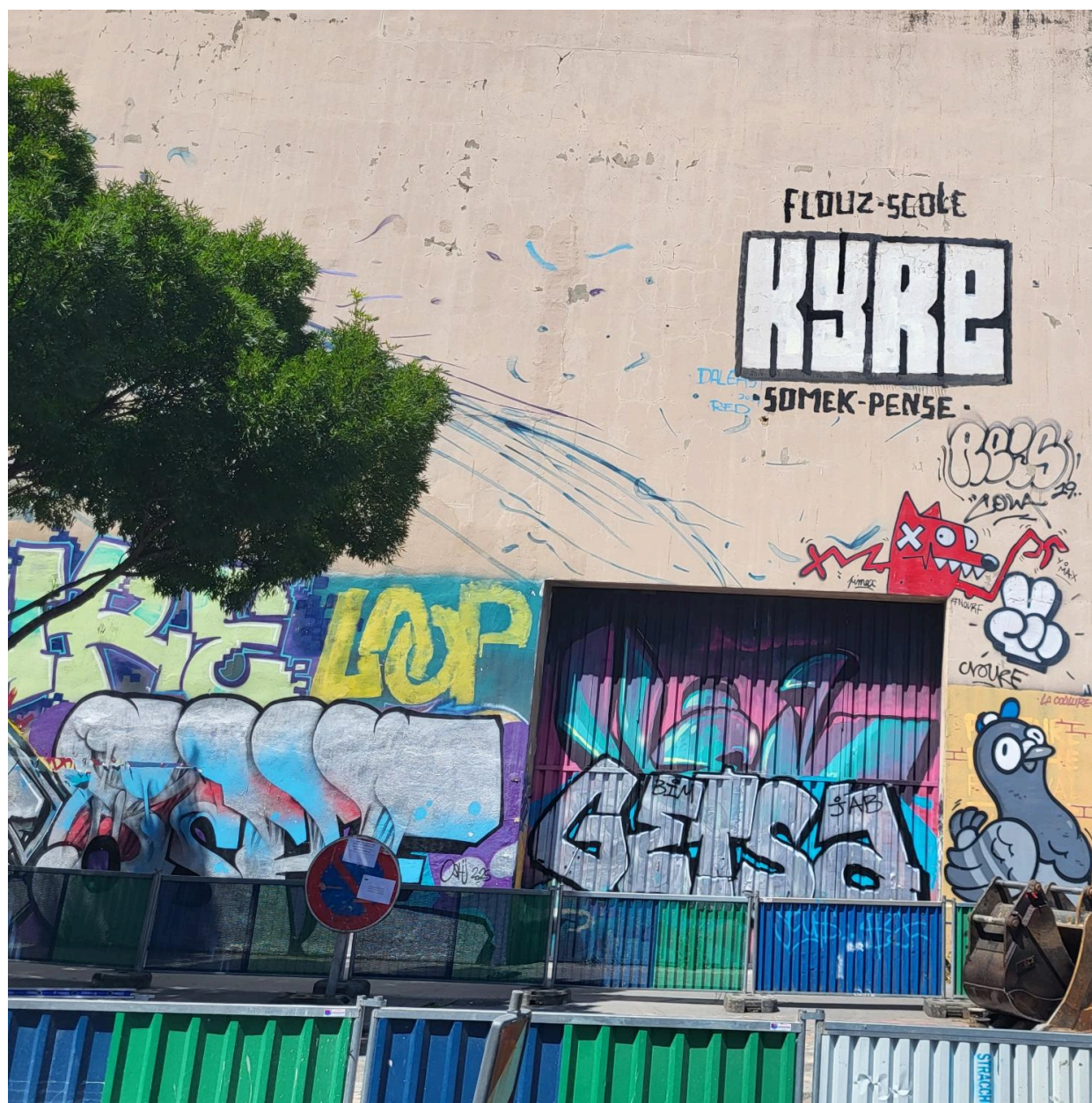
Entrepôt industriel Gerland, art urbain ou street art