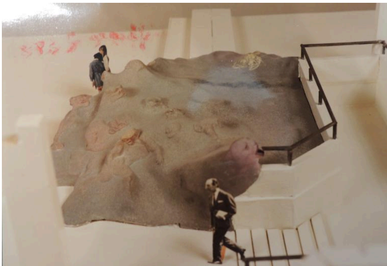
Maquette de l'œuvre (Roig, 1982) (AN 20020101/98).