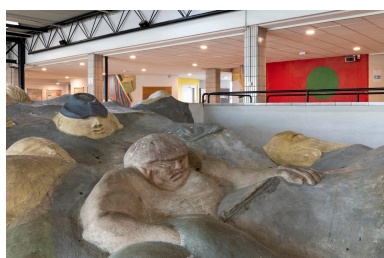
Vue rapprochée.