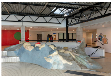
Vue d'ensemble. IVR84_20216900333NUCA