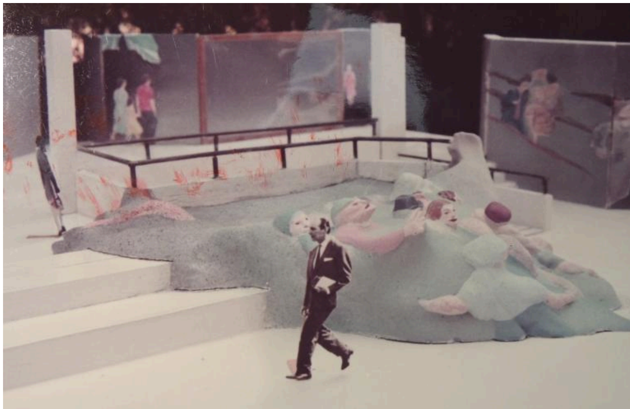
Maquette de l'œuvre (Roig, 1982) (AN 20020101/98).