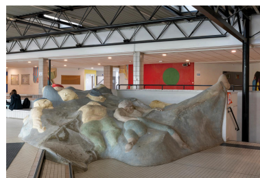
Vue d'ensemble. IVR84_20216900332NUCA