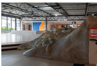
Vue de côté. IVR84_20216900335NUCA