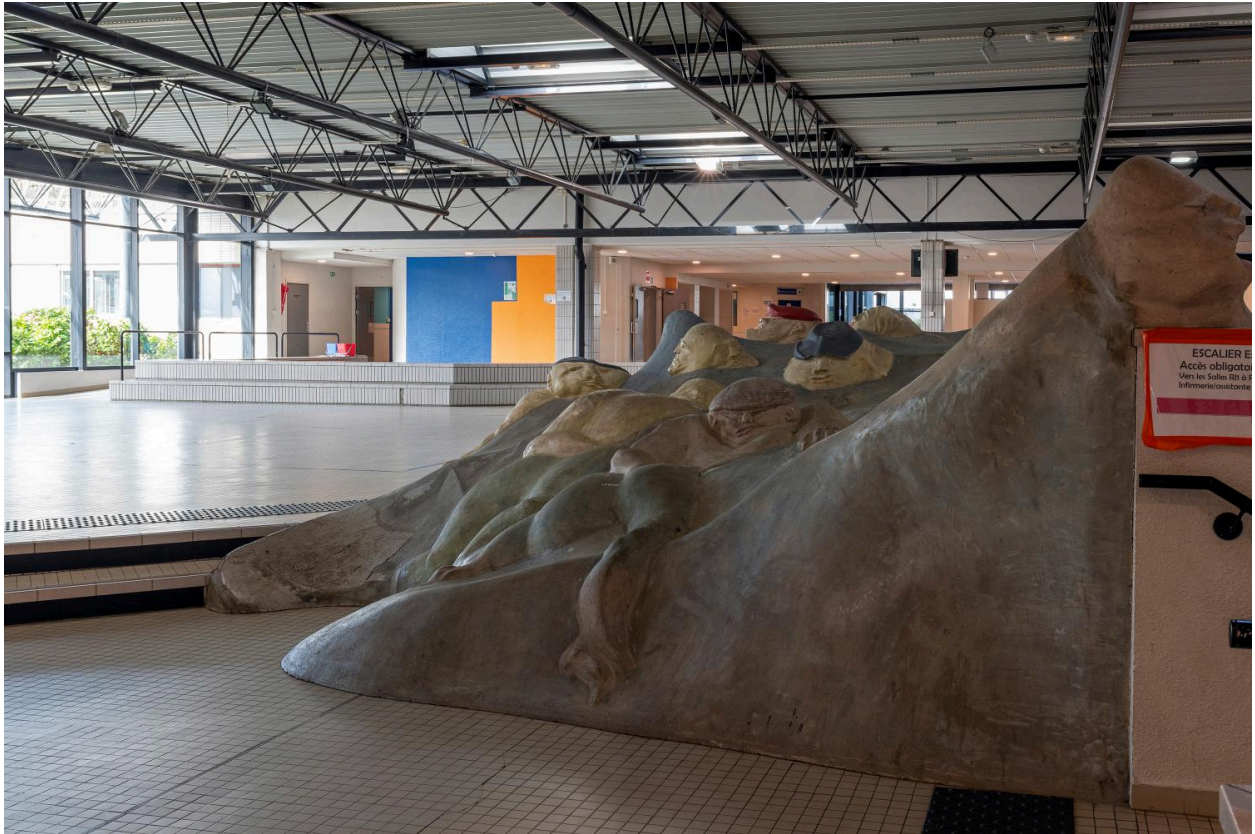
Vue de côté.