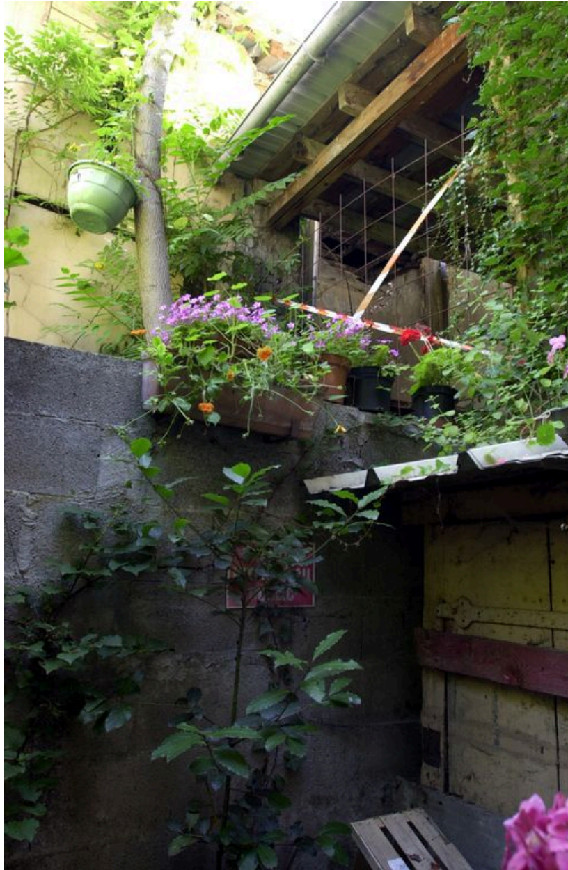
Vue de la façade