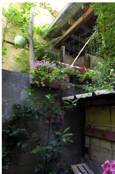
Vue de la façade IVR82_20106903700NUCA