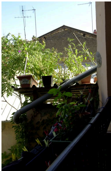
Vue générale depuis une coursière de l'immeuble sur rue IVR82_20106903698NUCA