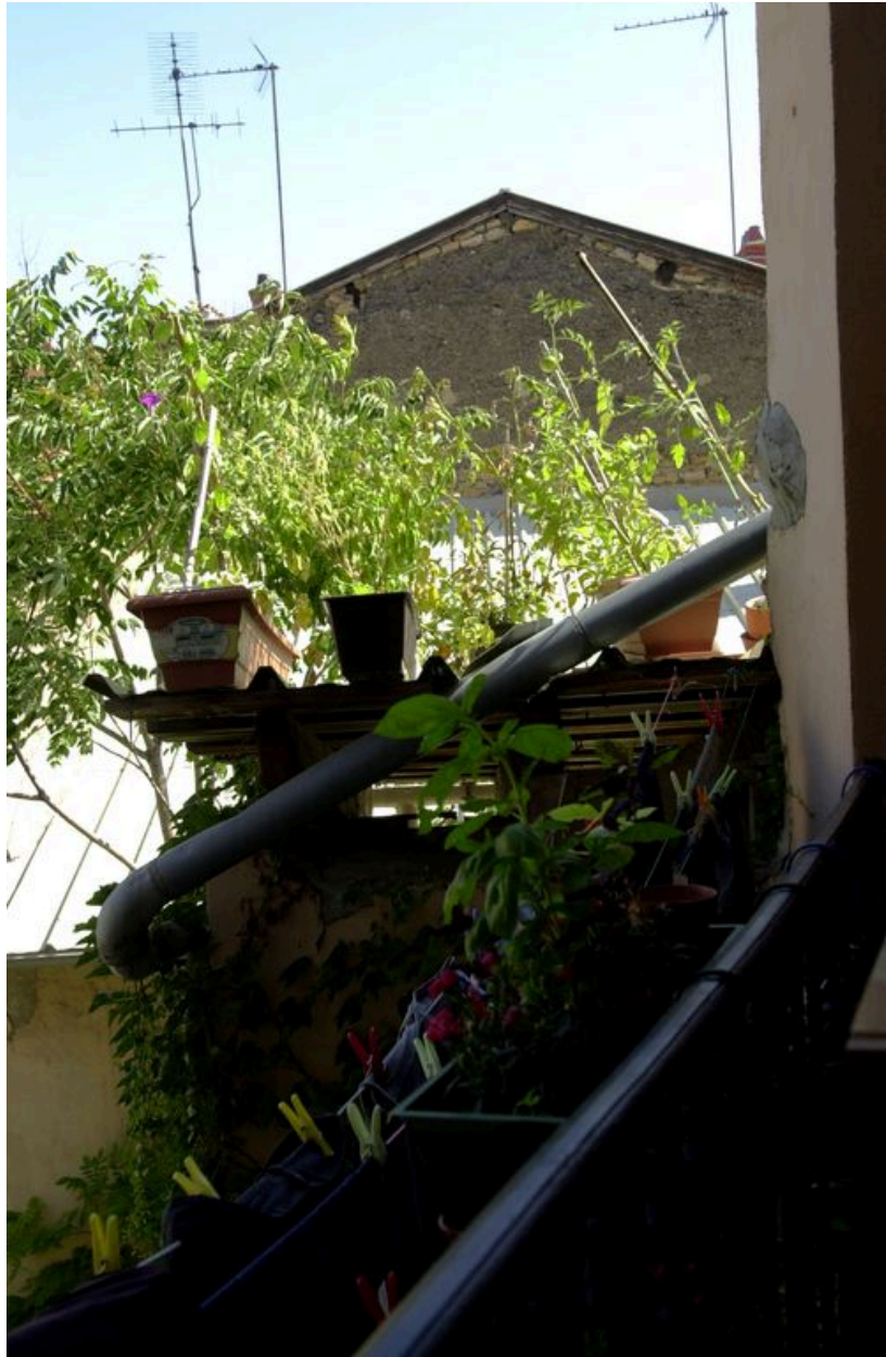
Vue générale depuis une coursière de l'immeuble sur rue