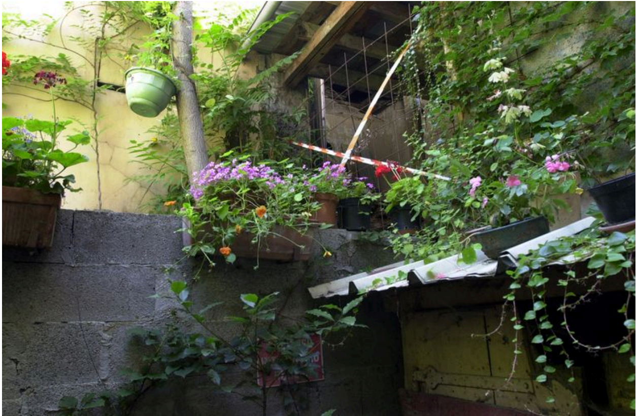
Vue de la façade