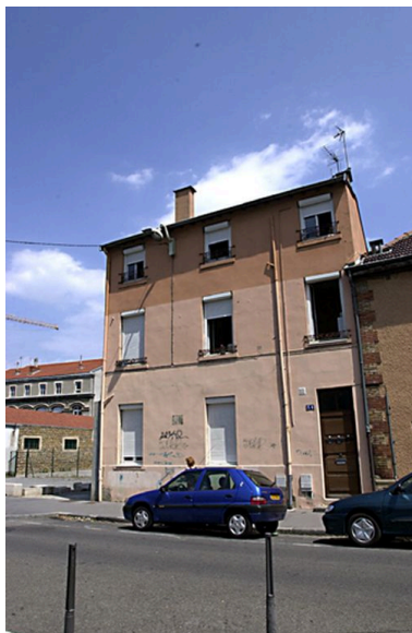
Vue générale IVR82_20036900468NUCA