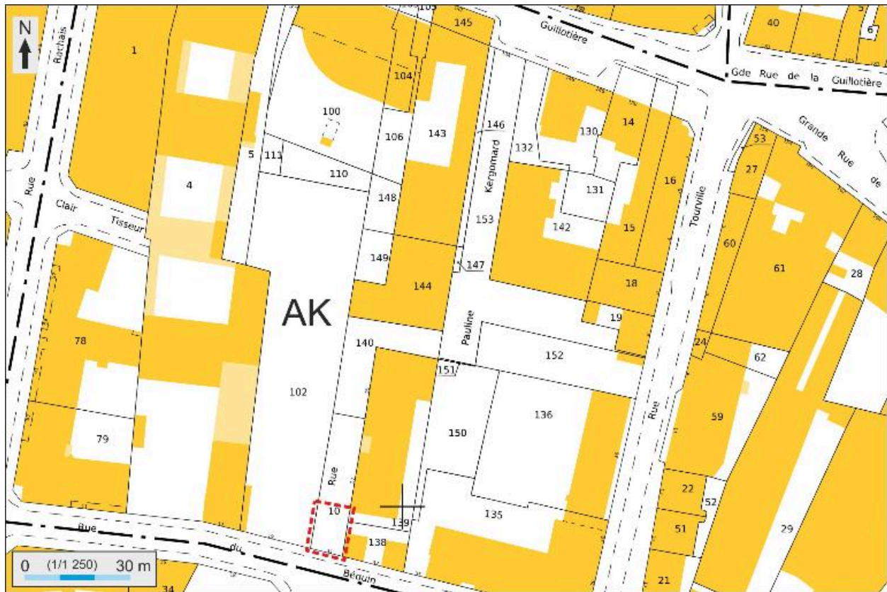
Plan masse et de situation