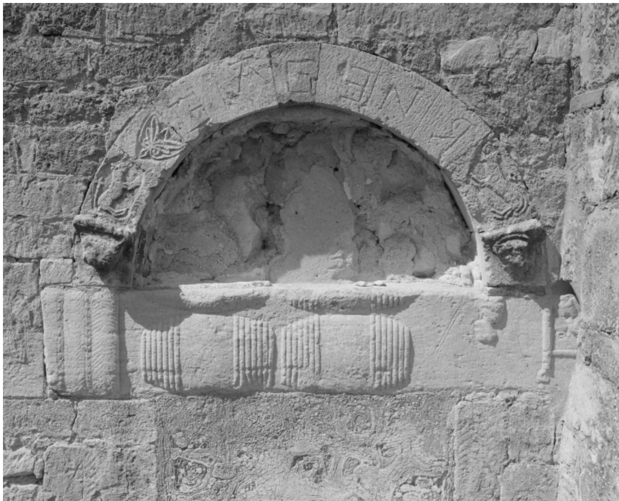
Porte méridionale, détail : vue du couvrement, arc orné de marques de tâcherons, de reliefs semi-méplats et de hauts-reliefs (linteau en rempli).