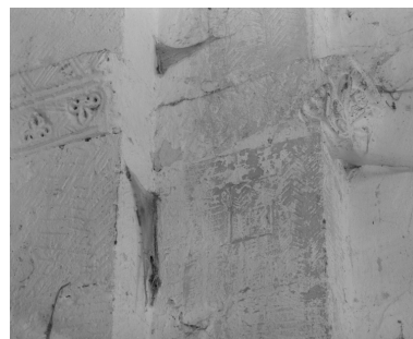
Détails de taille de pierre et de sculpture : imposte de l'arc triomphal et chapiteau ou imposte de l'arc formeret droit.