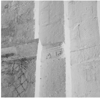
Détails de sculpture : imposte de l'arc triomphal à décor de fleurs de lys tête-bêche. IVR82_20012600060X