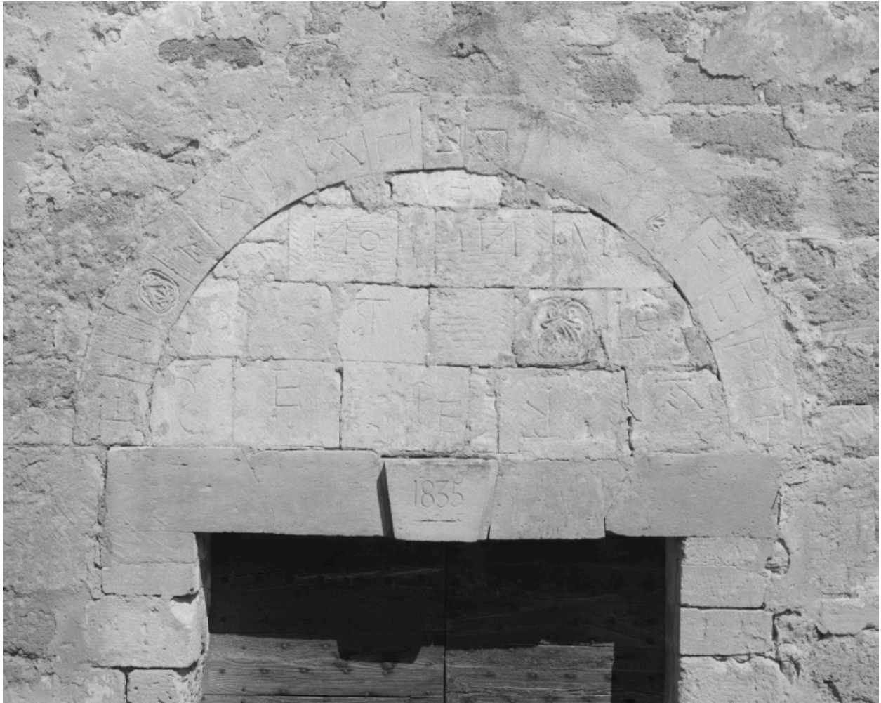
Porte ouest, détail : arc et tympan.