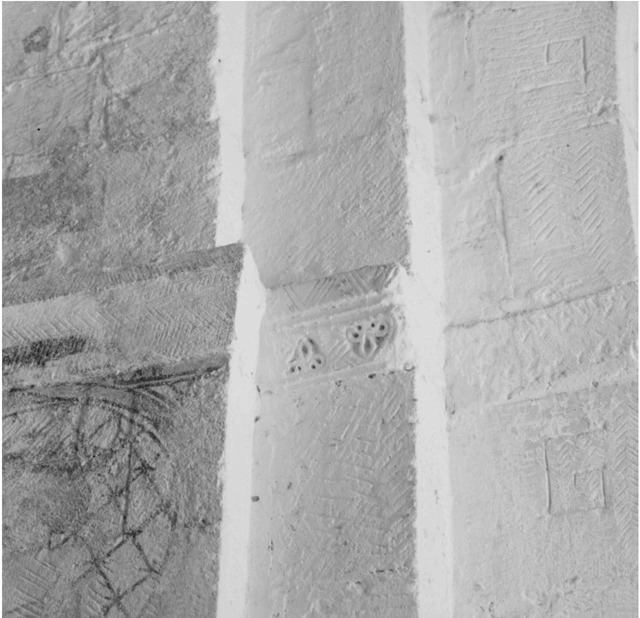
Détails de sculpture : imposte de l'arc triomphal à décor de fleurs de lys tête-bêche.