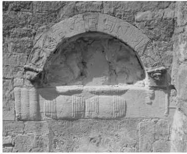
Porte méridionale, détail : vue du couvrement, arc orné de marques de tâcherons, de reliefs semi-méplats et de hauts-reliefs (linteau en remploi).