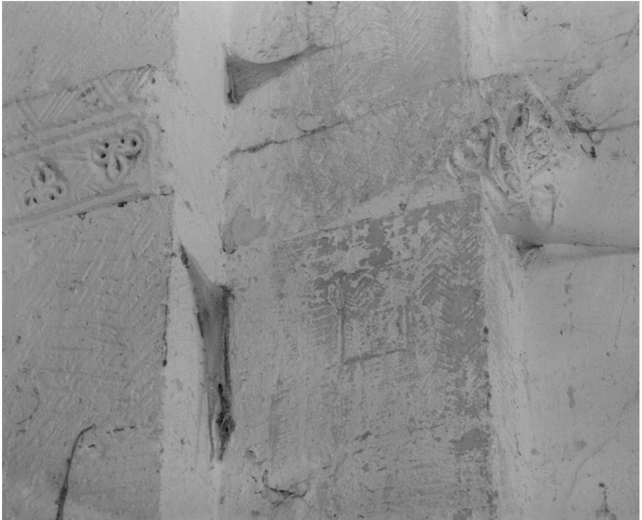
Détails de taille de pierre et de sculpture : imposte de l'arc triomphal et chapiteau ou imposte de l'arc formeret droit.