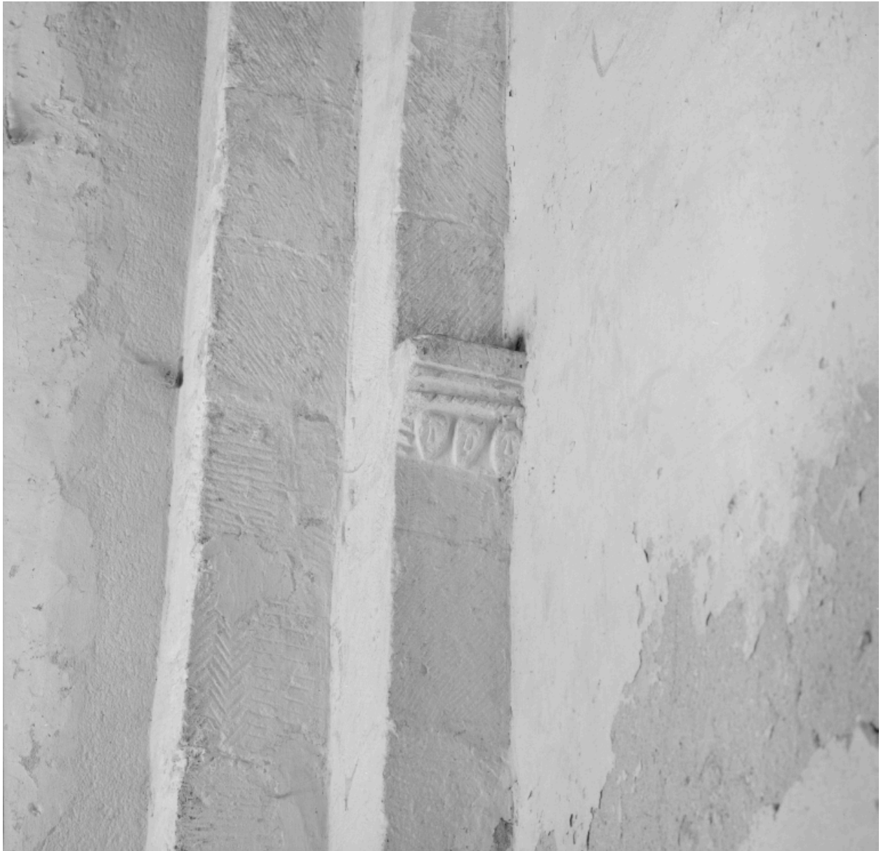
Nef, 1ère travée, mur gauche, détail de sculpture : imposte gauche de l'arc formeret à décor de chevrons surmontant trois visages humains.