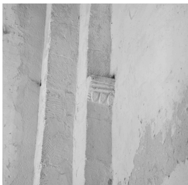
Nef, 1ère travée, mur gauche, détail de sculpture : imposte gauche de l'arc formeret à décor de chevrons surmontant trois visages humains.