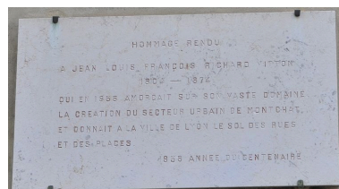
Vue de la plaque apposée en 1958 sur l'élévation ouest.