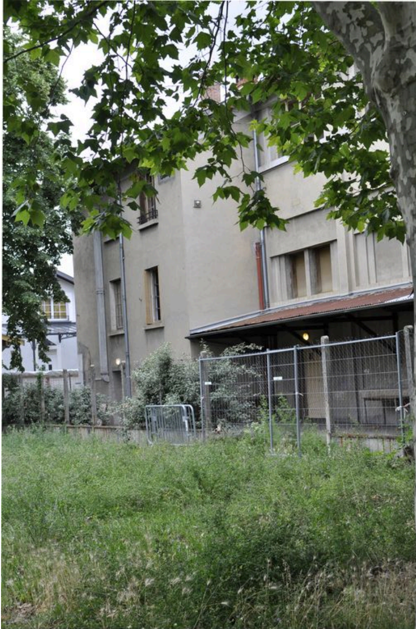
Vue de l'élévation est.