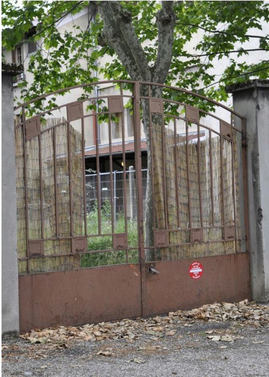
Détail du portail, situé allée du Château Montchat, à l'arrière de la parcelle, au nord.