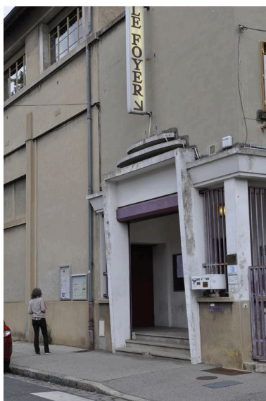
Vue de l'entrée (élévation ouest).