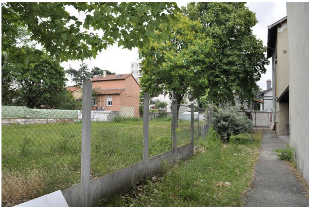
Vue du terrain limitrophe de l'élévation est.