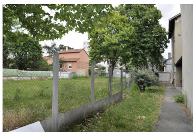
Vue du terrain limitrophe de l'élévation est. IVR82_20116902190NUCA