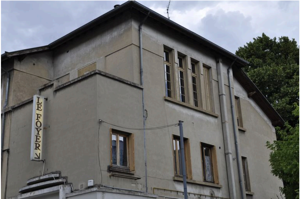
Détail des ouvertures de l'élévation sud.