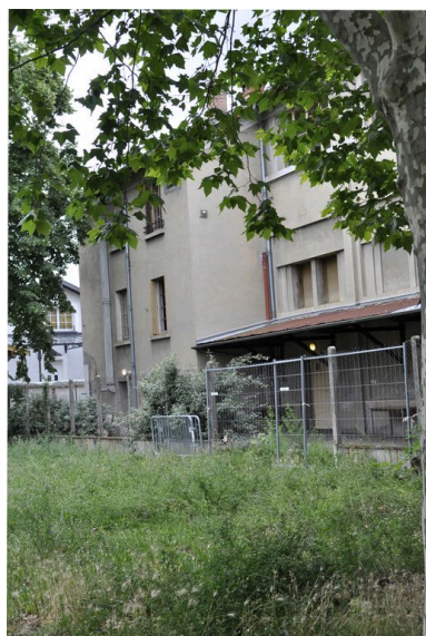
Vue de l'élévation est. IVR82_20116902189NUCA