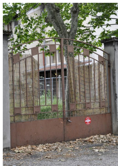
Détail du portail, situé allée du Château Montchat, à l'arrière de la parcelle, au nord.