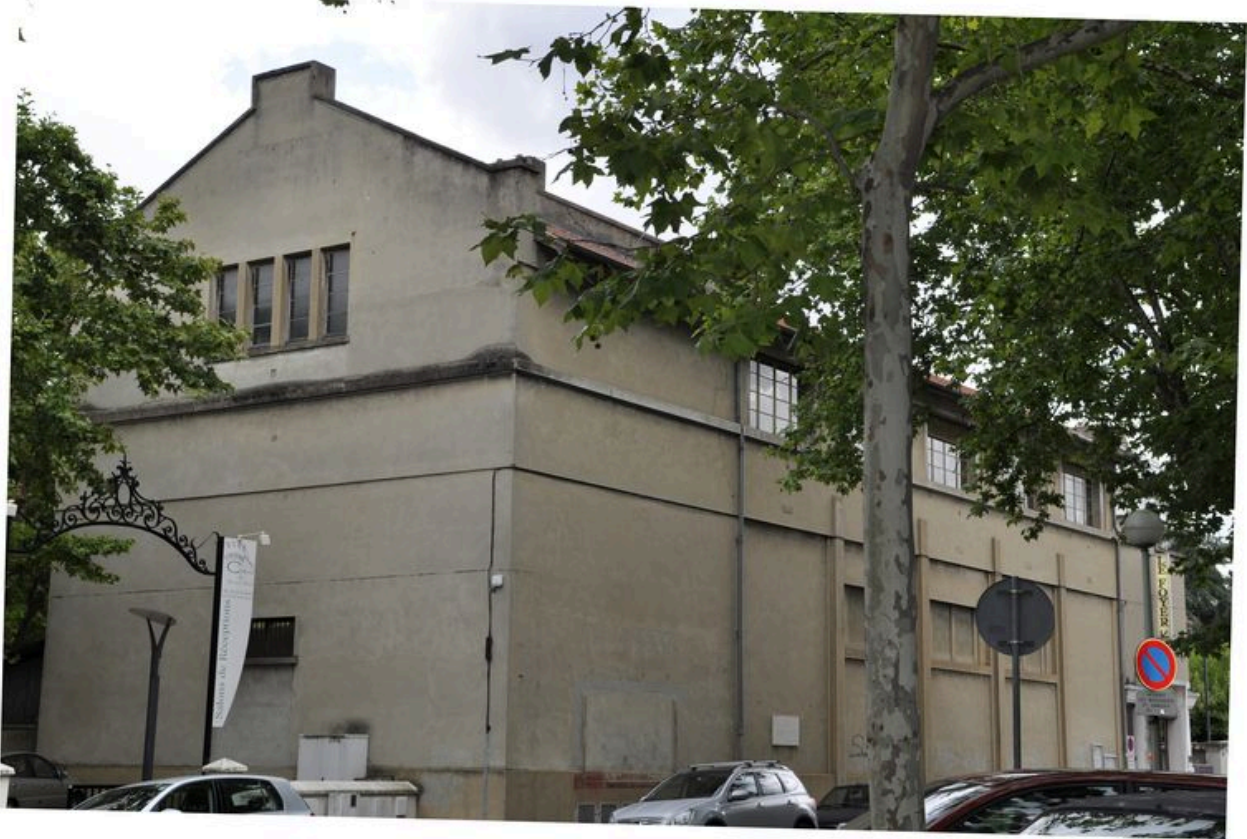
Vue générale depuis le nord.