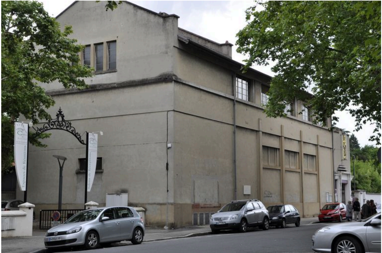
Vue générale depuis le nord.