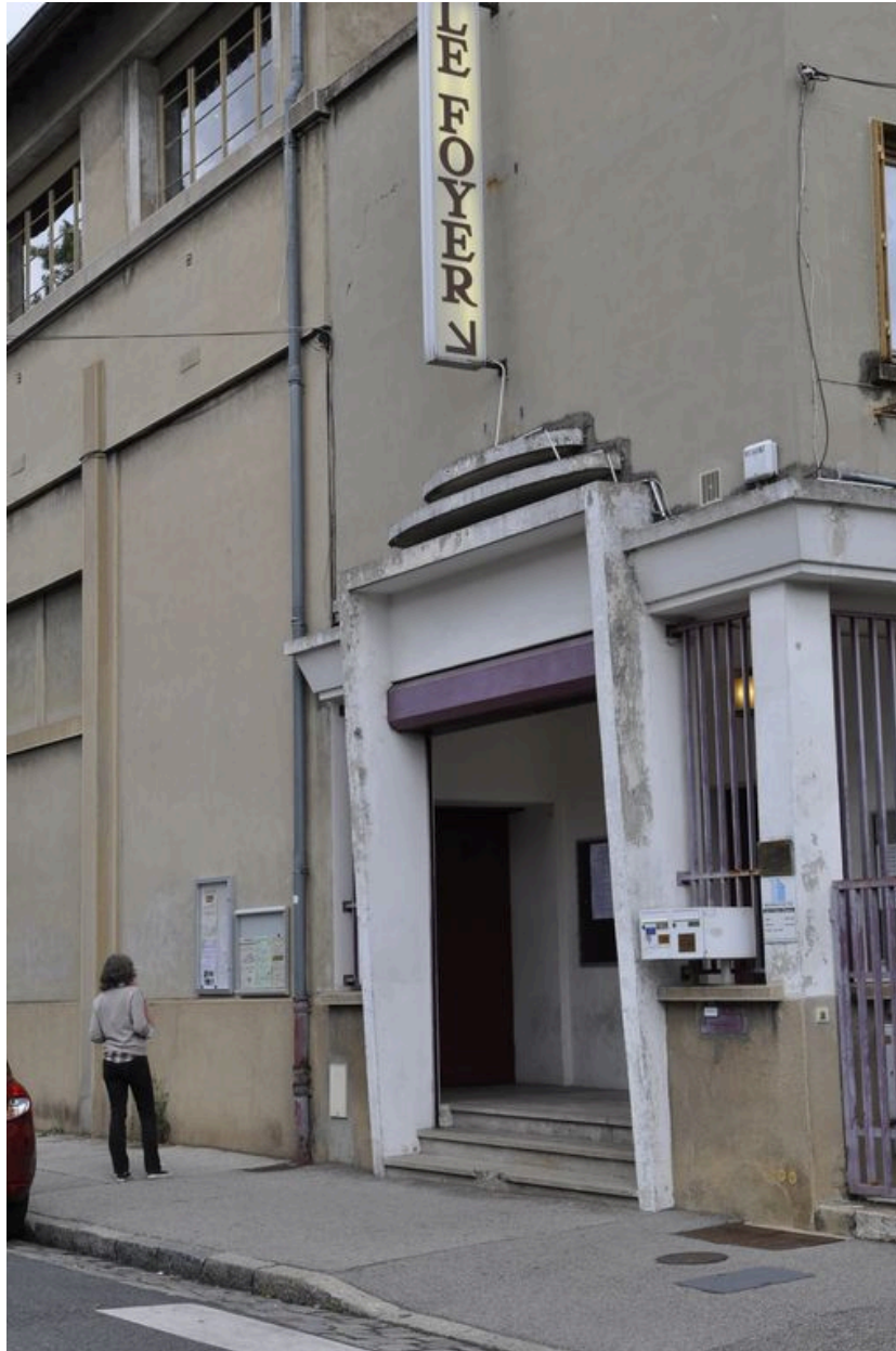
Vue de l'entrée (élévation ouest).