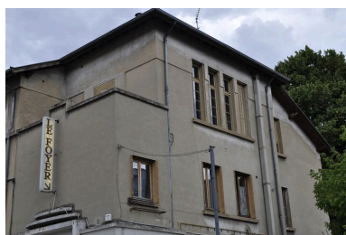
Détail des ouvertures de l'élévation sud. IVR82_20116902186NUCA