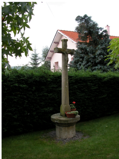
Vue générale. IVR82_20124201161NUCA

Plan de situation, sur fond de plan cadastral, section AP, échelle originale 1:2000. Source : Direction générale des Finances Publiques - Cadastre ; mise à jour : 2009. IVR82_20124201510NUD