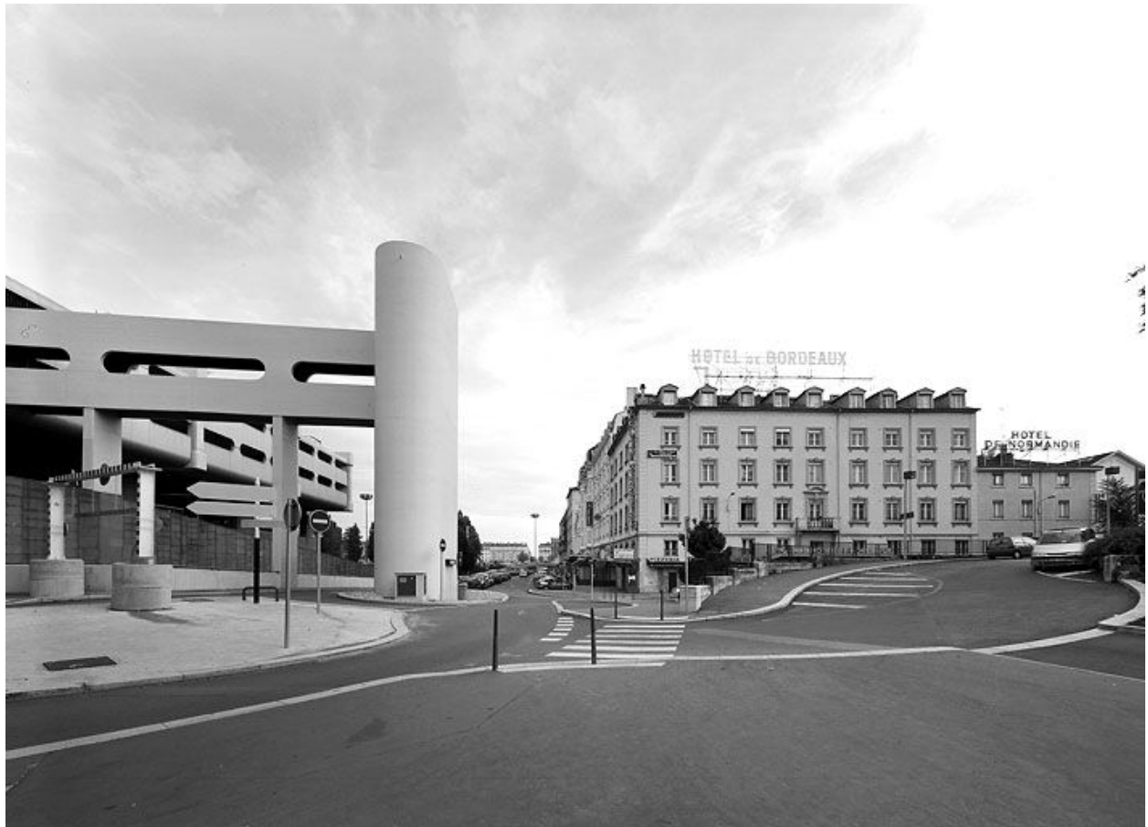
Elévations ouest et nord