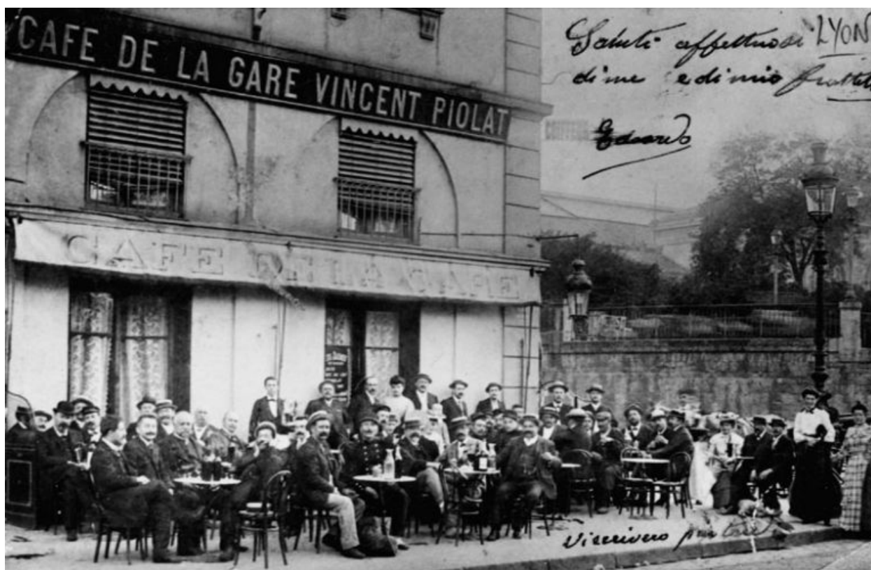
Le Café de la Gare Vincent Piolat, carte postale, [limite XIXe-XXe siècles]