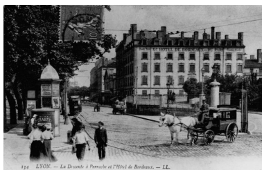
Vue générale, carte postale, [limite XIXe-XXe siècles] IVR82_20036903049NUCB