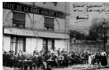
Le Café de la Gare Vincent Piolat, carte postale, [limite XIXe-XXe siècles]