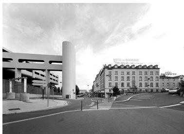
Elévations ouest et nord