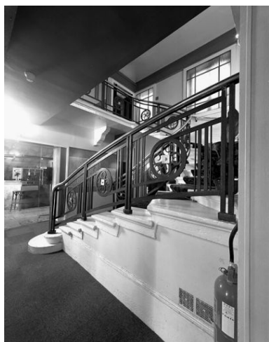
Escalier desservant l'étage de soubassement IVR82_20016902715V