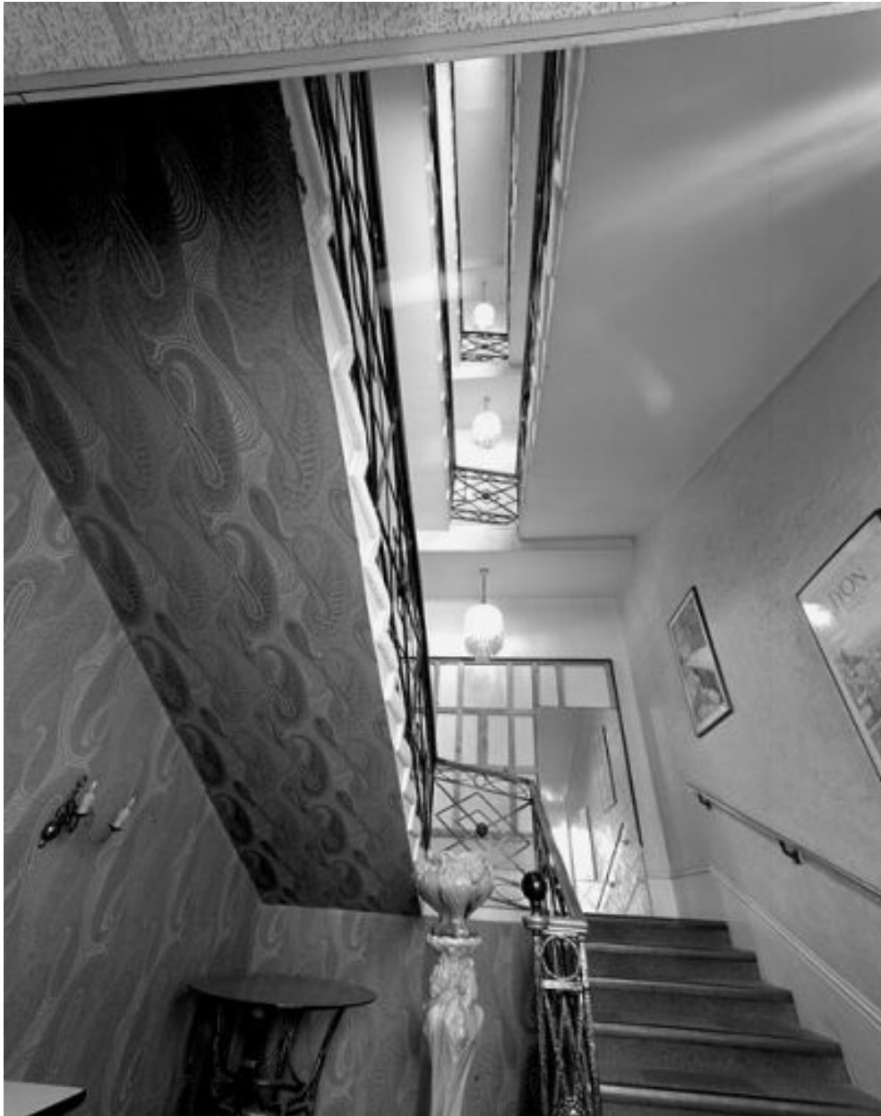
Cage du second escalier desservant les étages carrés et l'étage de comble à partir de l'étage de soubassement