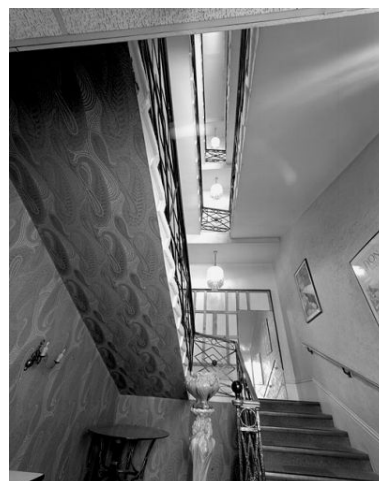
Cage du second escalier desservant les étages carrés et l'étage de comble à partir de l'étage de soubassement IVR82_20016902717V