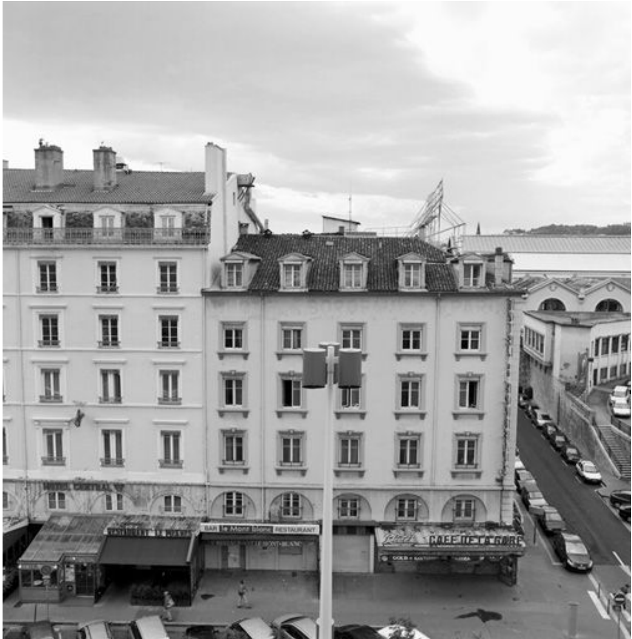
Elévation nord depuis les jardins suspendus (côté Rhône) du Centre d'Echanges