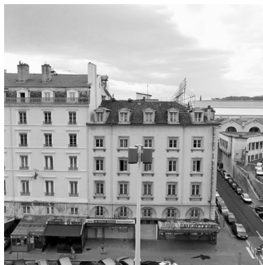
Elévation nord depuis les jardins suspendus (côté Rhône) du Centre d'Echanges IVR82_20026903254X