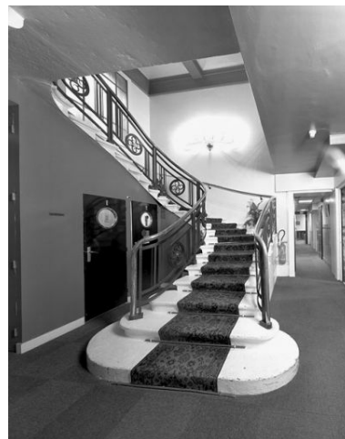
Départ de l'escalier desservant l'étage de soubassement IVR82_20016902714V