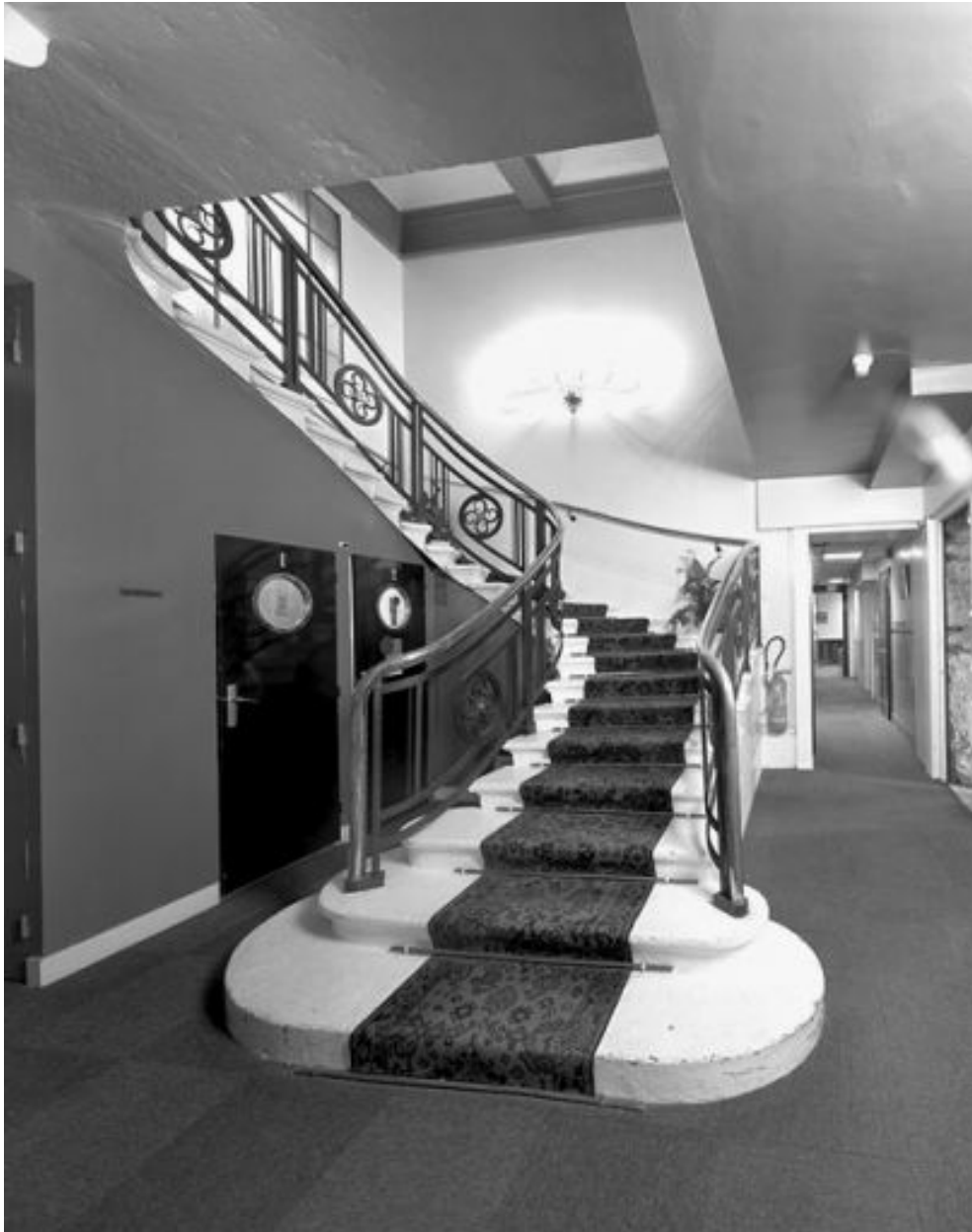
Départ de l'escalier desservant l'étage de soubassement