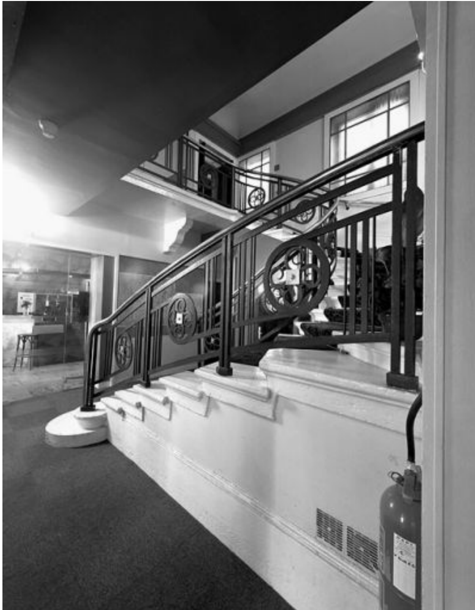
Escalier desservant l'étage de soubassement