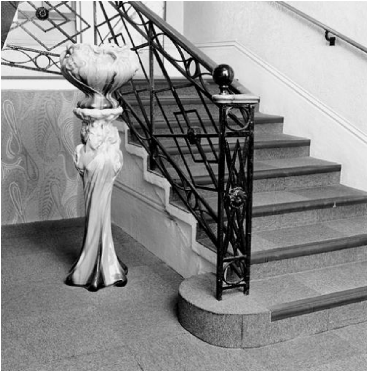
Départ de l'escalier desservant les étages carrés et l'étage de comble à partir de l'étage de soubassement