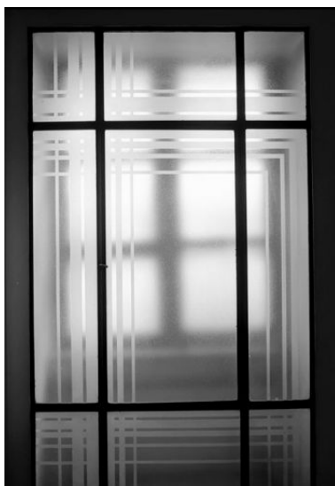
Fenêtre éclairant la cage du premier escalier