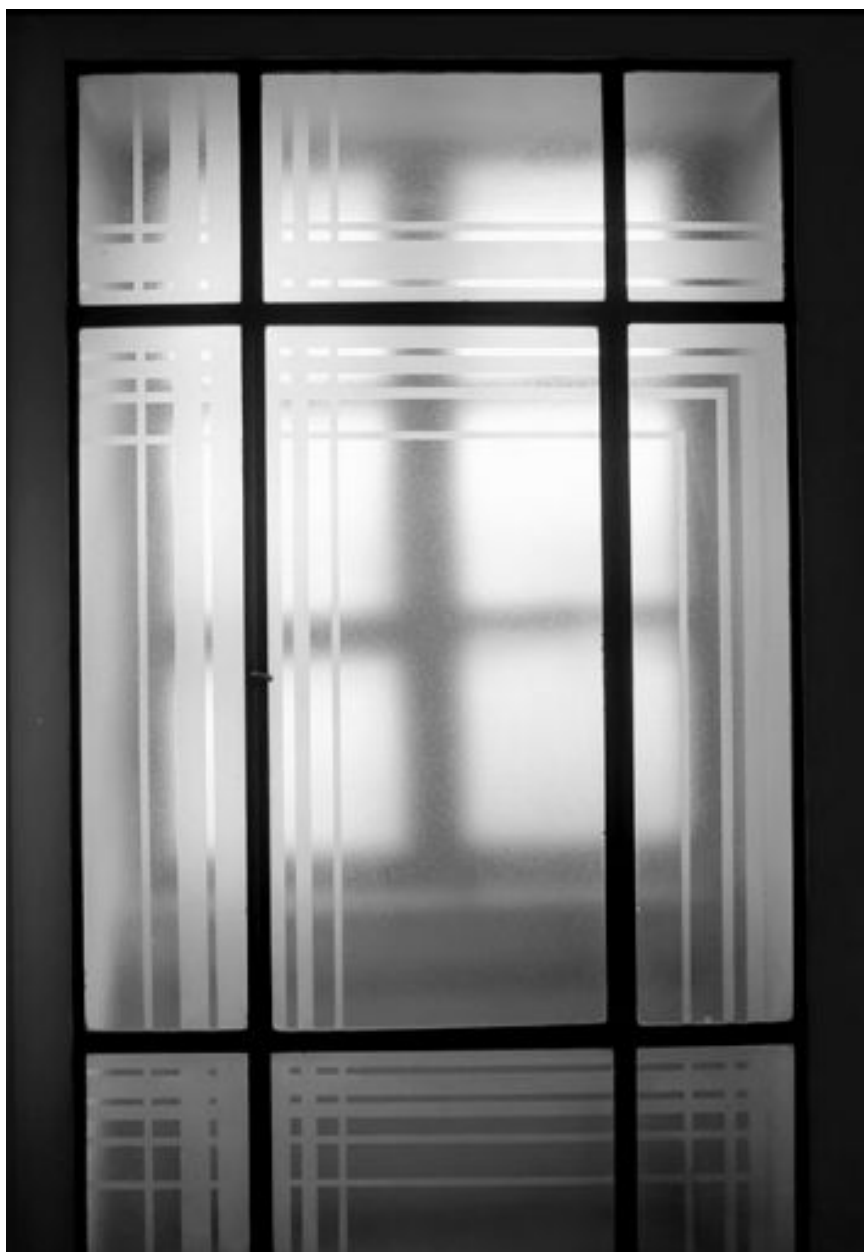
Fenêtre éclairant la cage du premier escalier