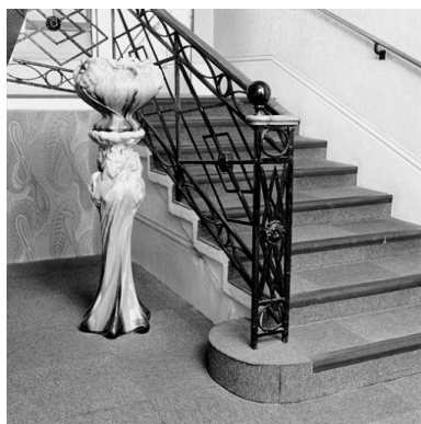
Départ de l'escalier desservant les étages carrés et l'étage de comble à partir de l'étage de soubassement IVR82_20016902718X