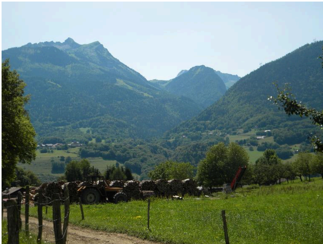
Vue du vallon de Saint-Ruph depuis le plateau au nord de Verchères