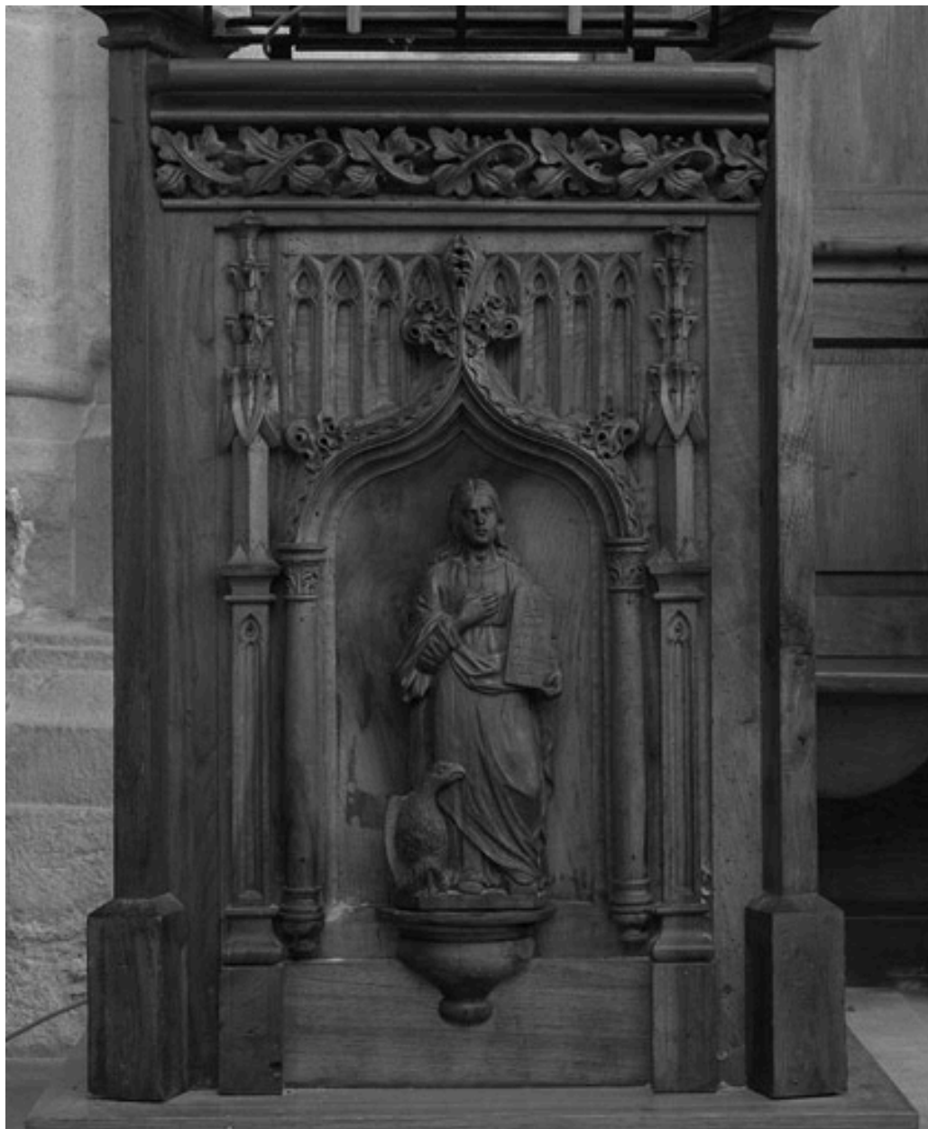
Vue d'ensemble du panneau avec l'Évangéliste saint Jean.