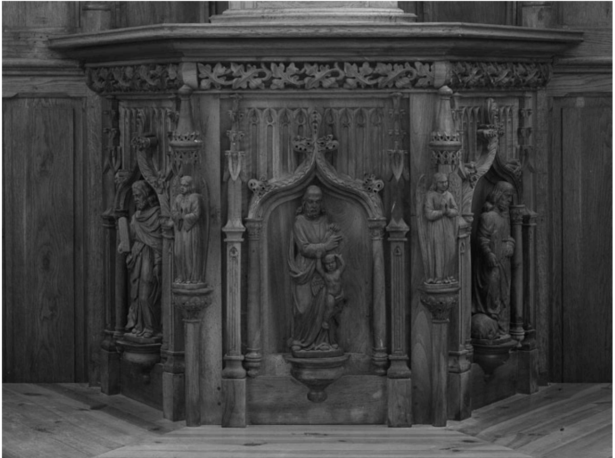
Vue générale de trois faces de la cuve de la chaire.