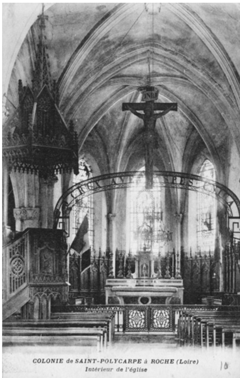
COLONIE de SAINT-POLYCARPE à ROCHE (Loire) / Intérieur de l'église.