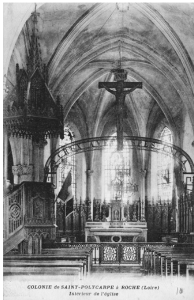
COLONIE de SAINT-POLYCARPE à ROCHE (Loire) / Intérieur de l'église. IVR82_20054201491NUCB