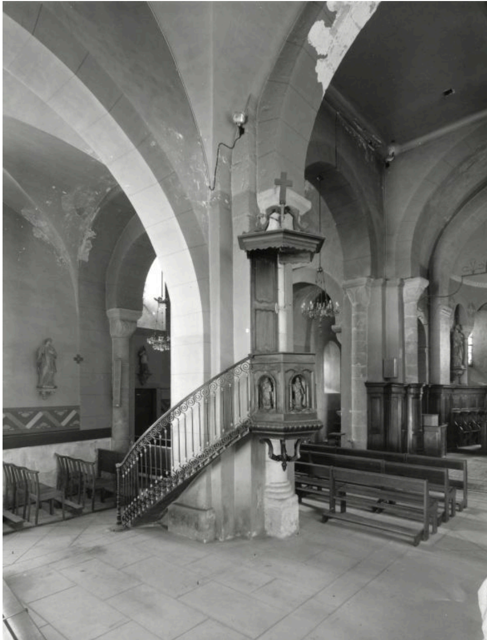
Vue de la chaire à prêcher de Sail-sous-Couzan, comme élément de comparaison avec celle de Roche.