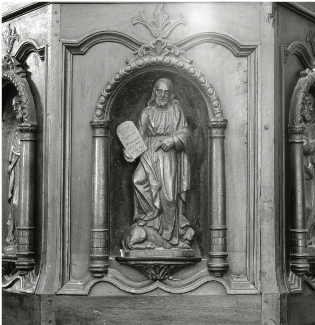
Détail du saint Marc de la chaire à prêcher de Sail-sous-Couzan pour comparatif avec celui de Roche.