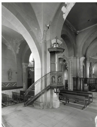
Vue de la chaire à prêcher de Sail-sous-Couzan, comme élément de comparaison avec celle de Roche. IVR82_20034200520V