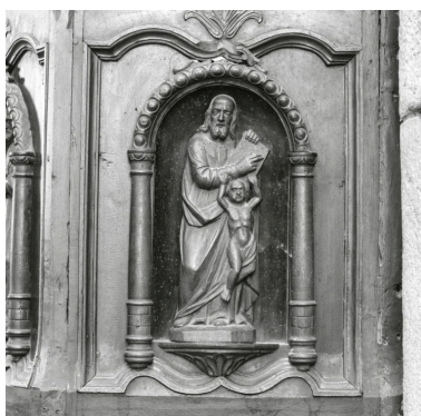
Détail du saint Matthieu de la chaire à prêcher de Sail-sous-Couzan pour comparaison avec celui de la chaire de Roche.