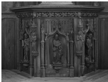
Vue générale de trois faces de la cuve de la chaire.