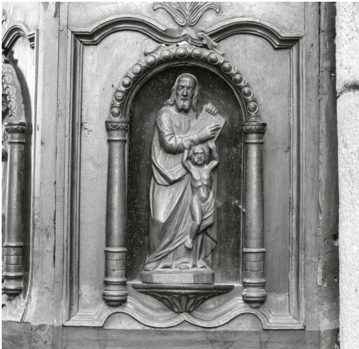
Détail du saint Matthieu de la chaire à prêcher de Sail-sous-Couzan pour comparaison avec celui de la chaire de Roche.