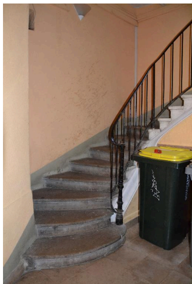
Départ escalier