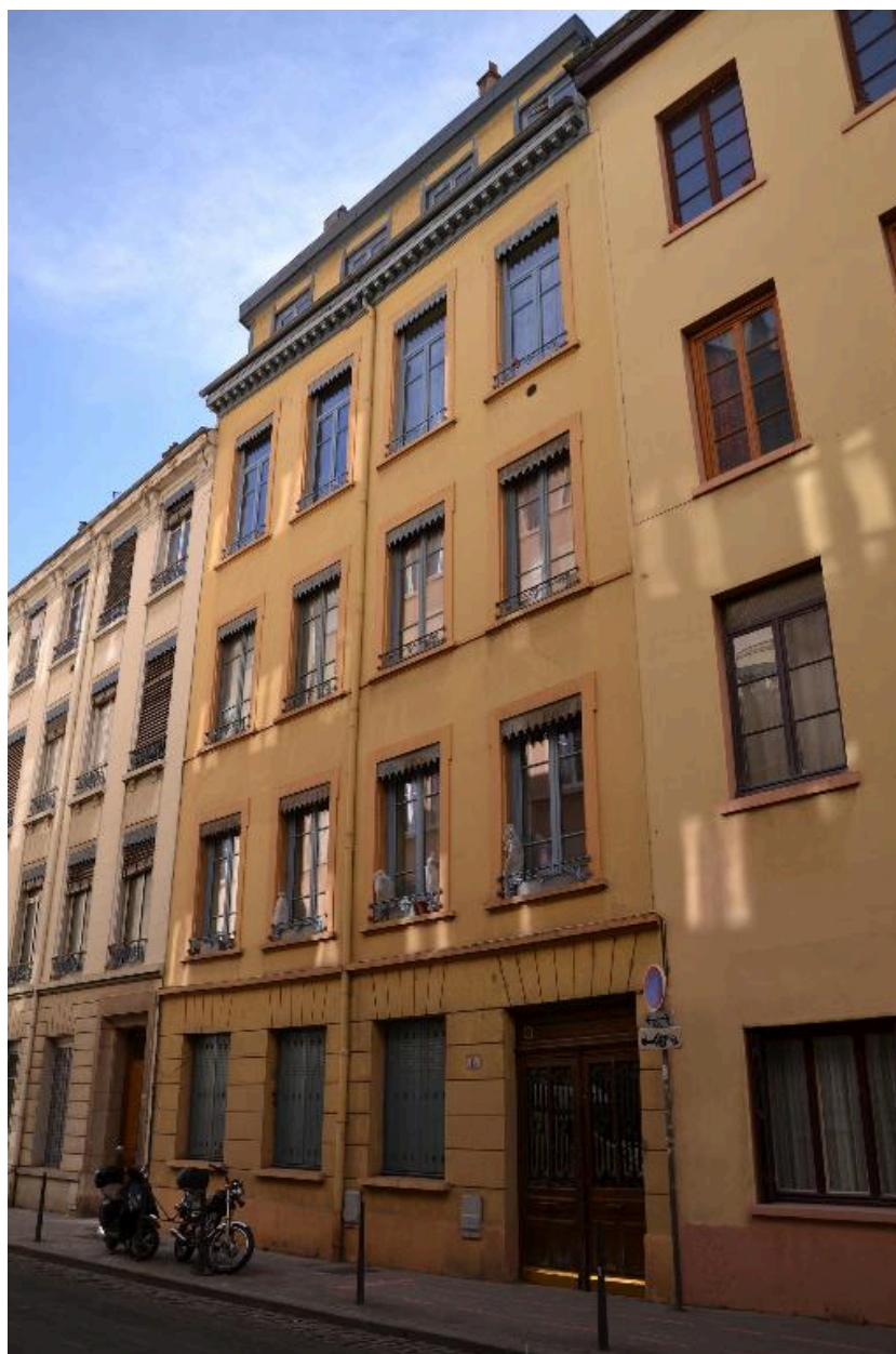
Vue d'ensemble façade nord