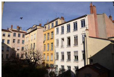
Façade sud IVR82_20156900236NUCA