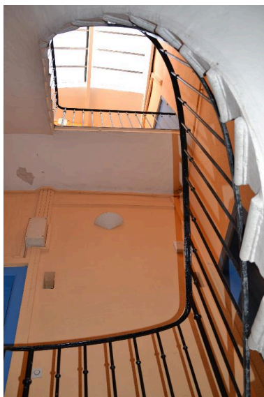
Escalier IVR82_20156900251NUCA