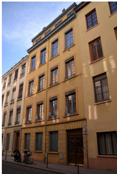
Vue d'ensemble façade nord IVR82_20156900248NUCA