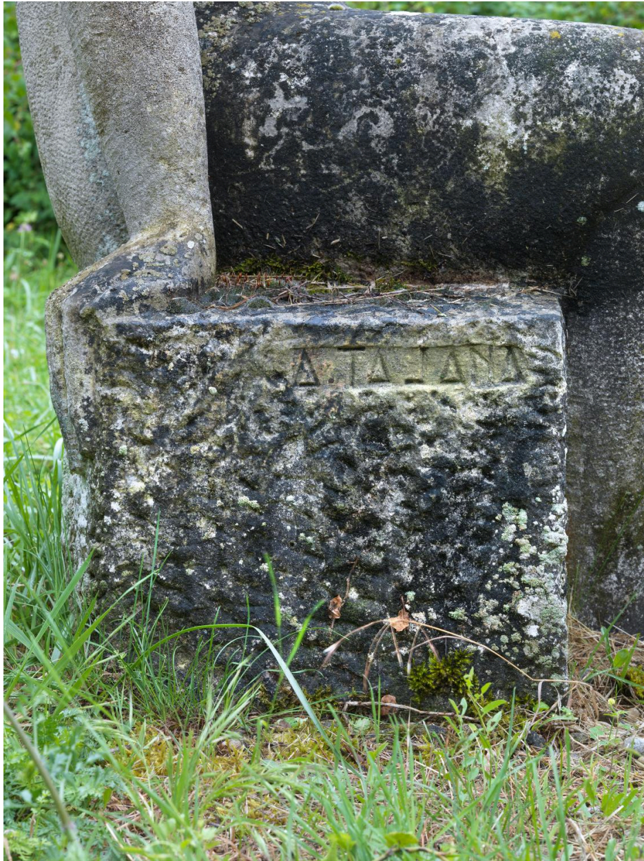
Détail de la signature