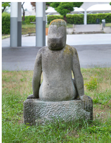
Vue de dos IVR84_20216900628NUCAQ