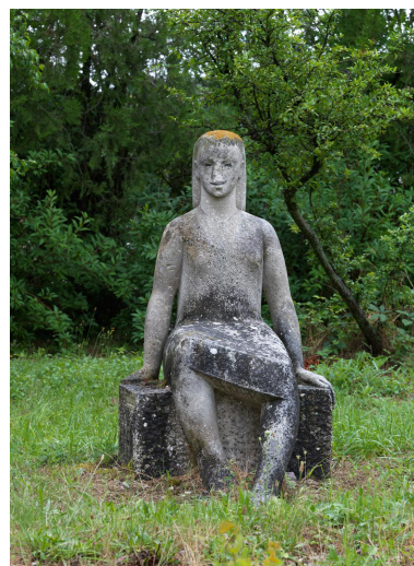
Vue de face IVR84_20216900625NUCAQ