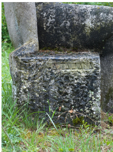
Détail de la signature IVR84_20216900629NUCA