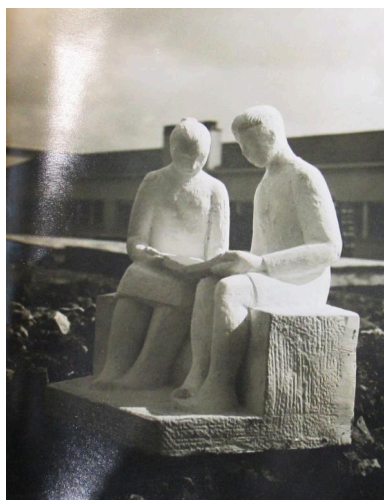
Maquette de l'œuvre (projet refusé) (AN 19910237/25). IVR84_20206900384NUCB