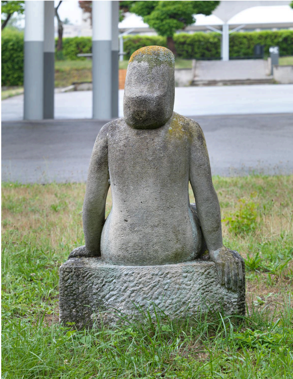
Vue de dos