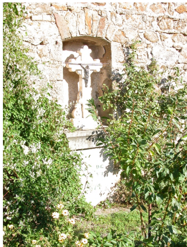
Vue générale. IVR82_20124202173NUCA