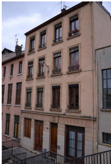
Vue d'ensemble IVR82_20156900088NUCA