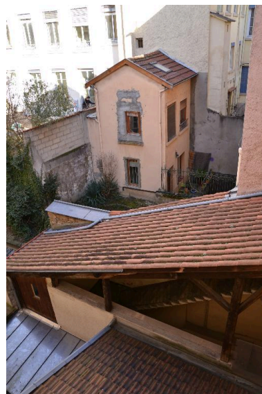
Jardin IVR82_20156900237NUCA