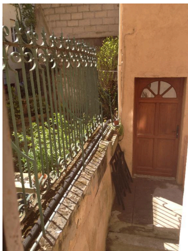
Cour IVR82_20156900602NUCA