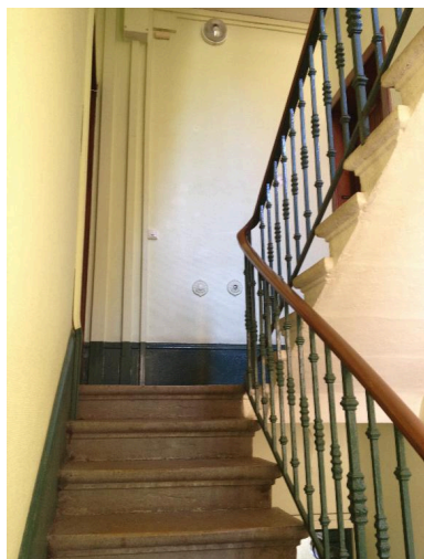
Palier IVR82_20156900603NUCA