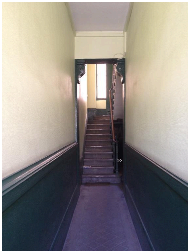
Entrée IVR82_20156900600NUCA