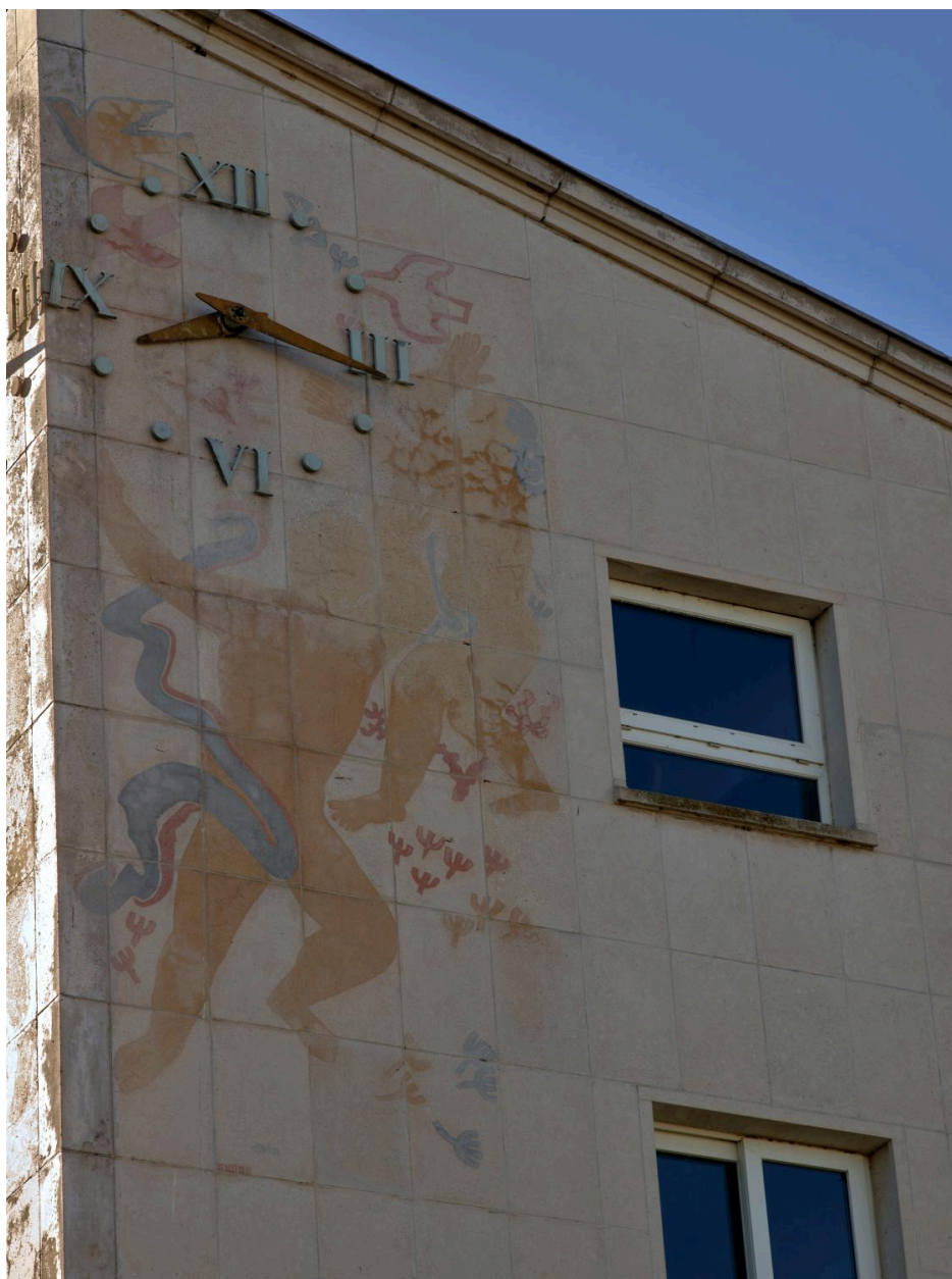
Peintures accompagnant les deux horloges : détail du décor de l'élévation nord-est (2025)