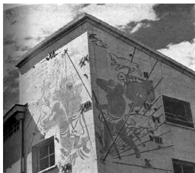
Peintures accompagnant le cadran solaire sur l'un des bâtiments de l'internat (repr. in la Construction moderne, 1959 n°3, p. 31)