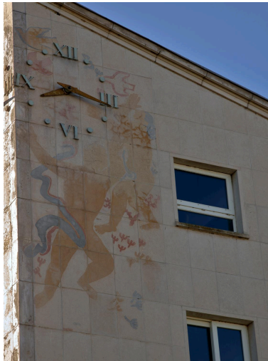
Peintures accompagnant les deux horloges : détail du décor de l'élévation nord-est (2025) IVR84_20250300335NUC4A

Peintures accompagnant le cadran solaire, état actuel (2025) IVR84_20250300332NUC4A