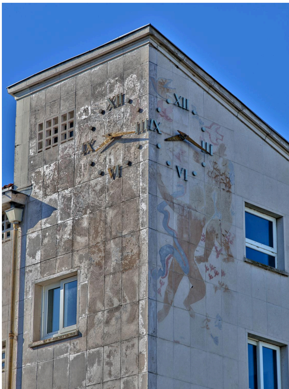
Peintures accompagnant les deux horloges, état actuel (2025)