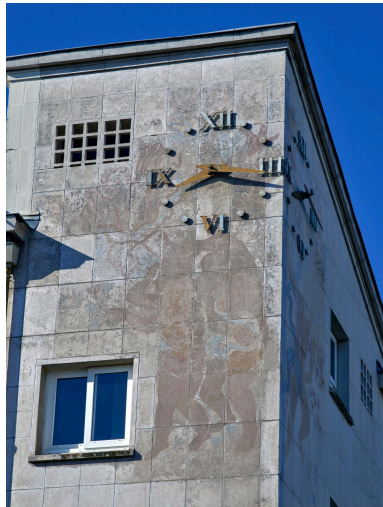
Peintures accompagnant les deux horloges : détail du décor de l'élévation sud-est (2025) IVR84_20250300334NUC4A

Autr. auteur inconnu IVR84_20250300220NUC