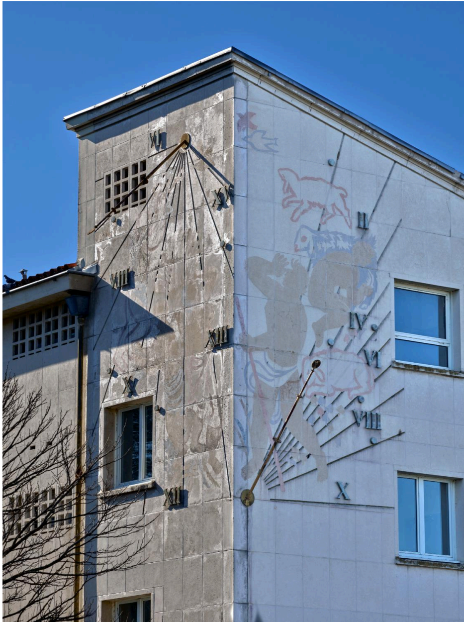
Peintures accompagnant le cadran solaire, état actuel (2025)