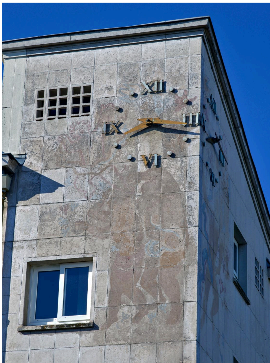
Peintures accompagnant les deux horloges : détail du décor de l'élévation sud-est (2025)