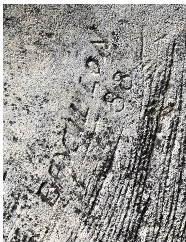
Détail de la signature