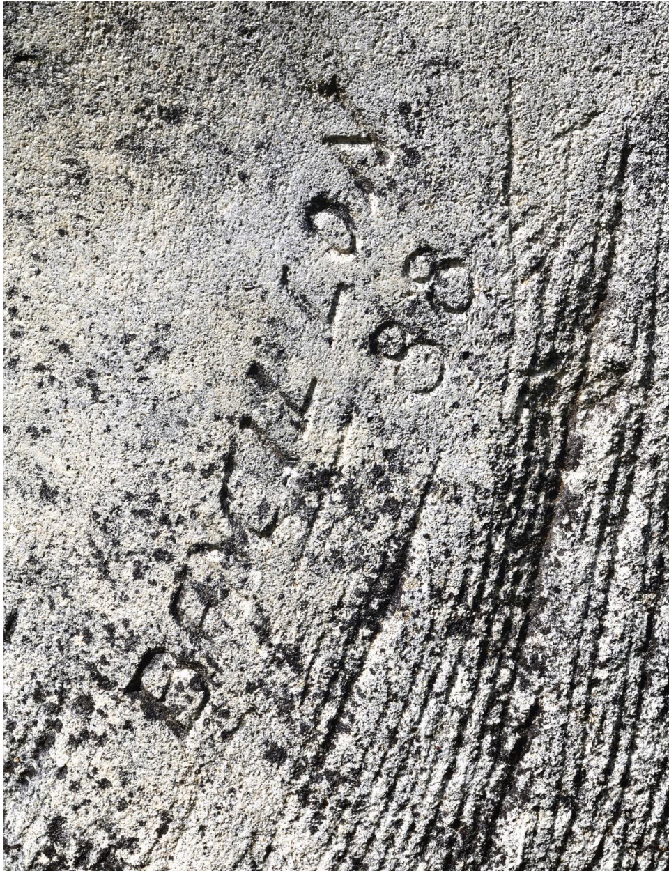
Détail de la signature