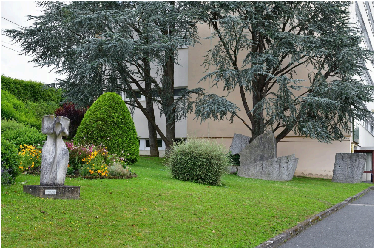
L'oeuvre dans son environnement