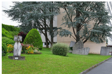
L'oeuvre dans son environnement IVR84_20216900684NUCA