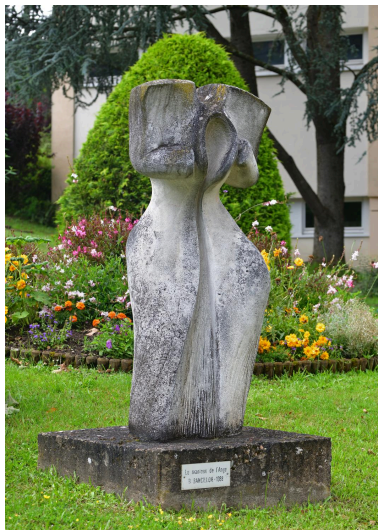
Vue de face IVR84_20216900686NUCA