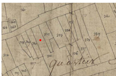
Extrait du plan cadastral de 1809, parcelle E 331 (partie est). IVR82_20124202578NUD