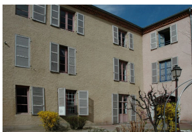
Elévation latérale sur cour.