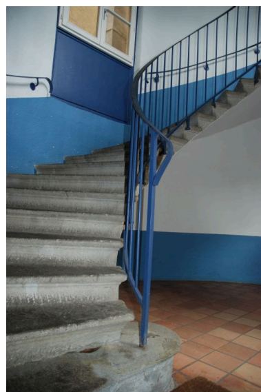
Départ de l'escalier.