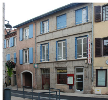
Vue depuis la rue Pasteur.