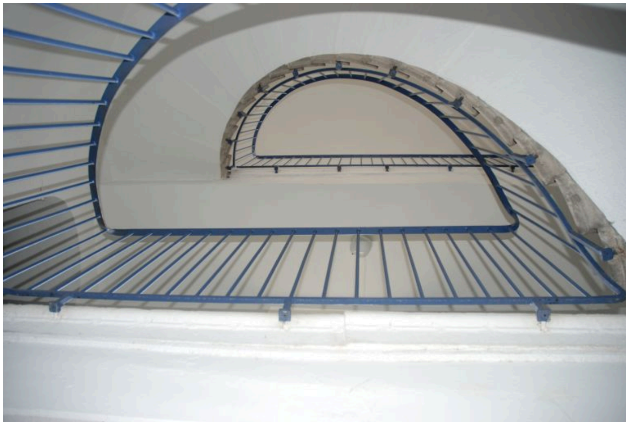
Escalier tournant à retours avec jour, suspendu. Vue depuis le bas vers le haut.