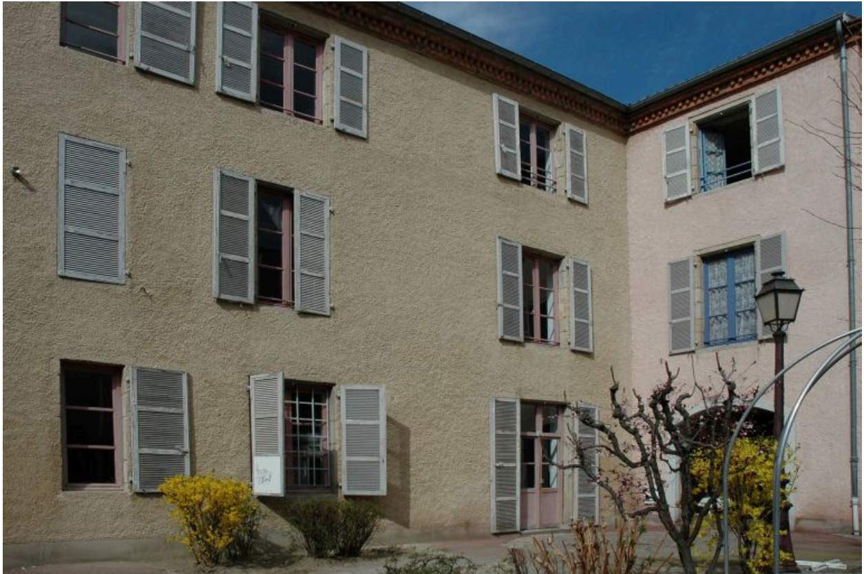
Elévation latérale sur cour.