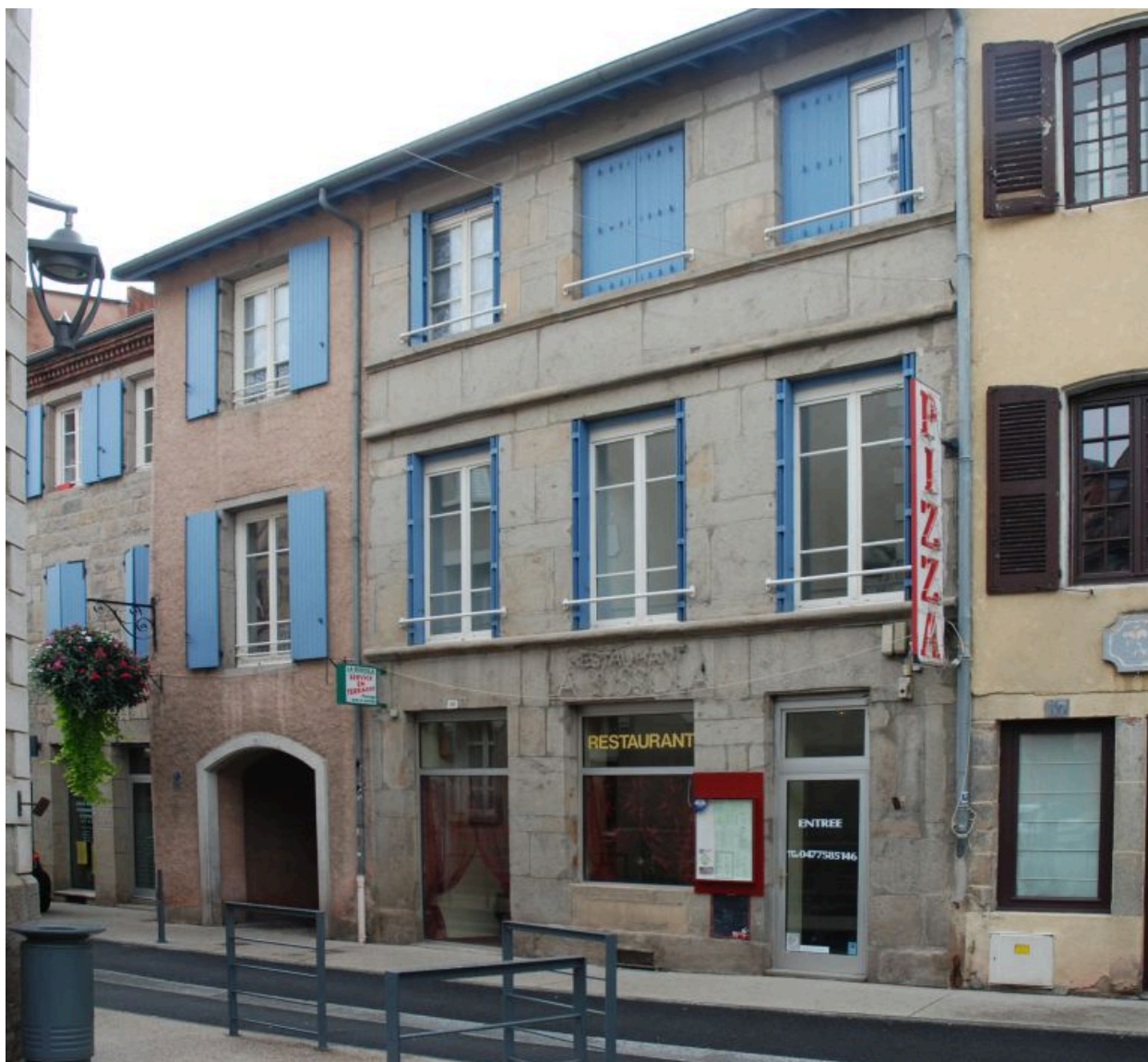
Vue depuis la rue Pasteur.