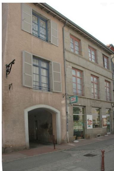
Vue partielle.