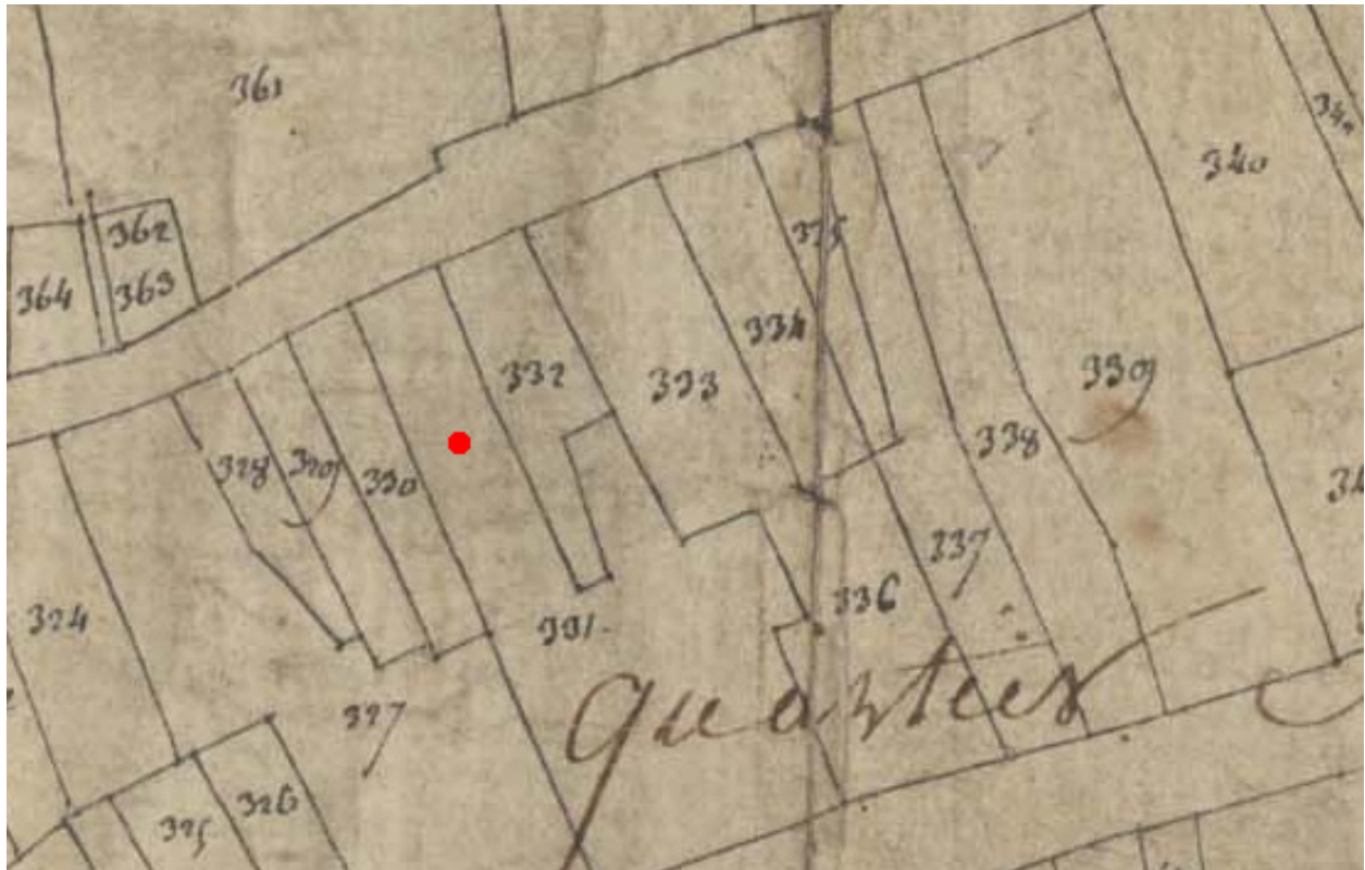
Extrait du plan cadastral de 1809, parcelle E 331 (partie est).