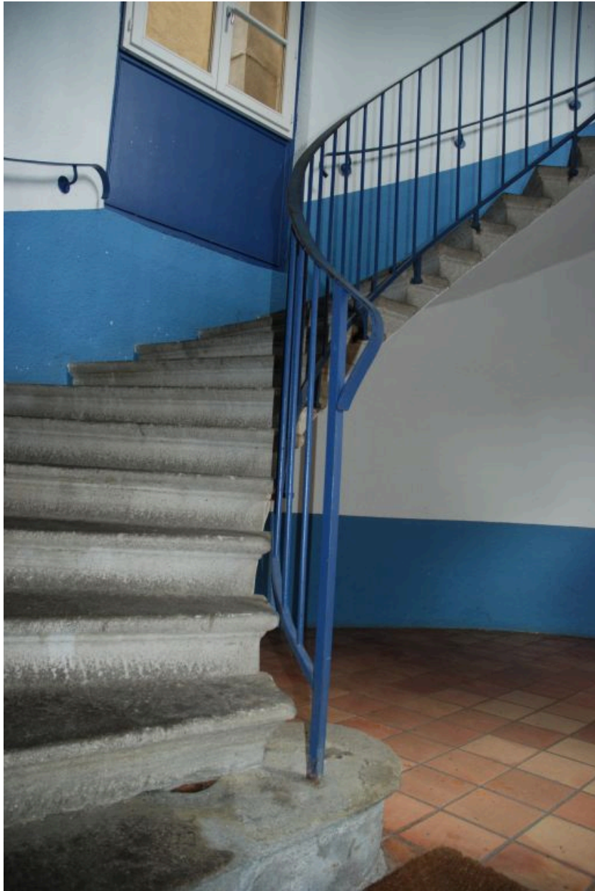
Départ de l'escalier.