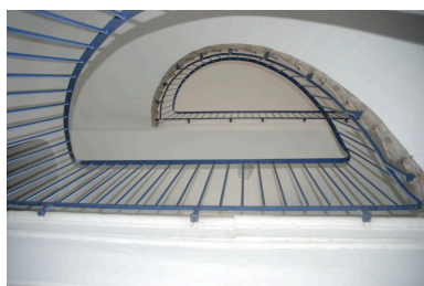
Escalier tournant à retours avec jour, suspendu. Vue depuis le bas vers le haut.