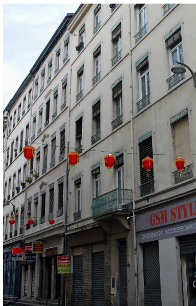
Immeuble sur rue, vue générale IVR82_20156900977NUCA