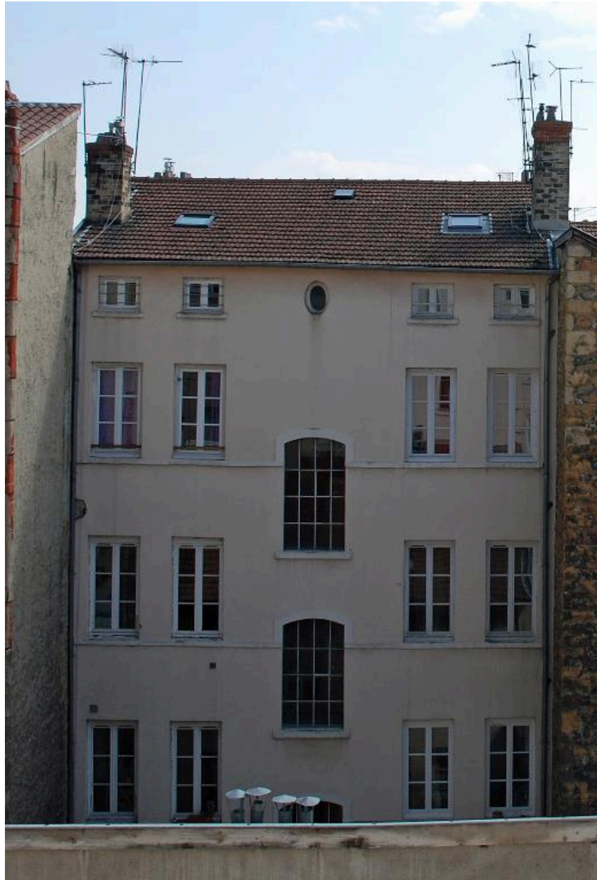
Immeuble sur rue, élévation postérieure