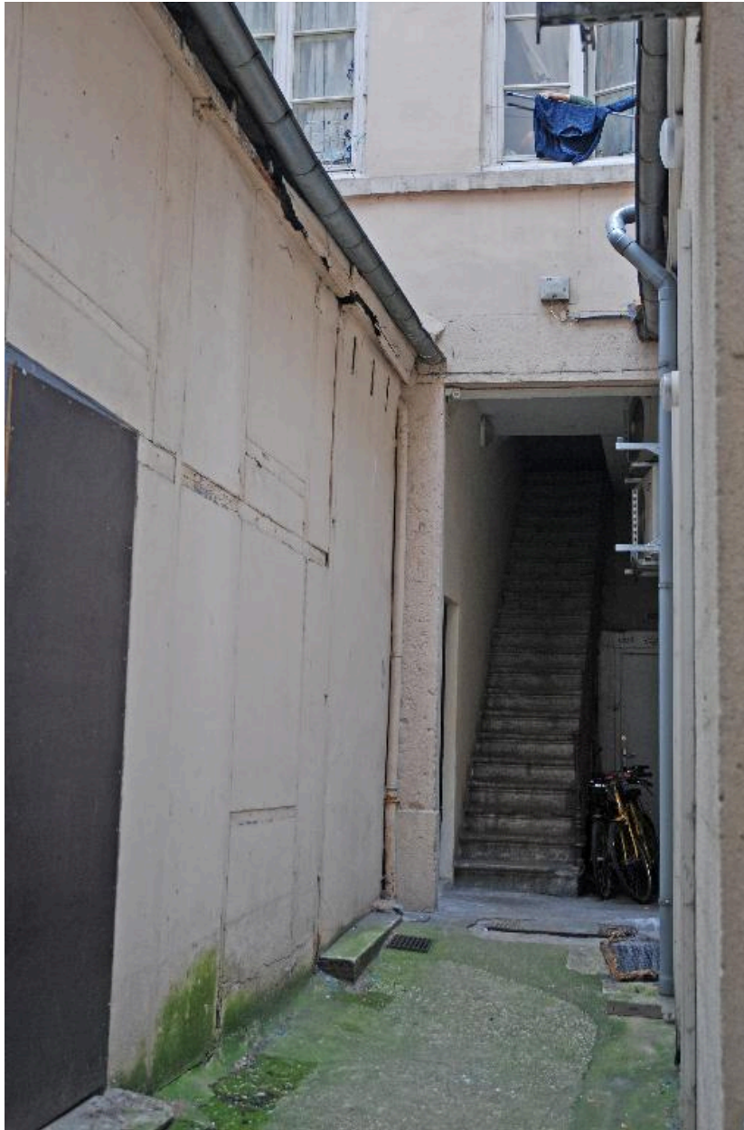
Vue partielle de la cour et départ de l'escalier de l'immeuble sur cour