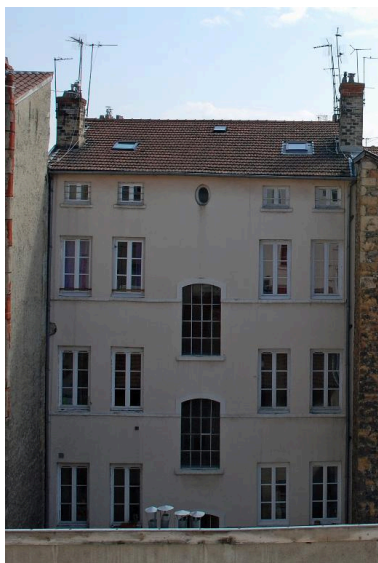
Immeuble sur rue, élévation postérieure IVR82_20156900982NUCA