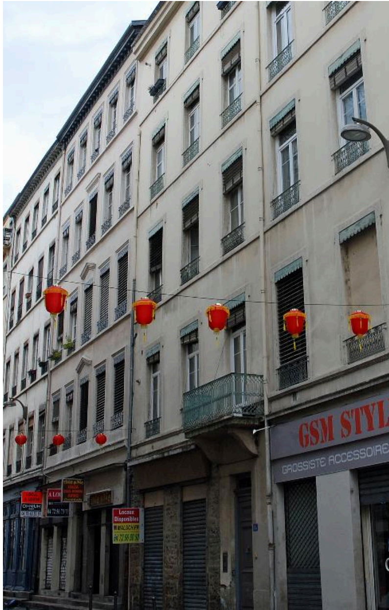
Immeuble sur rue, vue générale