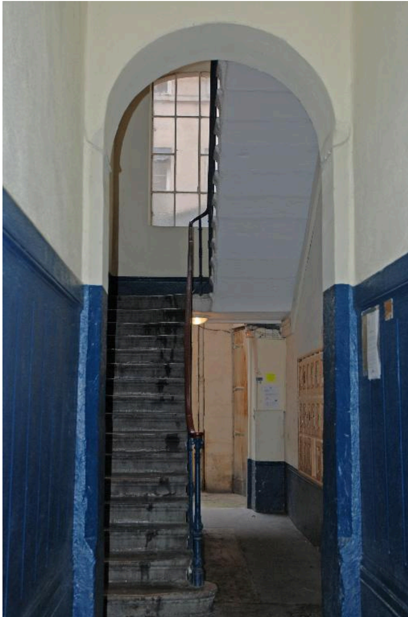
Immeuble sur rue : allée et départ de l'escalier