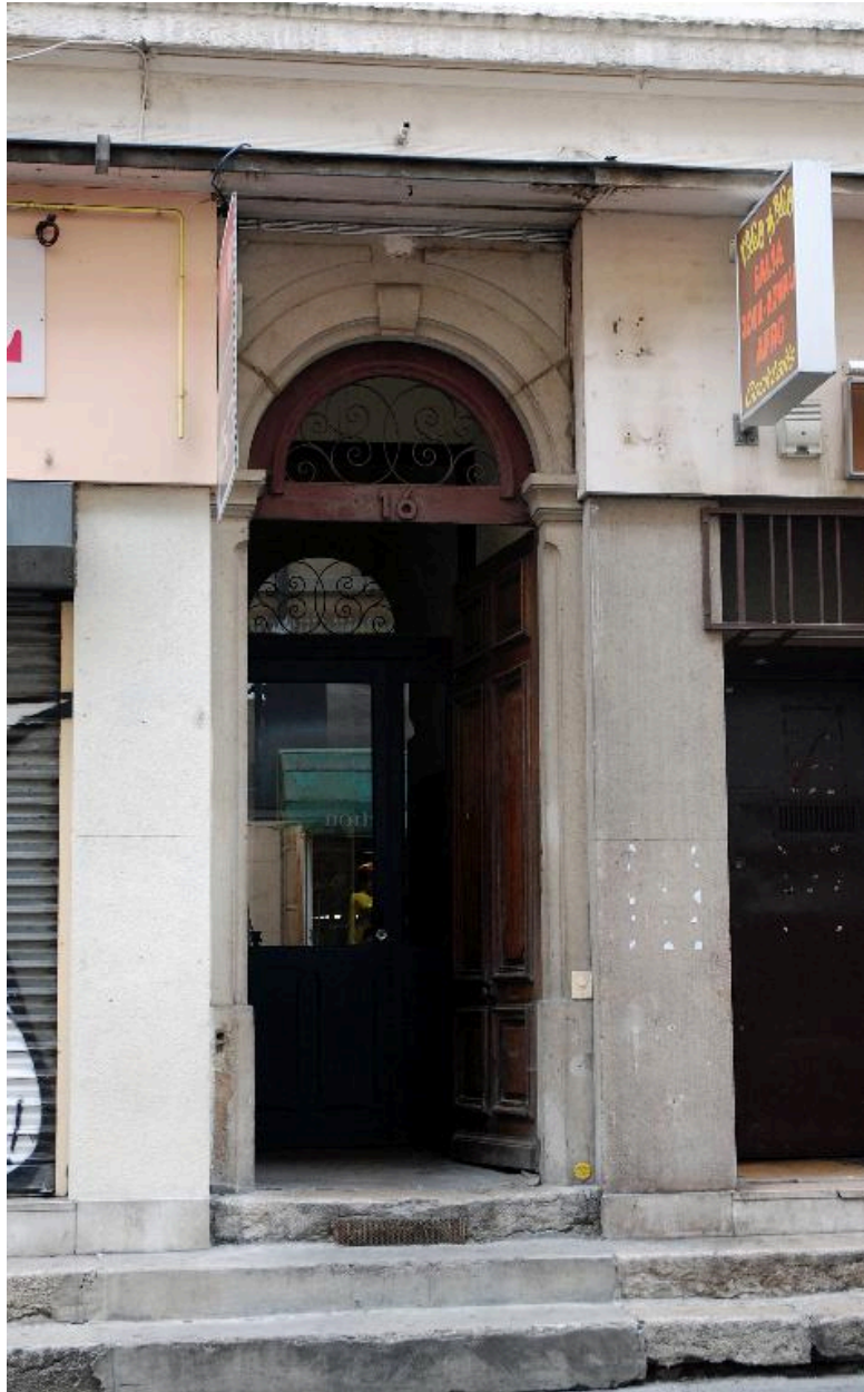
Immeuble sur rue : porte piétonne