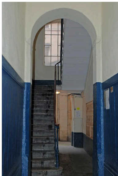
Immeuble sur rue : allée et départ de l'escalier IVR82_20156900979NUCA