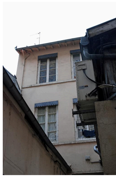
Vue partielle des bâtiments sur cour