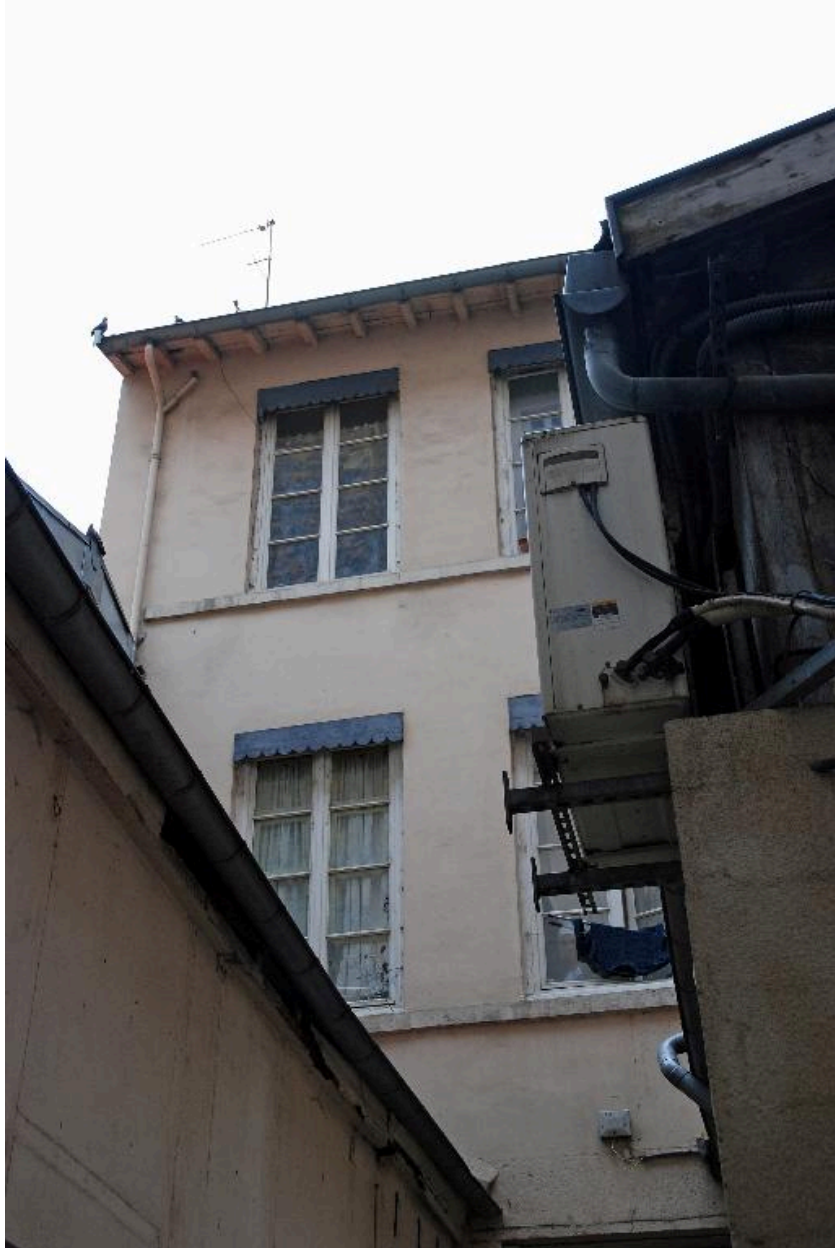
Vue partielle des bâtiments sur cour