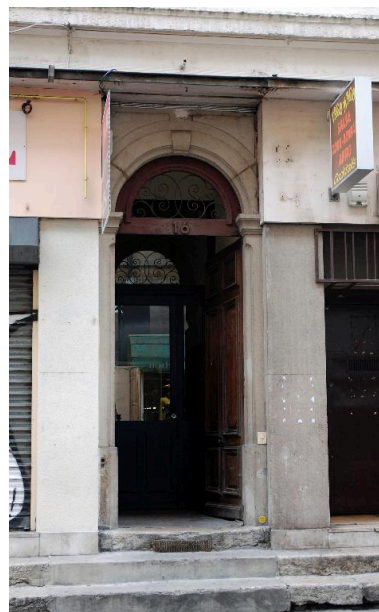
Immeuble sur rue : porte piétonne IVR82_20156900978NUCA