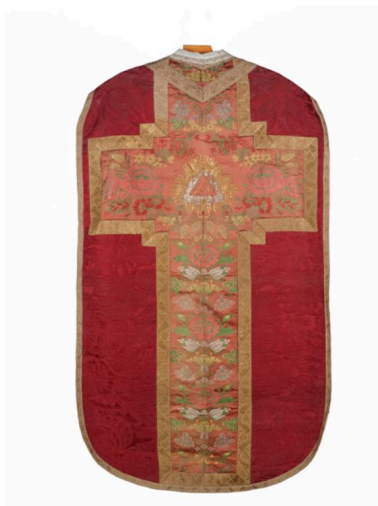
Vue générale du dos de la chasuble IVR83_20156300375NUC4A