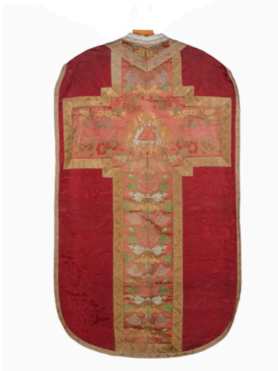
Vue générale du dos de la chasuble