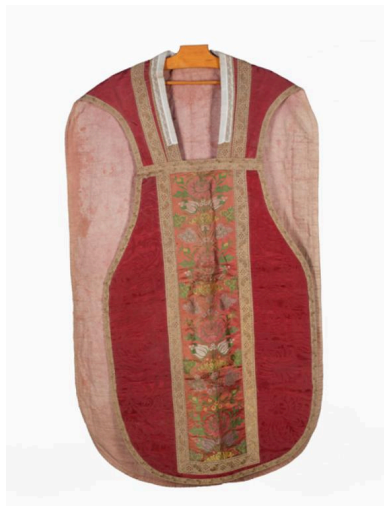
Vue du devant de la chasuble