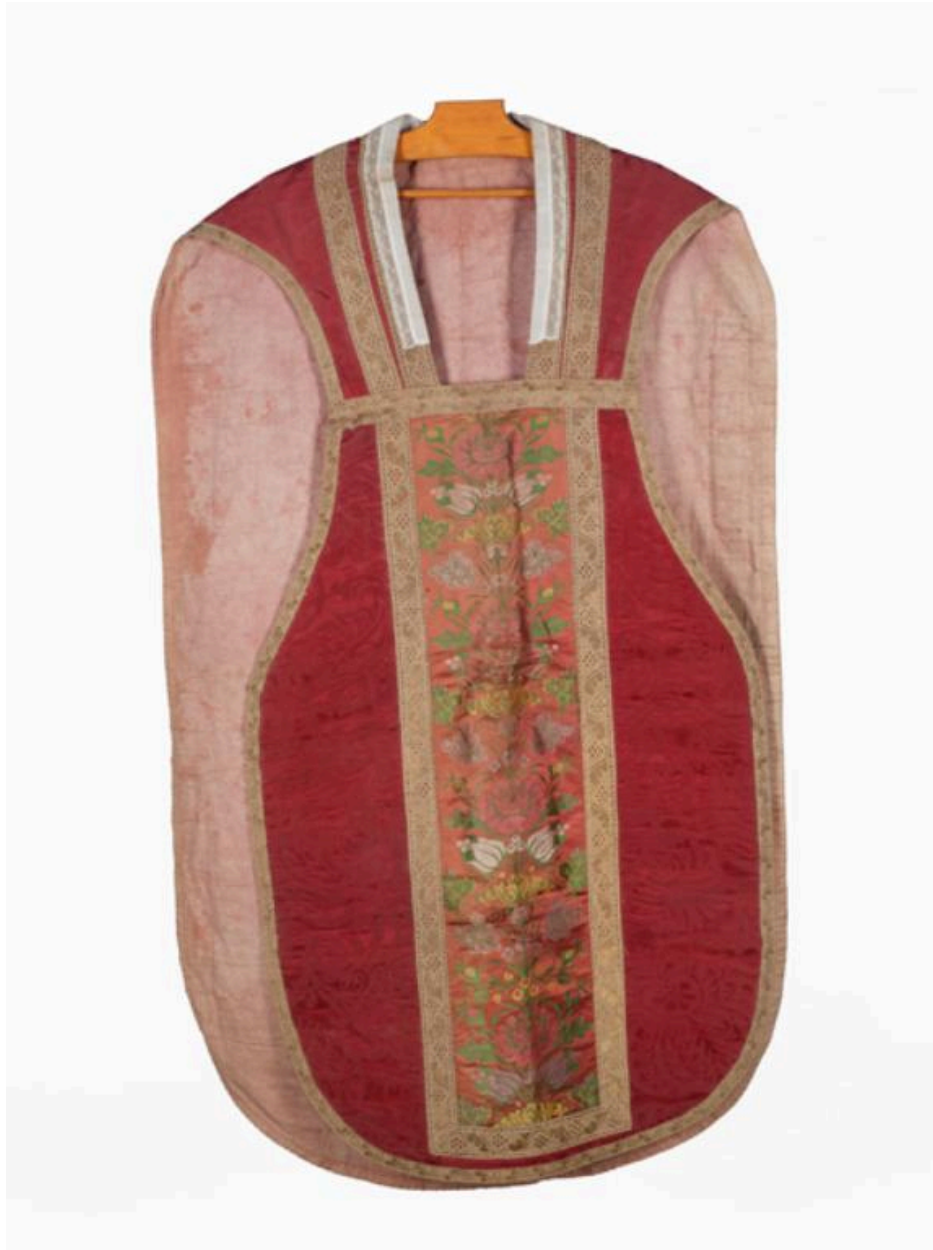
Vue du devant de la chasuble