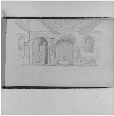
Dessin du mur nord de la grotte : absides abritant encore les statues (Bacchus et la naïade).

Autr. Louis-Pierre Gras IVR82_20054200461X