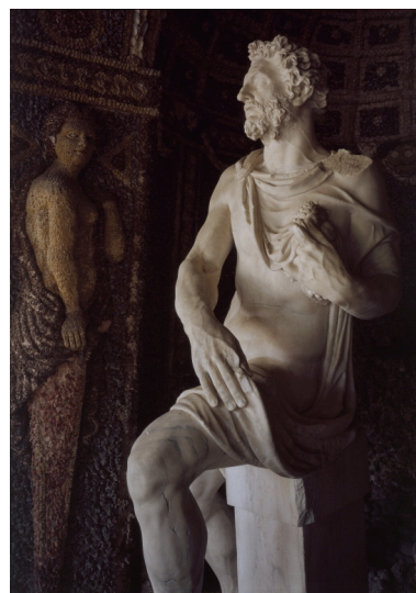
Vue de trois-quarts droit. IVR82_20004200962PA