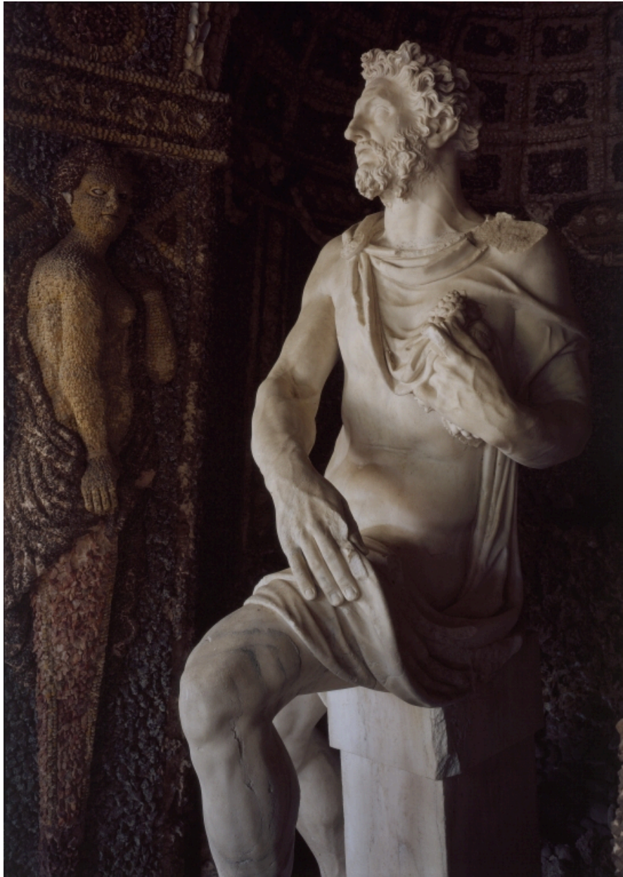
Vue de trois-quarts droit.