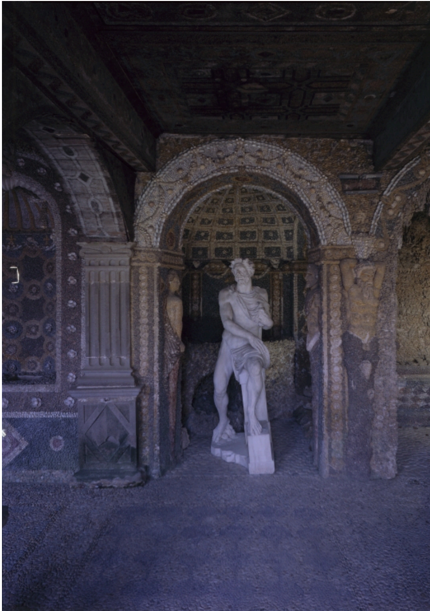
Vue d'ensemble, du nord.