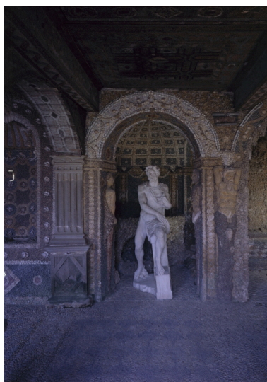
Vue d'ensemble, du nord. IVR82_20054200416PA