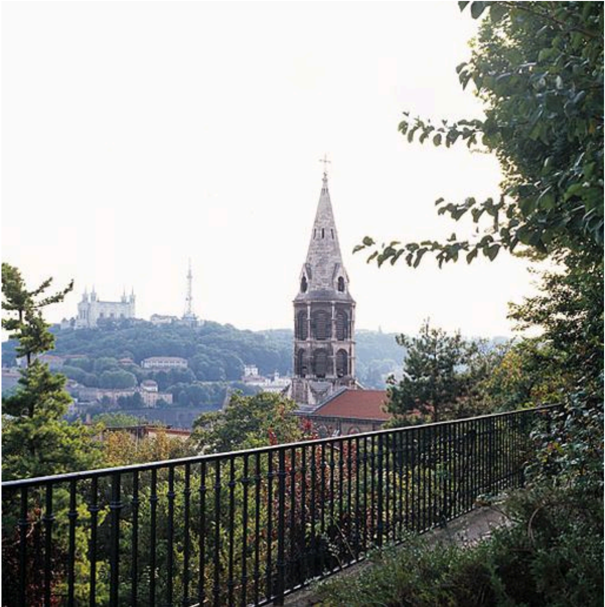
Jardin, vue sur la ville de l'une des terrasses supérieures