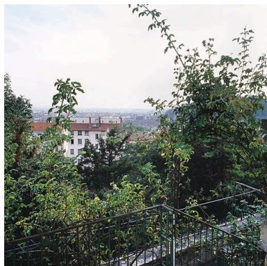
Jardin IVR82_20016900014XA