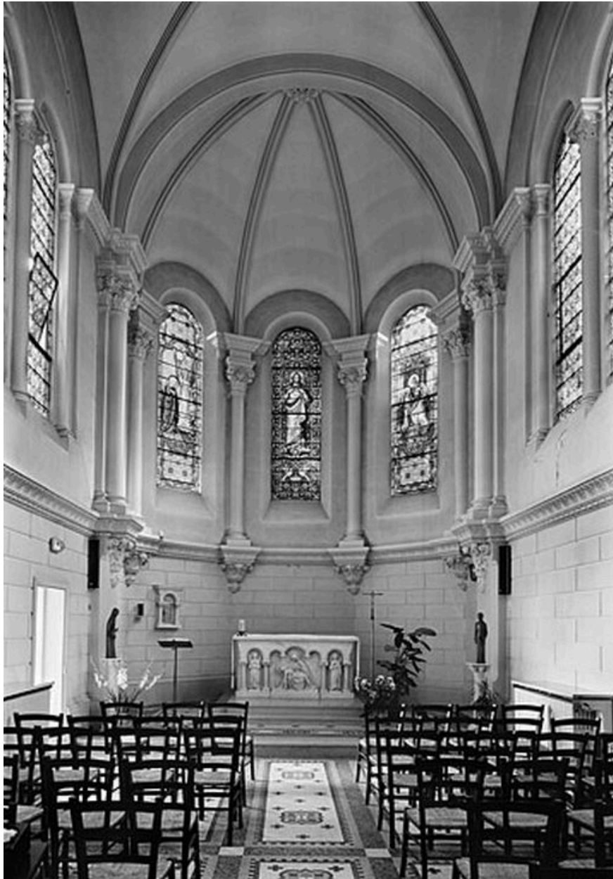
Chapelle, vue générale vers le chœur