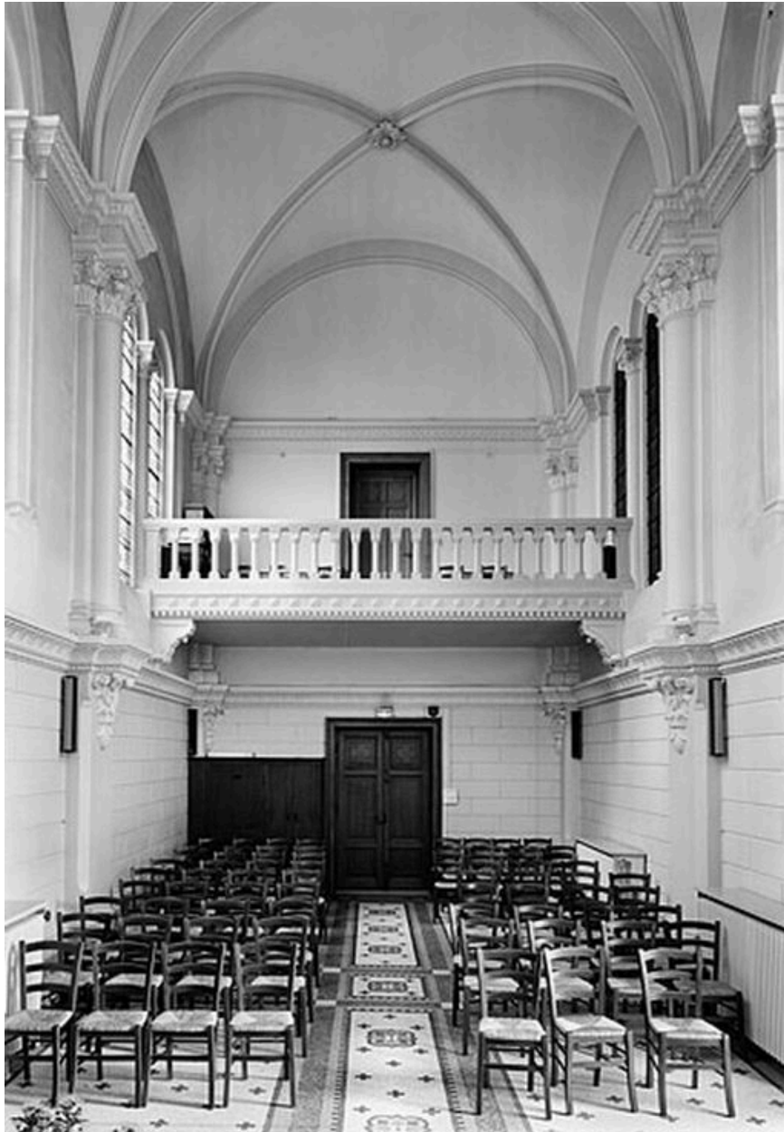
Chapelle, vue générale vers vers l'entrée