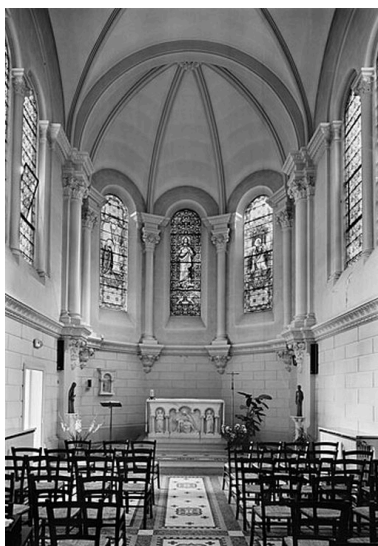
Chapelle, vue générale vers le chœur IVR82_20016900011P