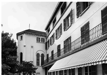
Façade sur cour