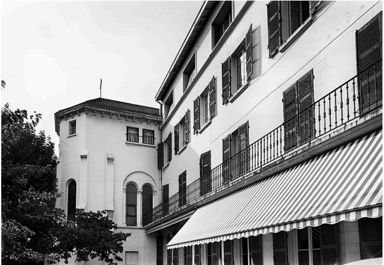
Façade sur cour