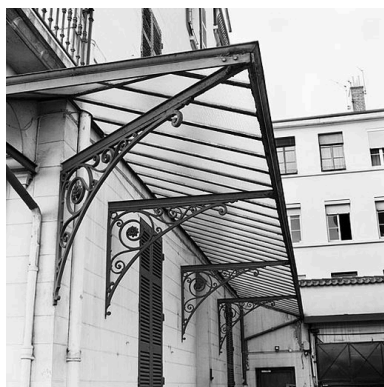
Façade latérale côté portail d'entrée, marquise IVR82_20016900010X