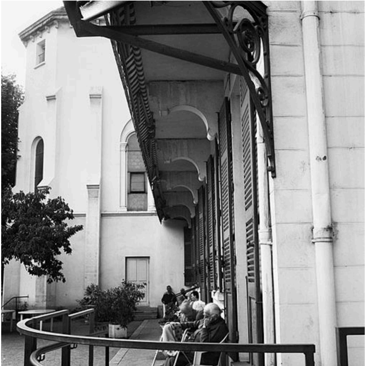
Façade sur cour, consoles soutenant le balcon du 1er étage