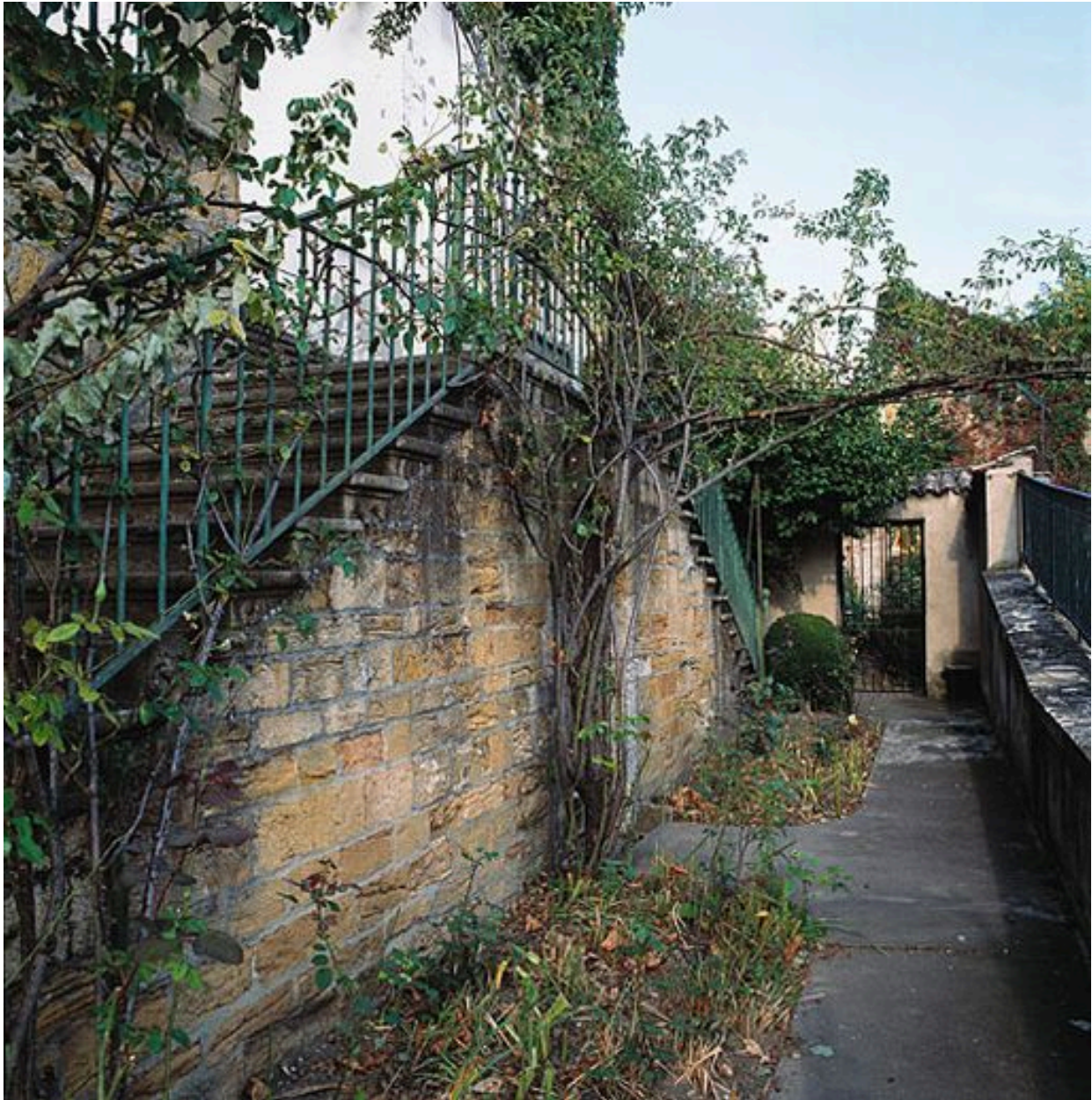
Jardin, escalier faisant communiquer les deux terrasses supérieures