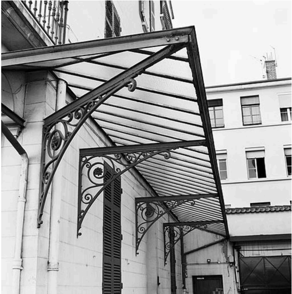
Façade latérale côté portail d'entrée, marquise