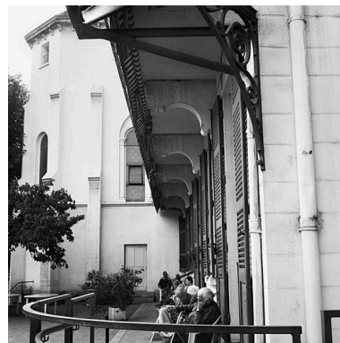
Façade sur cour, consoles soutenant le balcon du 1er étage IVR82_20016900009X