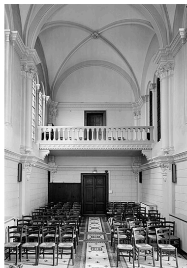
Chapelle, vue générale vers l'entrée