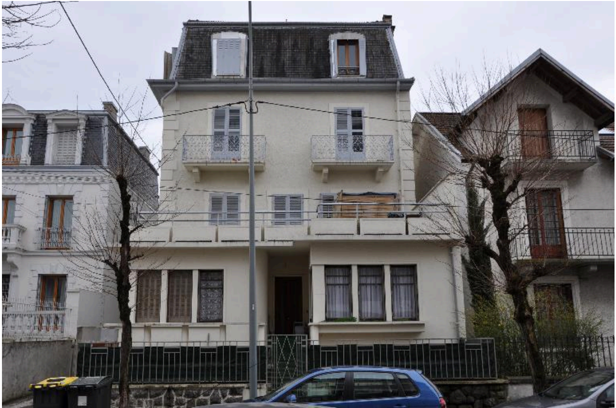
Elévation sur rue