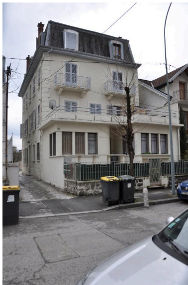
Vue de trois-quart IVR82_20137300007NUCA