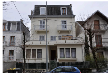
Elévation sur rue IVR82_20137300008NUCA