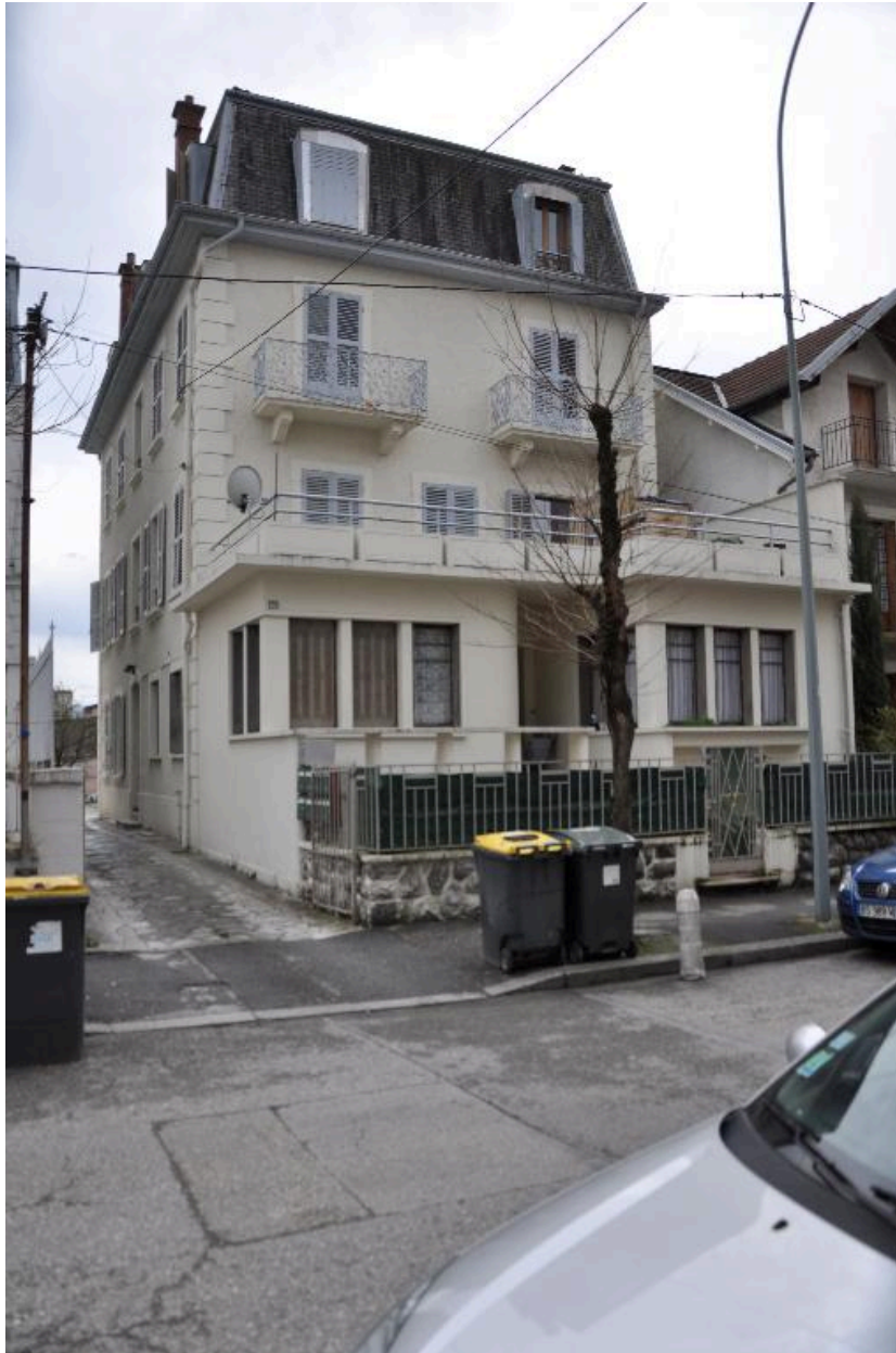
Vue de trois-quart