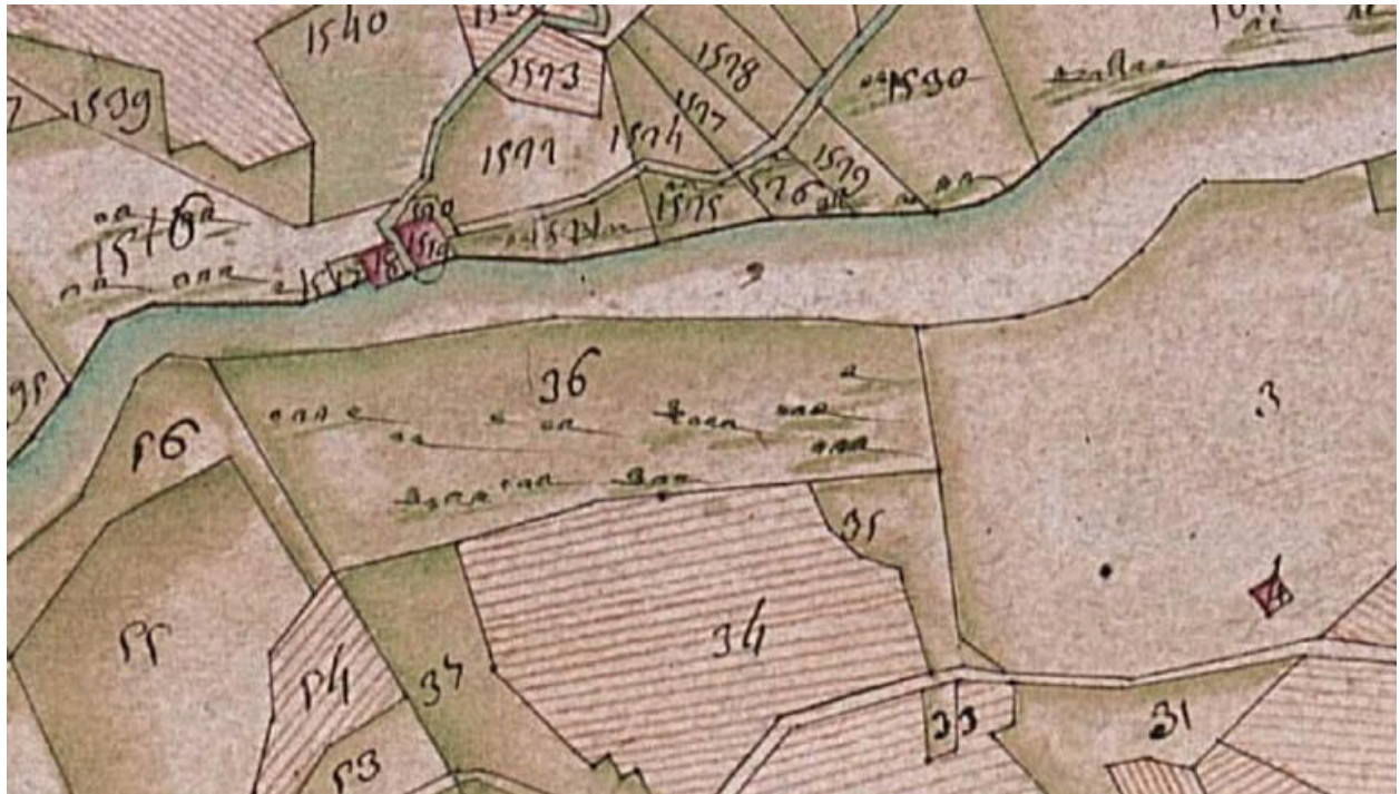
Cadastre de 1728, Flumet, 1731 368, Vue 7 (FR.AD073, C2851).