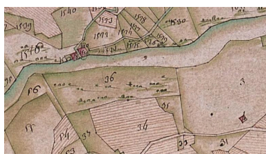
Cadastre de 1728, Flumet, 1731 368, Vue 7 (FR.AD073, C2851). IVR84_20167306238NUCA