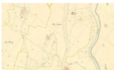
Premier cadastre français, Flumet, 1942, Section B, feuille 10 (FR.AD073, 3P 7428). IVR84_20167306239NUCA