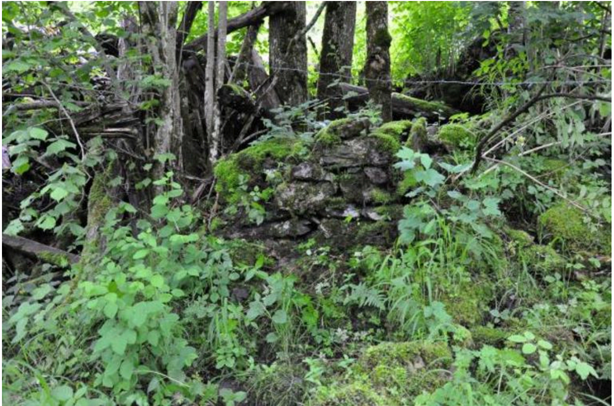
Vestiges du moulin.