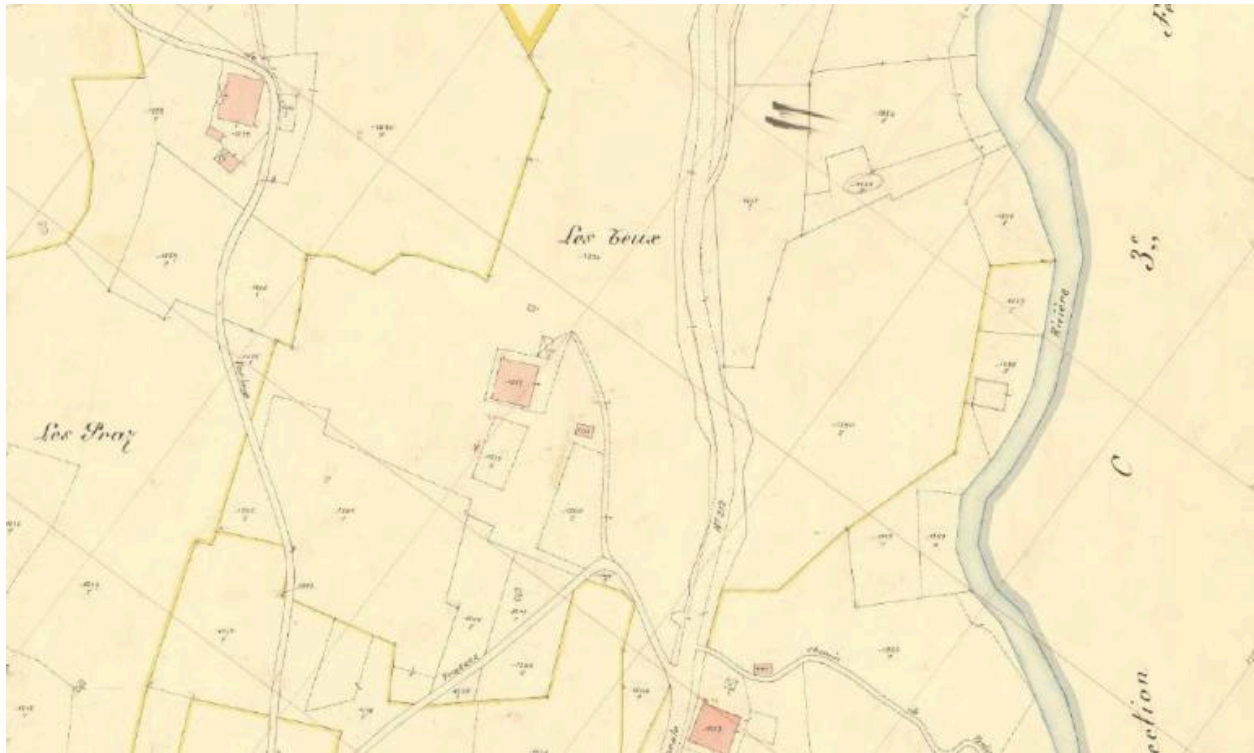
Premier cadastre français, Flumet, 1942, Section B, feuille 10 (FR.AD073, 3P 7428).