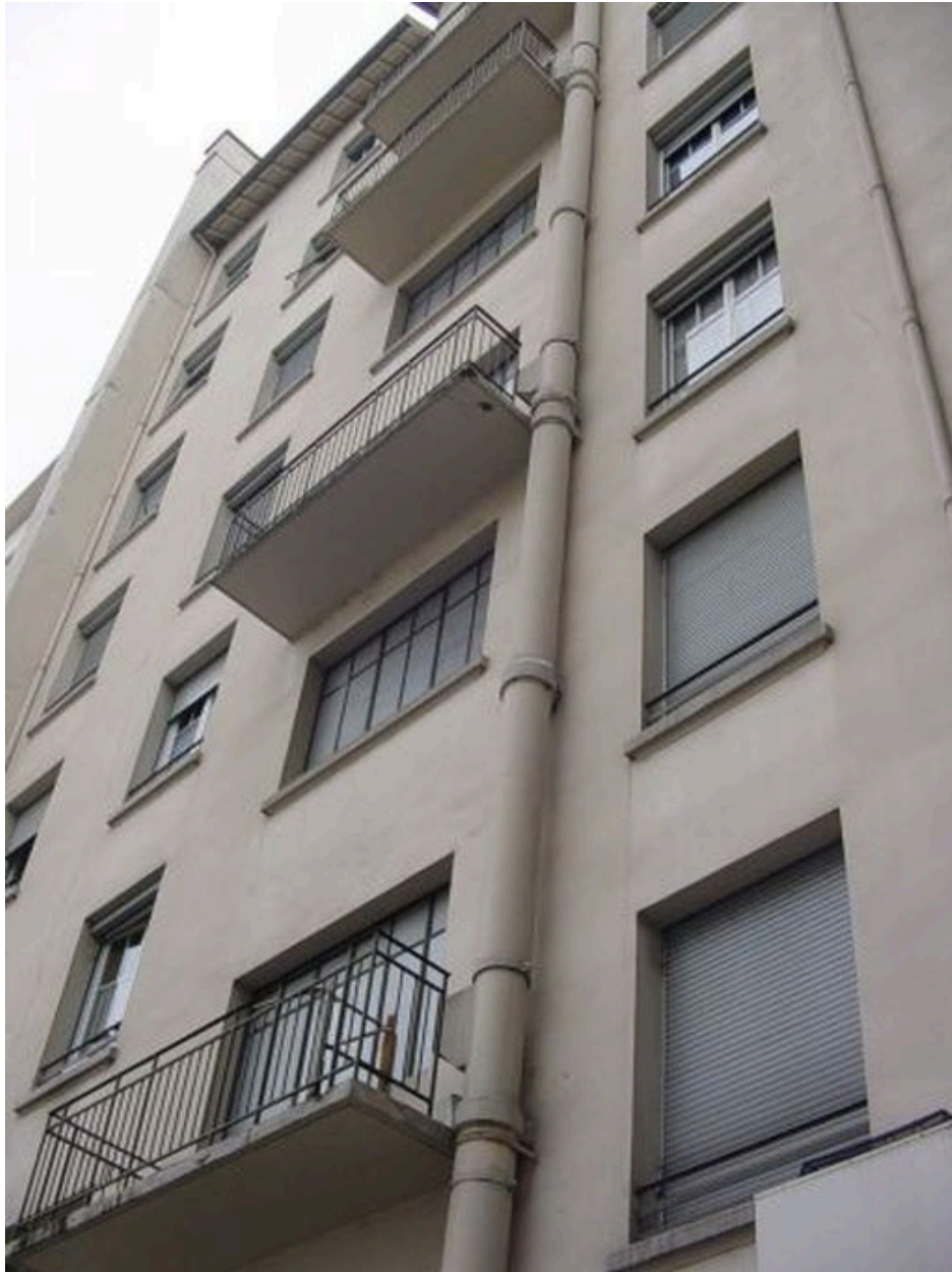
Façade postérieure sur cour