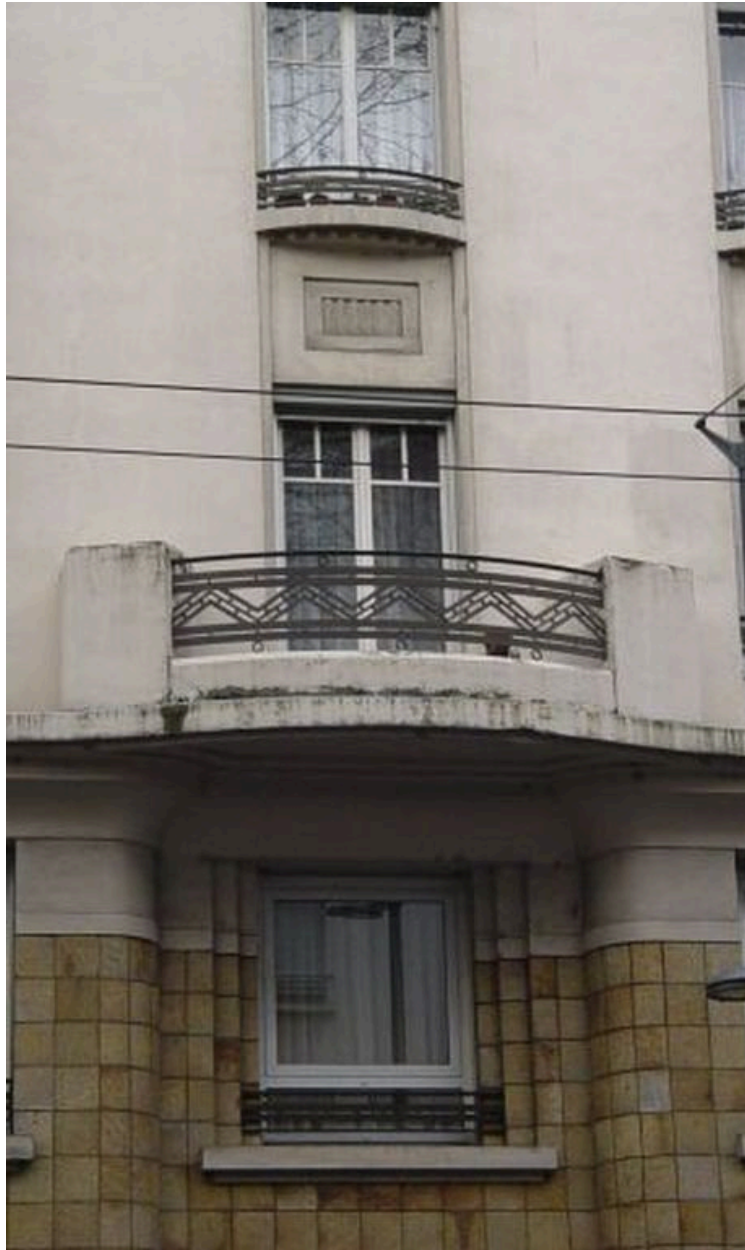
Détail de l'élévation