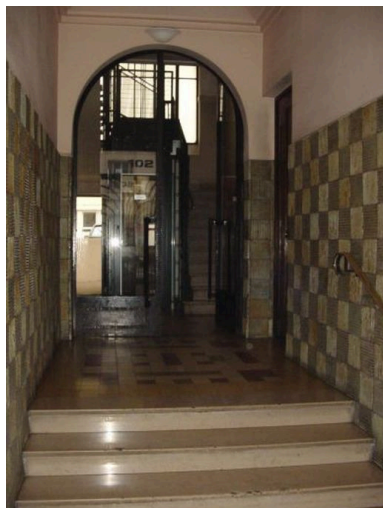
Vestibule IVR82_20046903491NUCA