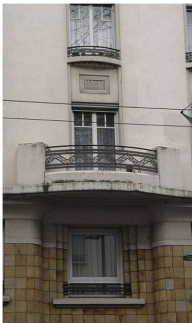
Détail de l'élévation IVR82_20046903486NUCA