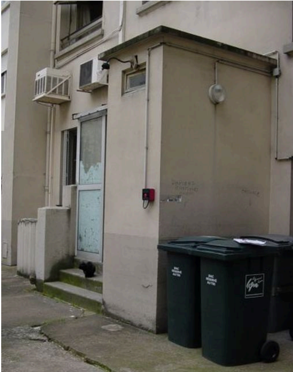
Loge de concierge