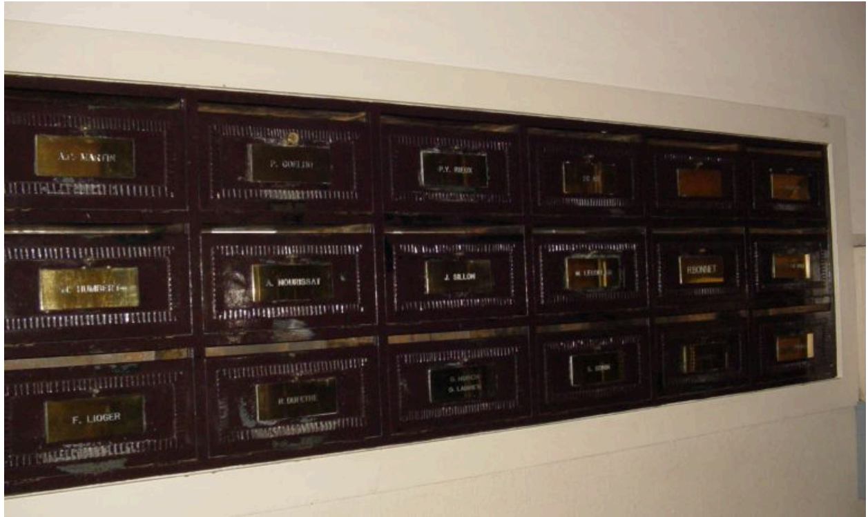
Boîtes aux lettres