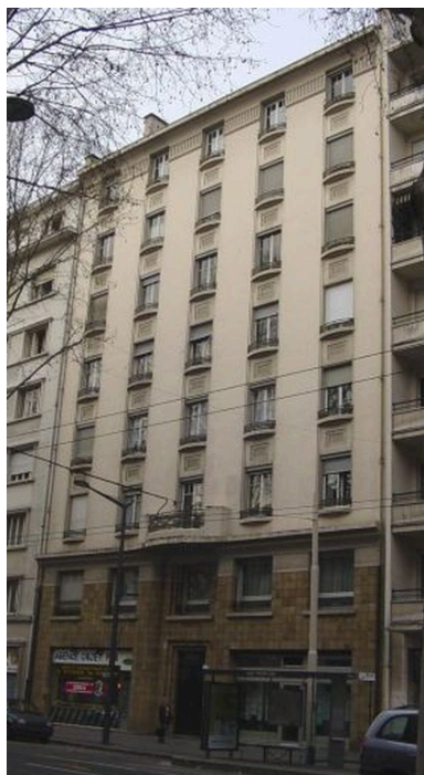
Vue générale de l'élévation