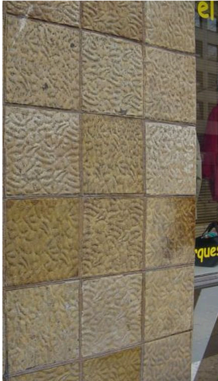
Détail du rez-de-chaussée