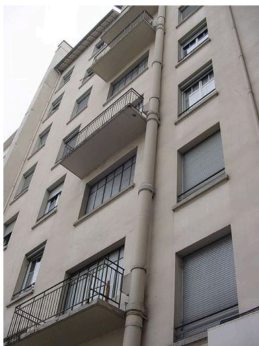
Façade postérieure sur cour