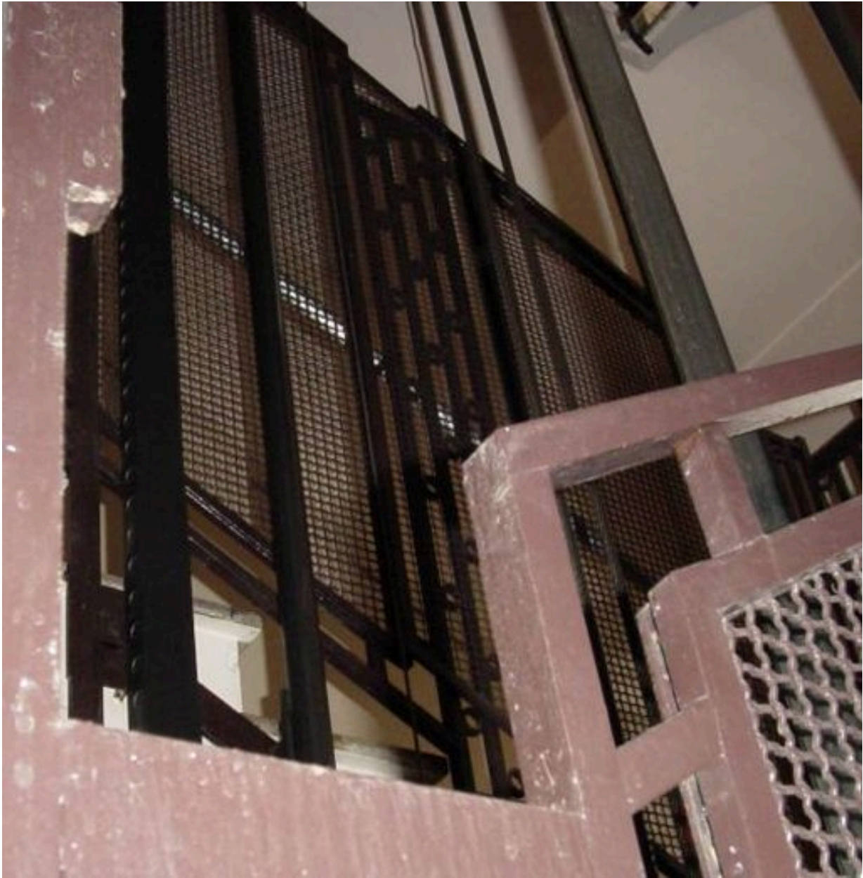
Ferronnerie de la cage d'ascenseur