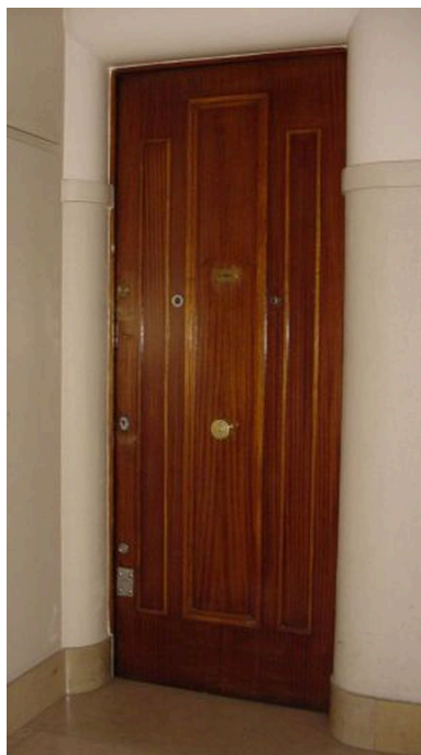
Porte palière IVR82_20046903494NUCA