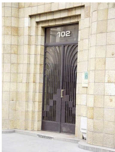
Porte d'entrée IVR82_20046903488NUCA