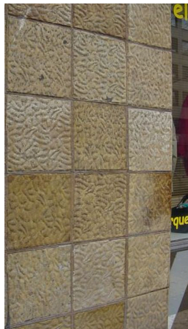
Détail du rez-de-chaussée