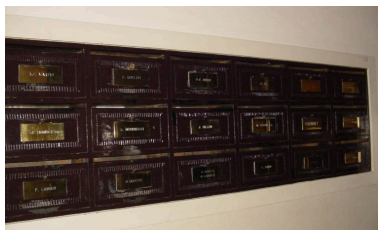
Boîtes aux lettres IVR82_20046903492NUCA