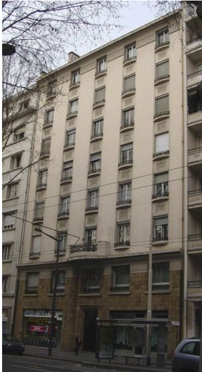
Vue générale de l'élévation