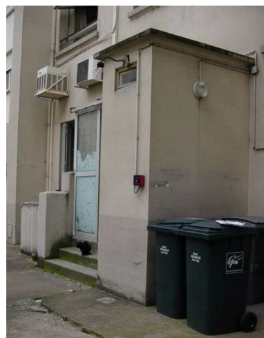
Loge de concierge IVR82_20046903490NUCA