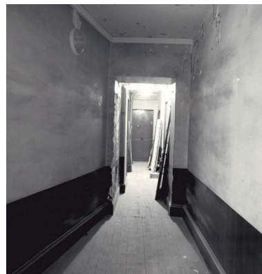
Vue d'un couloir de distribution des logements IVR82_20016902489X