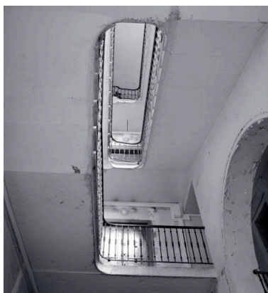
Vue de la cage d'escalier depuis le bas IVR82_20016902488X