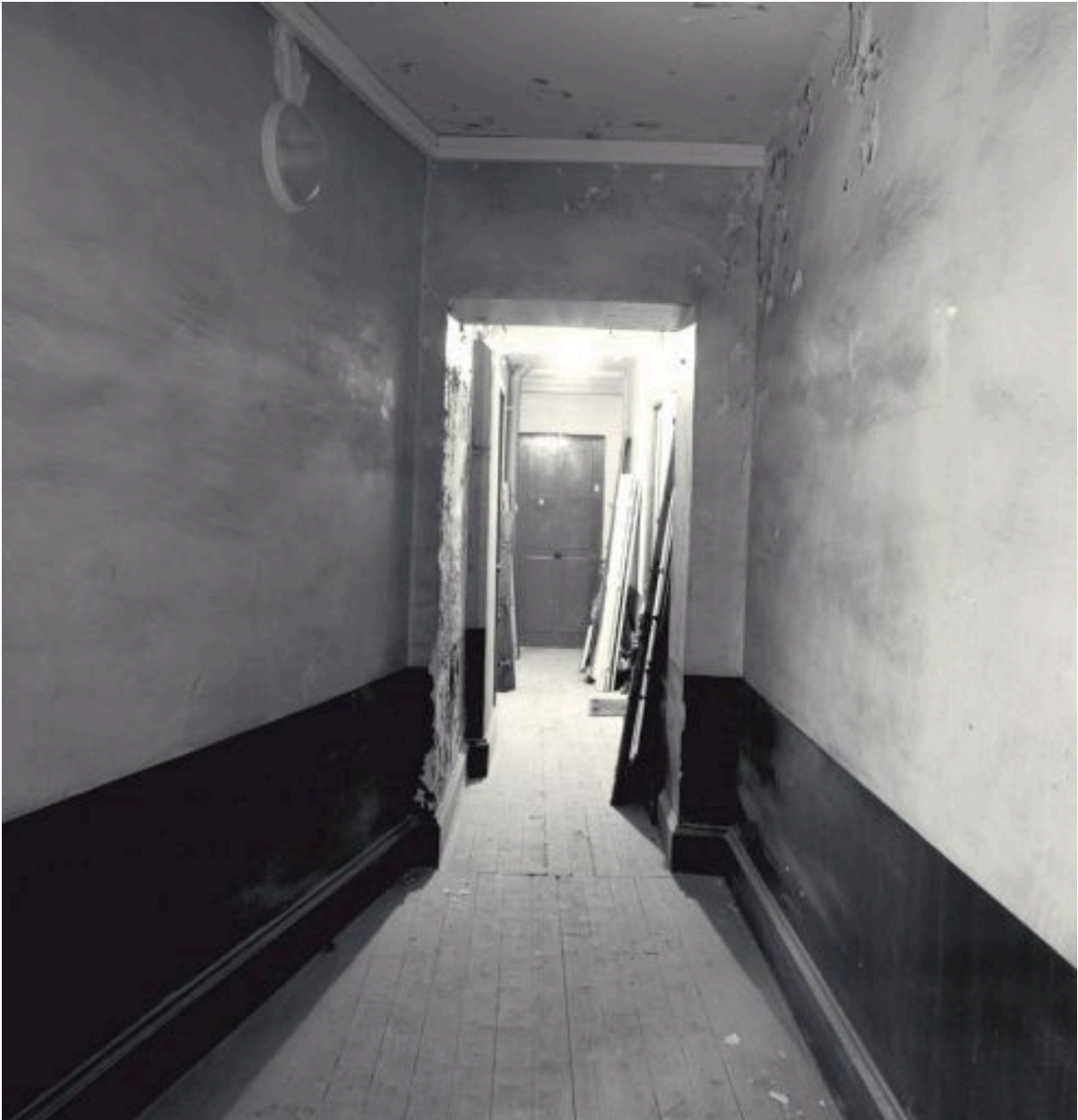
Vue d'un couloir de distribution des logements