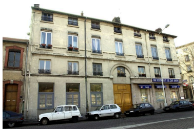
Vue générale, quai Rambaud IVR82_20016900354NUCA