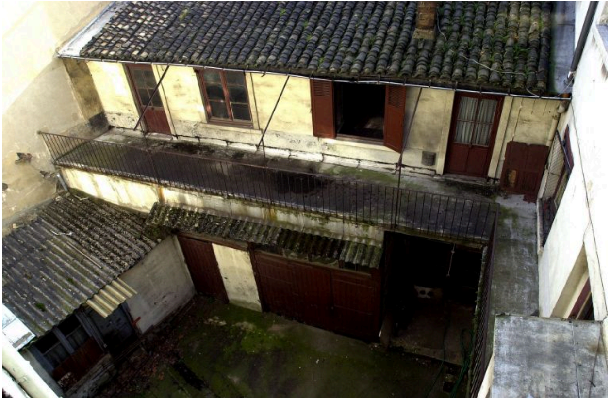
Vue de l'immeuble en fond de cour