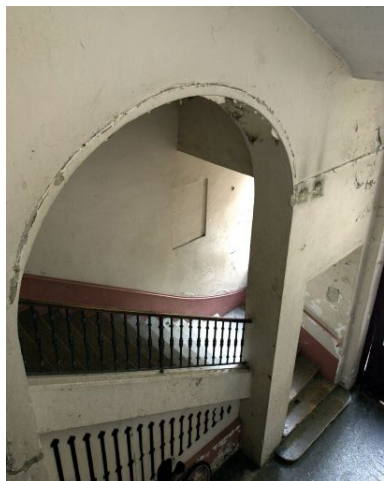
Vue de la 1ère volée d'escalier et de l'arcade du mur d'échiffre IVR82_20016900363NUCA