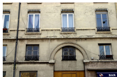
Détail de la baie d'entresol au-dessus de l'entrée