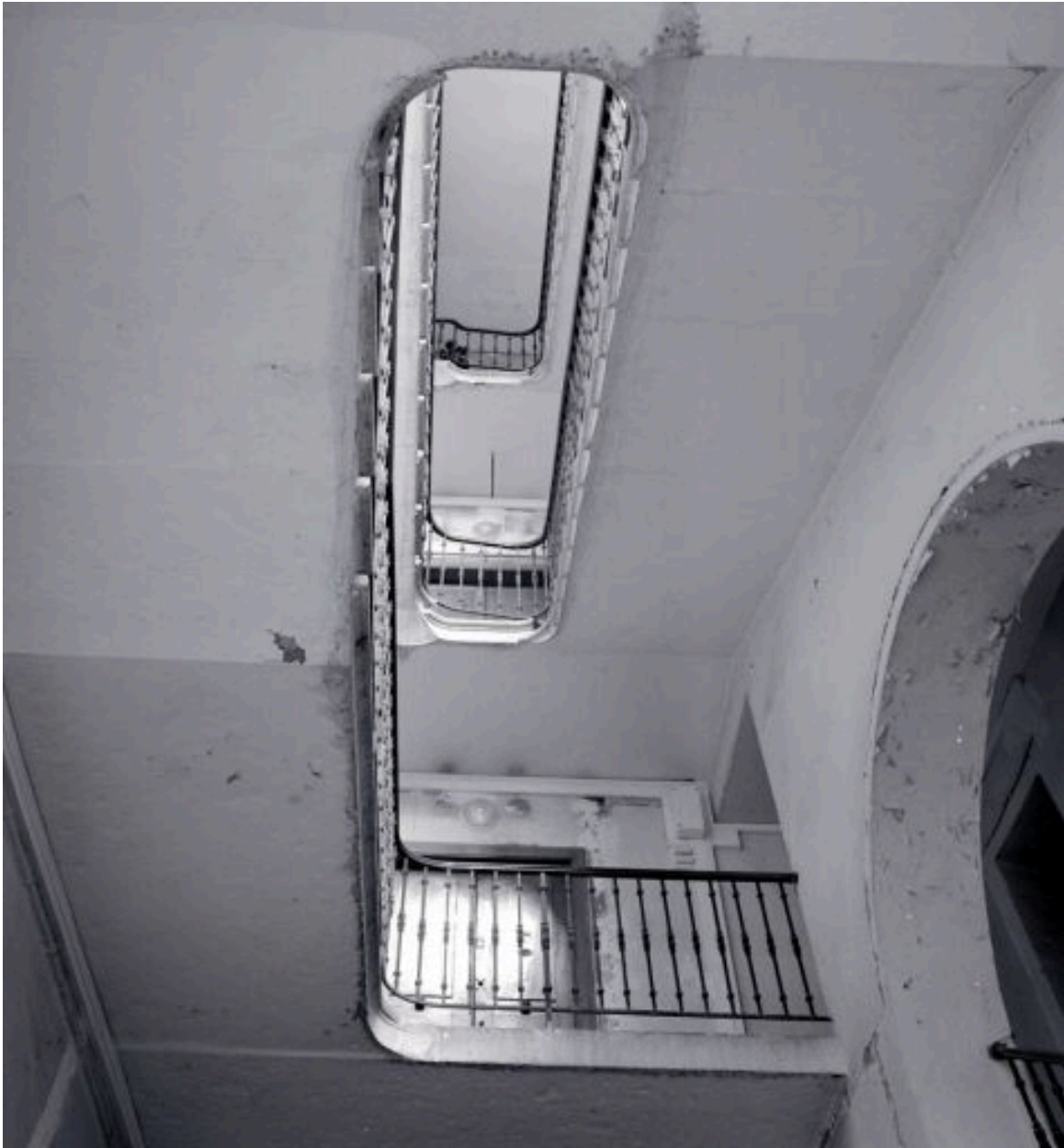
Vue de la cage d'escalier depuis le bas