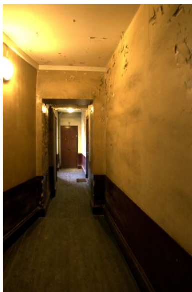
Vue d'un couloir desservant les logements IVR82_20016900360NUCA