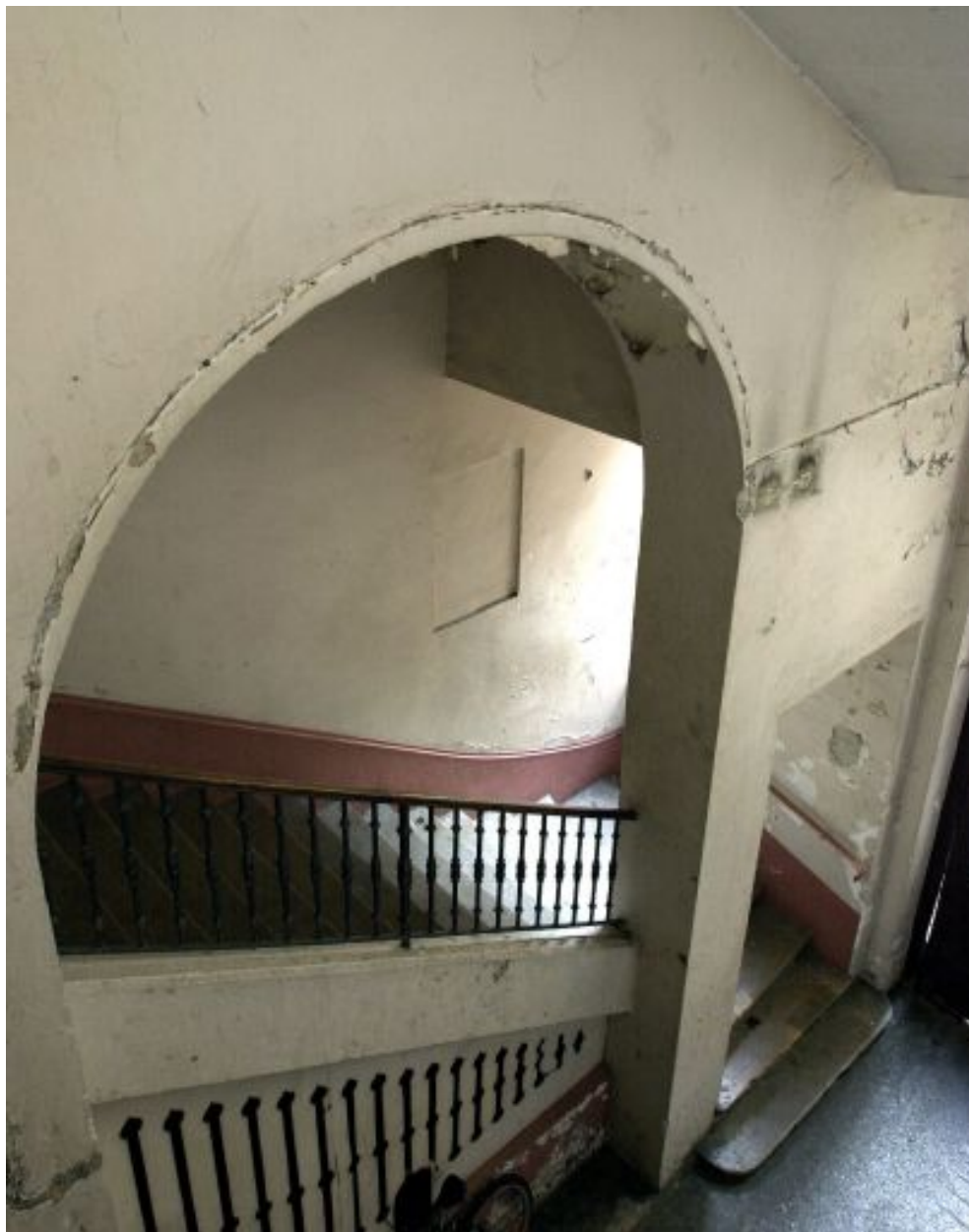
Vue de la 1ère volée d'escalier et de l'arcade du mur d'échiffre