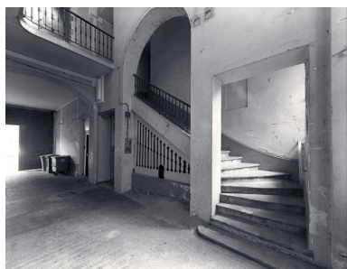
Vue de l'escalier et du vestibule d'entrée IVR82_20016902487V