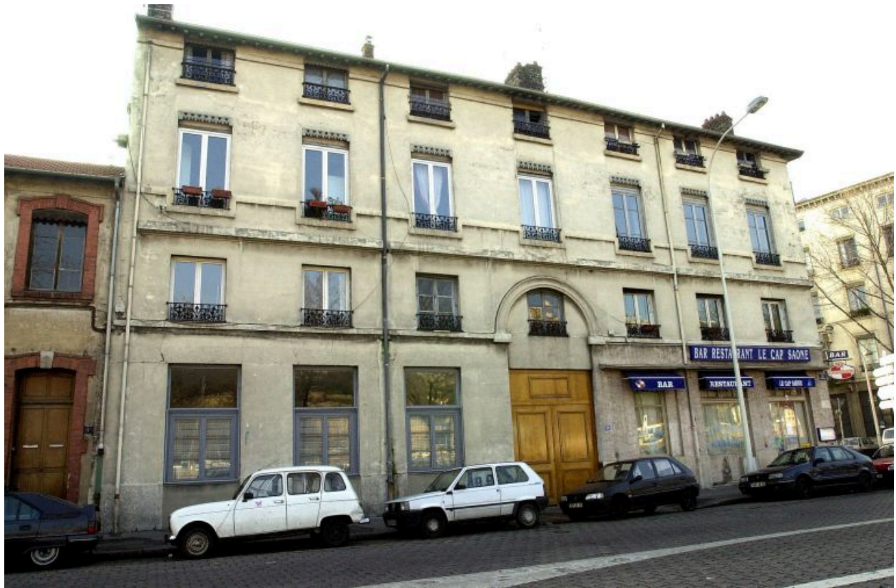
Vue générale, quai Rambaud