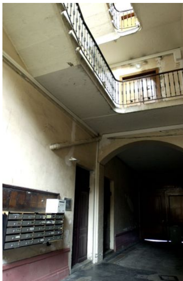
Vue du vestibule et de l'escalier