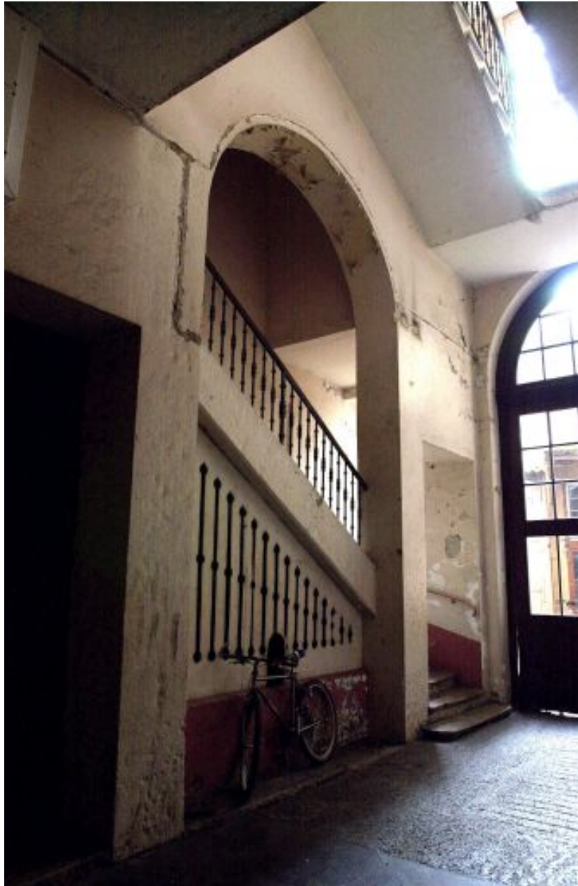
Vue du départ de l'escalier