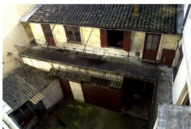
Vue de l'immeuble en fond de cour IVR82_20016900361NUCA