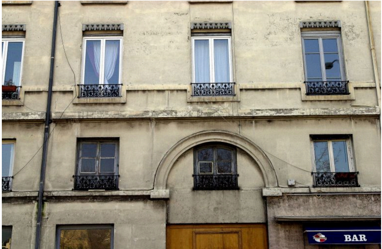
Détail de la baie d'entresol au-dessus de l'entrée