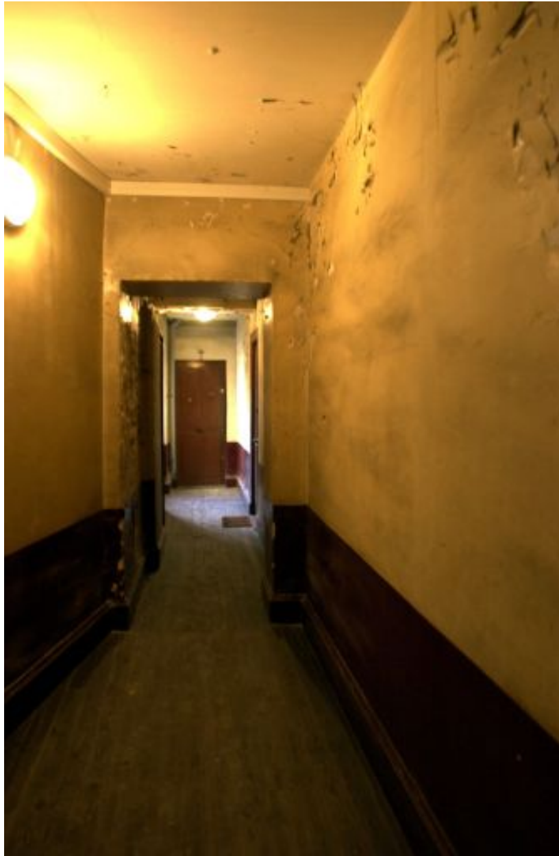
Vue d'un couloir desservant les logements