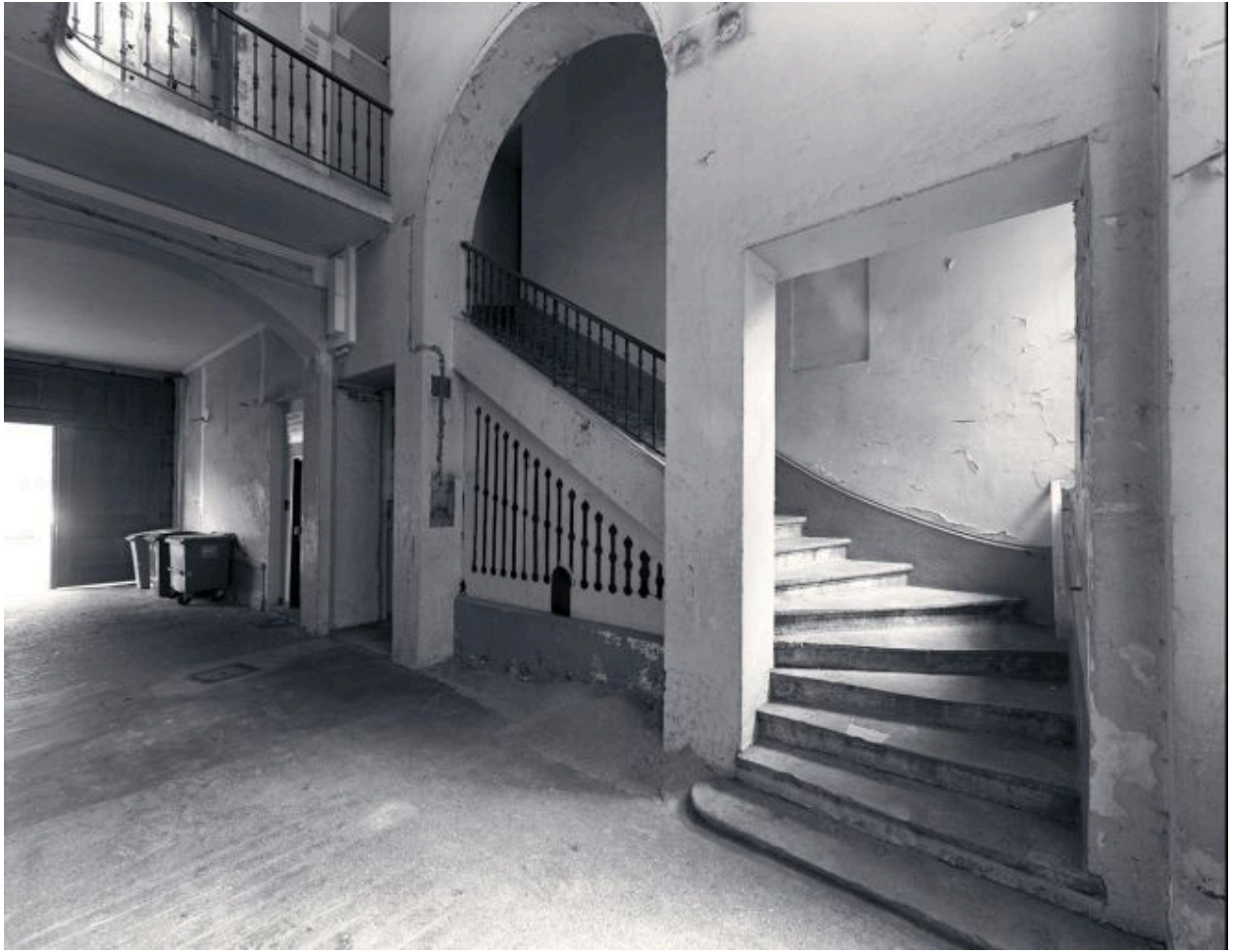
Vue de l'escalier et du vestibule d'entrée