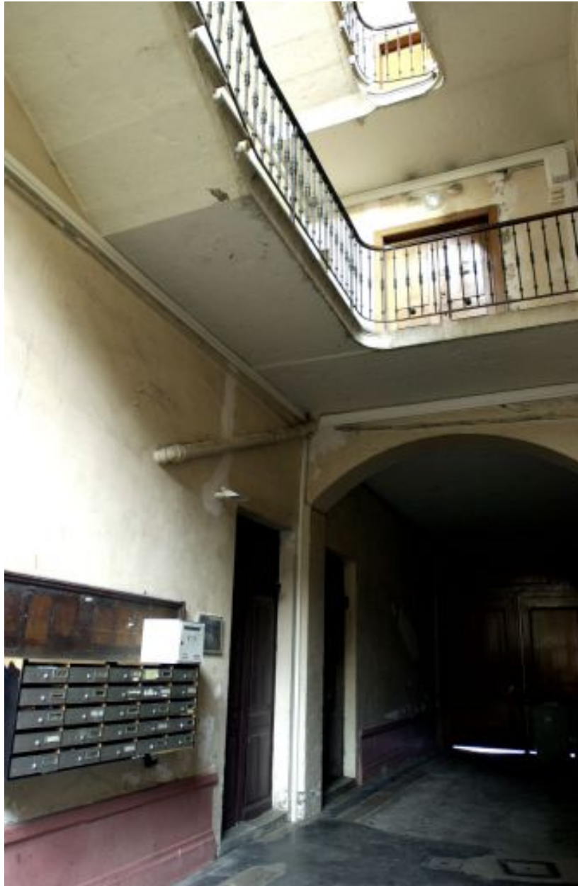
Vue du vestibule et de l'escalier