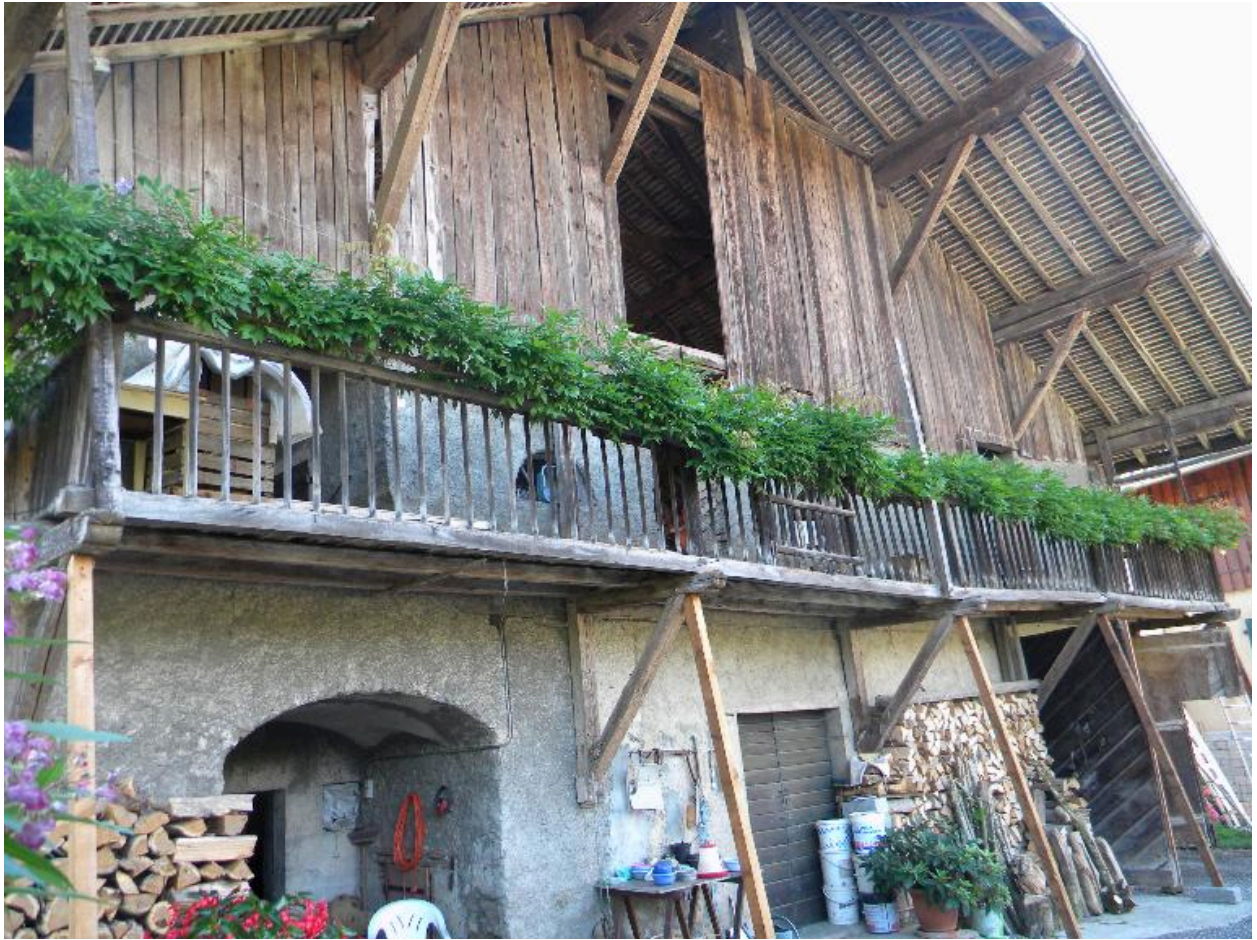
Vue de la façade principale