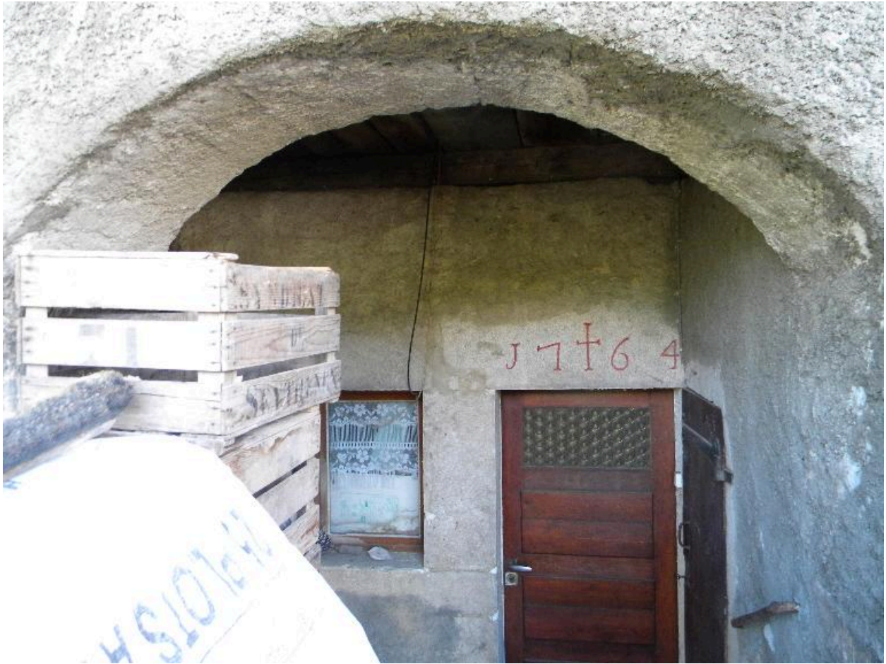
Vue du porche d'entrée du logis depuis la galerie de desserte.