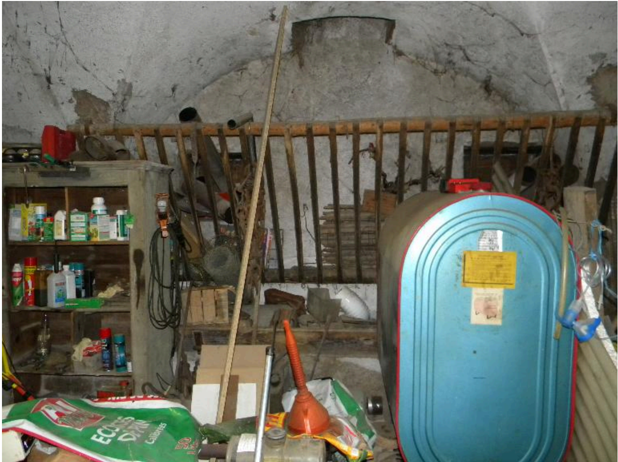
Vue de la mangeoire dans l'étable voutée d'arête.