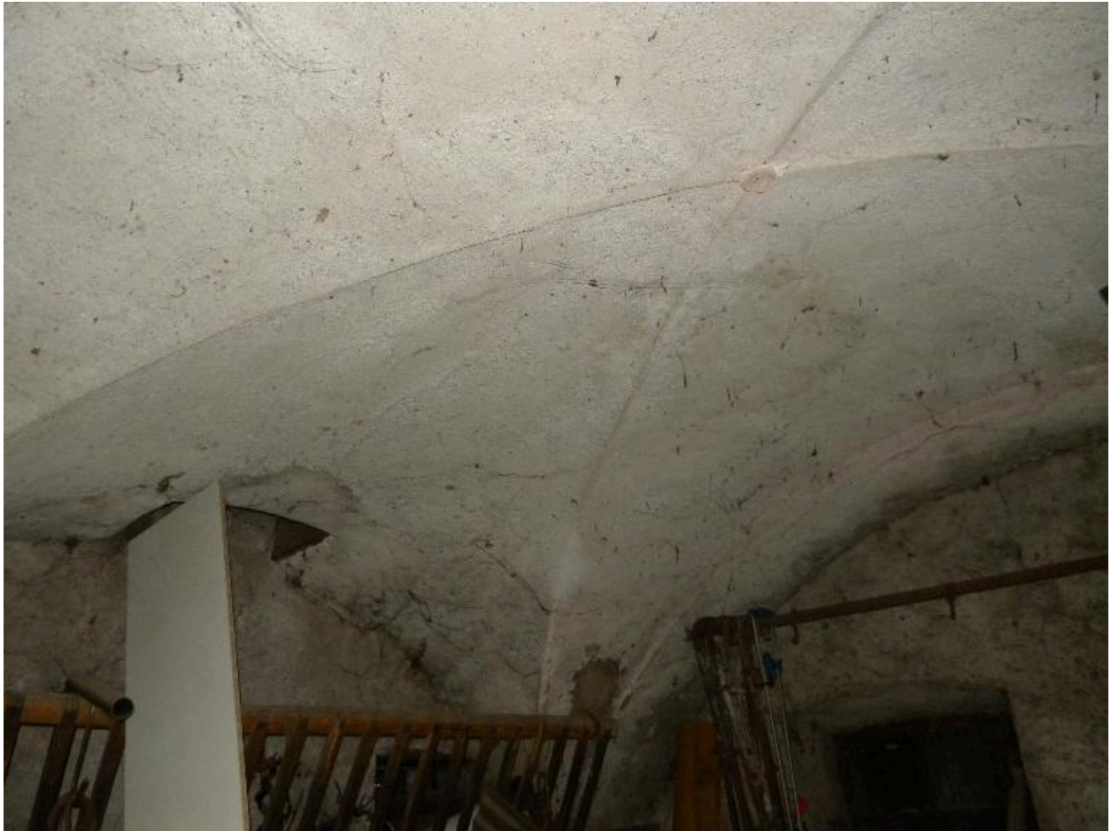
Vue du plafond voûté d'arête de l'étable.