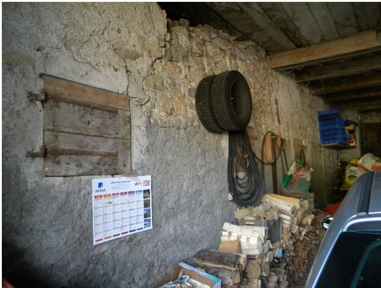
Vuie de la remise avec les trapes communiquant avec l'étable.