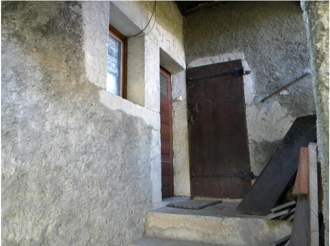
Vue des encadrements de l'entrée du logis.