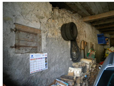
Vue de la remise avec les trapes communiquant avec l'étable.

Phot. Jérôme Daviet IVR82_20147400012NUCA