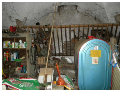
Vue de la mangeoire dans l'étable voutée d'arête.

IVR82_20147400013NUCA