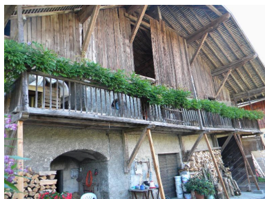
Vue de la façade principale