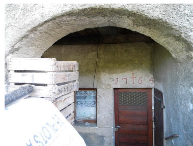
Vue du porche d'entrée du logis depuis la galerie de desserte.