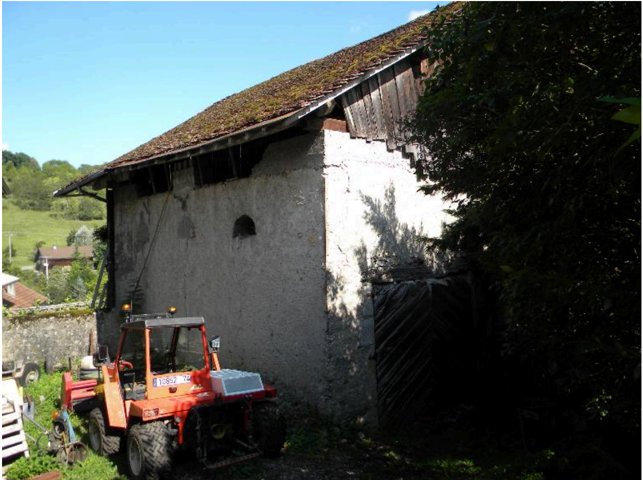
Vue de la façade arrière avec les aérations de la remise.