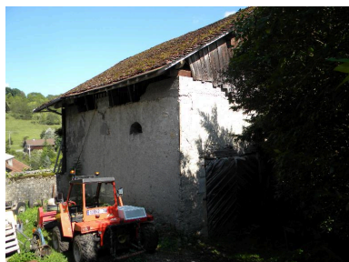
Vue de la façade arrière avec les aérations de la remise.

IVR82_20147400015NUCA