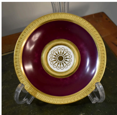
Vue de la soucoupe IVR84_20256300914NUCA