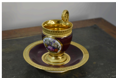
Vue de l'ensemble IVR84_20256300910NUCA