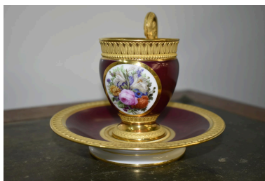
Vue de l'ensemble IVR84_20256300911NUCA