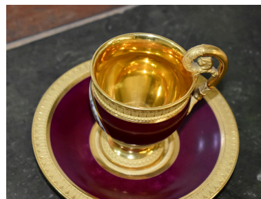
Vue de l'ensemble IVR84_20256300912NUCA