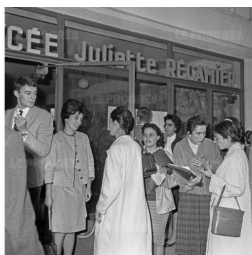
Entrée du lycée, ca 1960 (le tableau est partiellement visible à l'arrière plan)