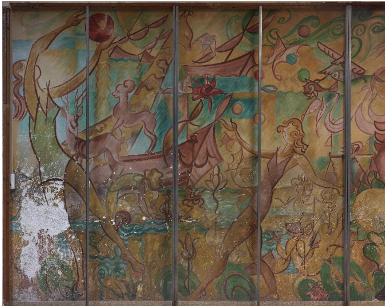
Détail de la partie gauche