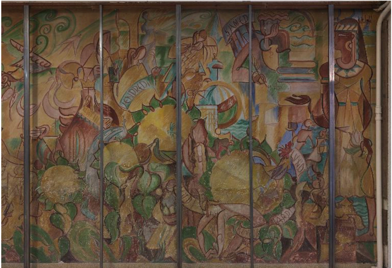
Détail de la partie droite