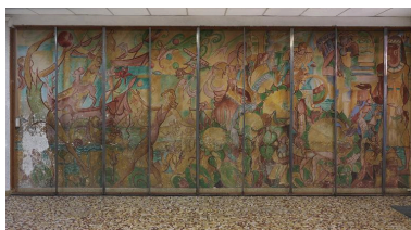
Vue générale IVR84_20166901551NUCAQ