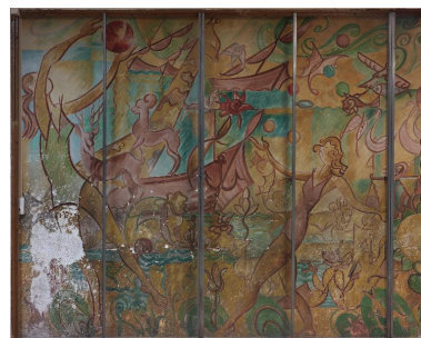
Détail de la partie gauche