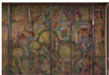
Détail de la partie droite IVR84_20166901558NUCAQ