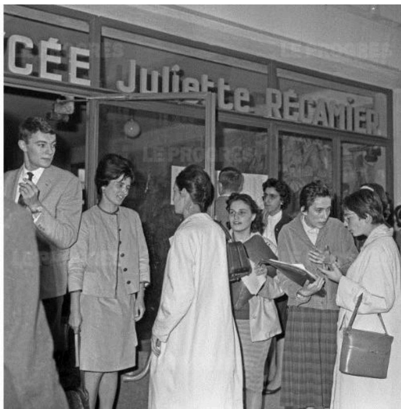
Entrée du lycée, ca 1960 (le tableau est partiellement visible à l'arrière plan)