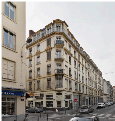
Vue d'ensemble IVR84_20166901362NUCAQ