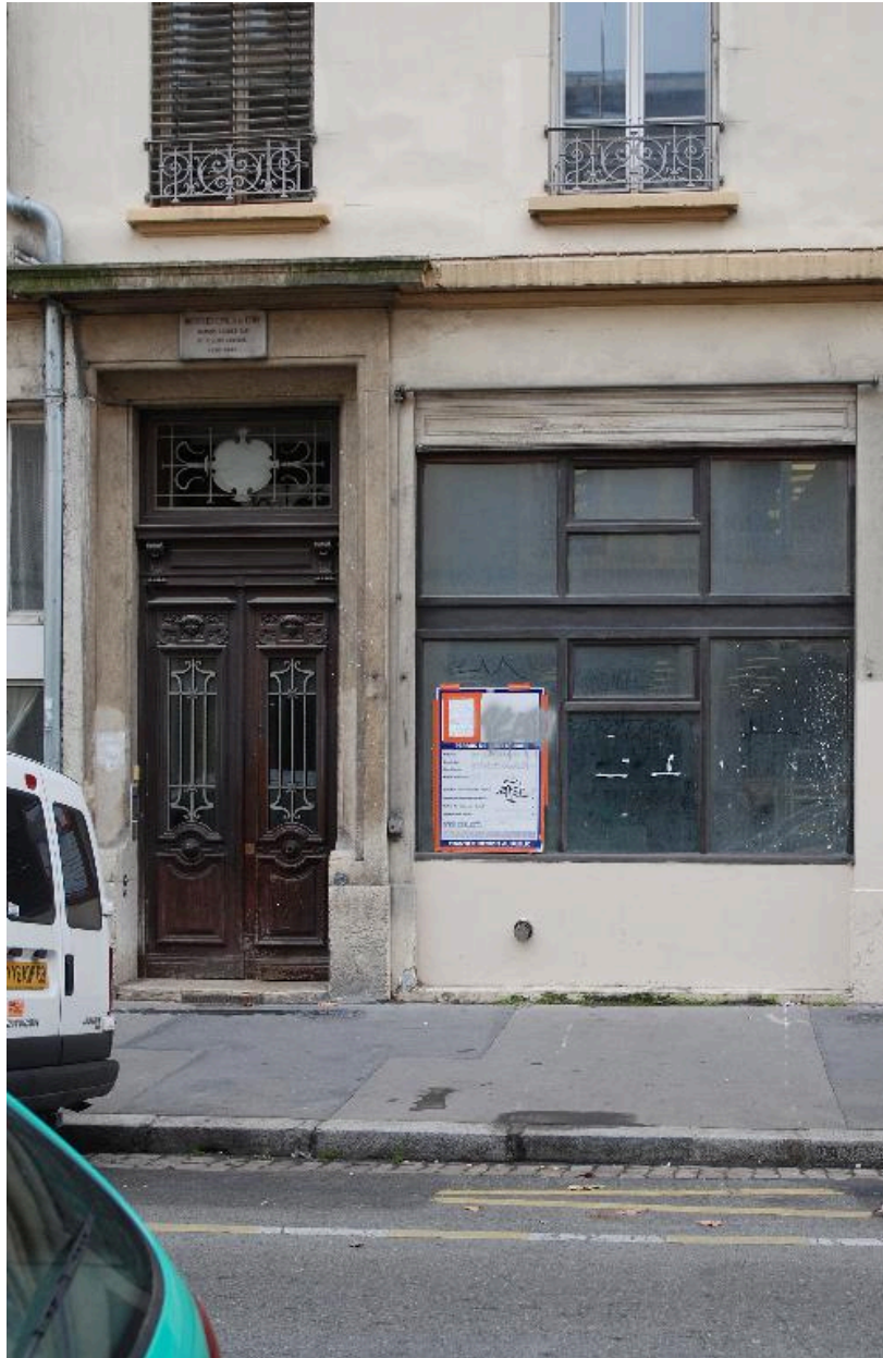
Vue rapprochée de la porte d'entrée