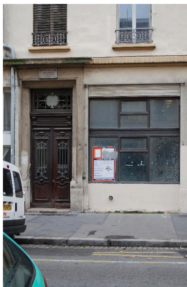
Vue rapprochée de la porte d'entrée IVR82_20146902954NUCA