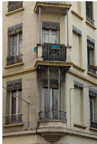
Vue rapprochée des balcons superposés sur l'angle d'ilot : ferronneries Art Nouveau