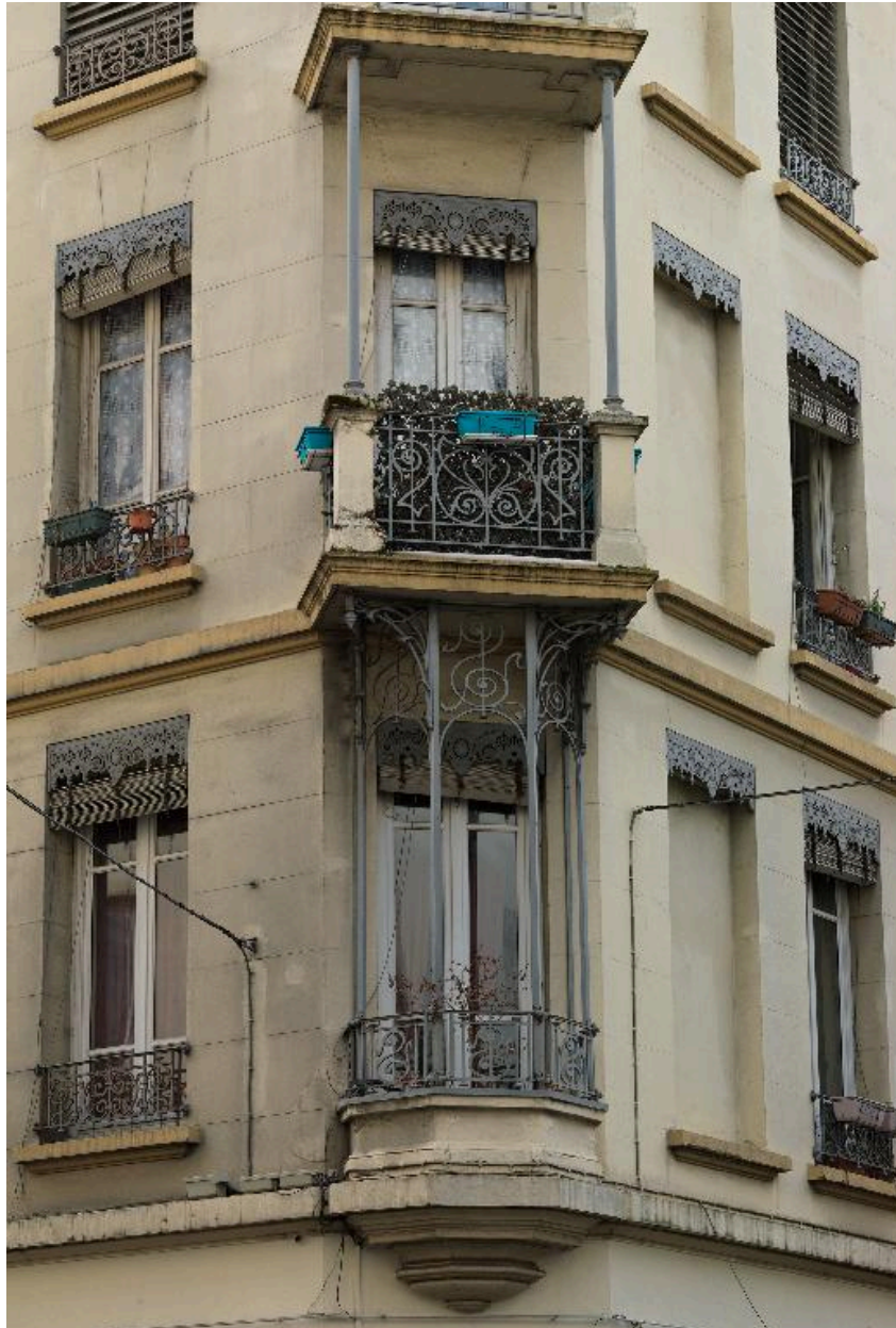
Vue rapprochée des balcons superposés sur l'angle d'ilot : ferronneries Art Nouveau