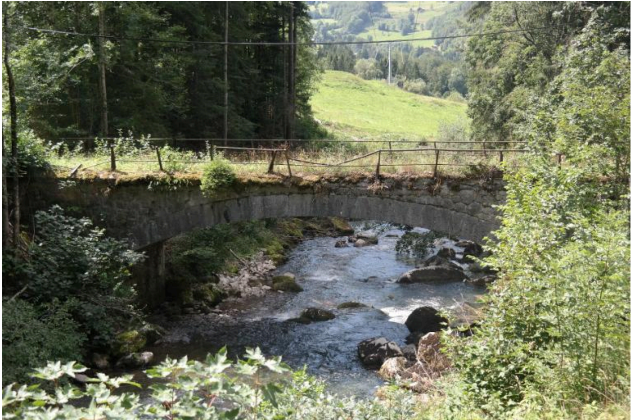
Pont des Portes ancien, vue de la face amont