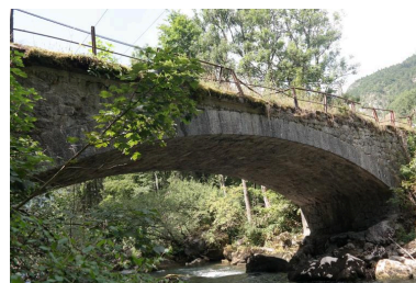
Pont des Portes ancien, vue de la face amont et garde-corps IVR84_20207401026NUCA