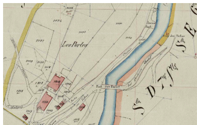
Extrait de la section E Feuille n°7 du cadastre d'Abondance. 1920. IVR84_20207401022NUCA