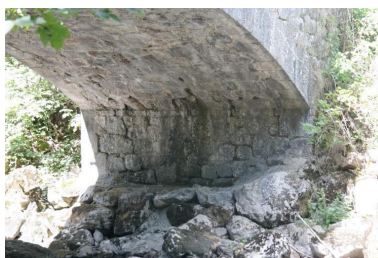
Pont des Portes ancien, vue du dessous