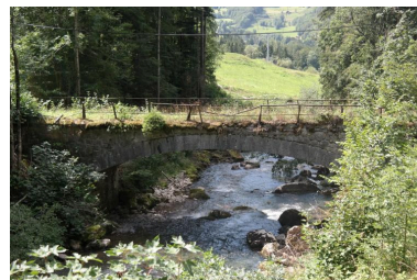
Pont des Portes ancien, vue de la face amont IVR84_20207401023NUCA