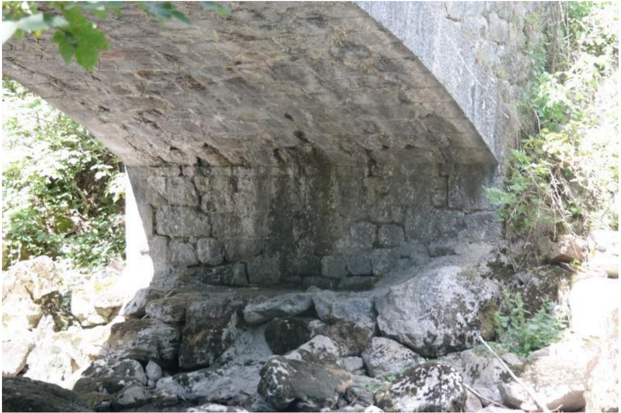
Pont des Portes ancien, vue du dessous