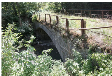
Vue générale du pont des Portes ancien