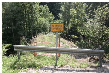
Pont des Portes ancien, vue de la chaussée et des garde-corps IVR84_20207401024NUCA