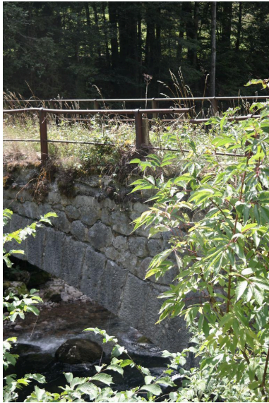
Pont des Portes ancien, détail tablier et garde-corps