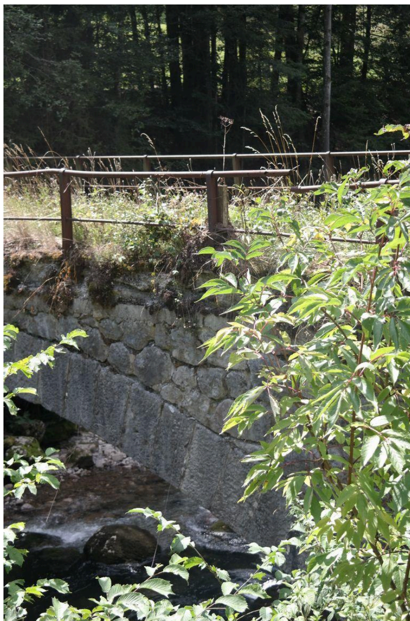
Pont des Portes ancien, détail tablier et garde-corps