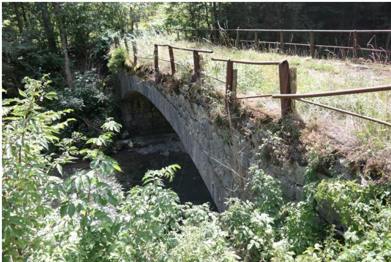
Vue générale du pont des Portes ancien