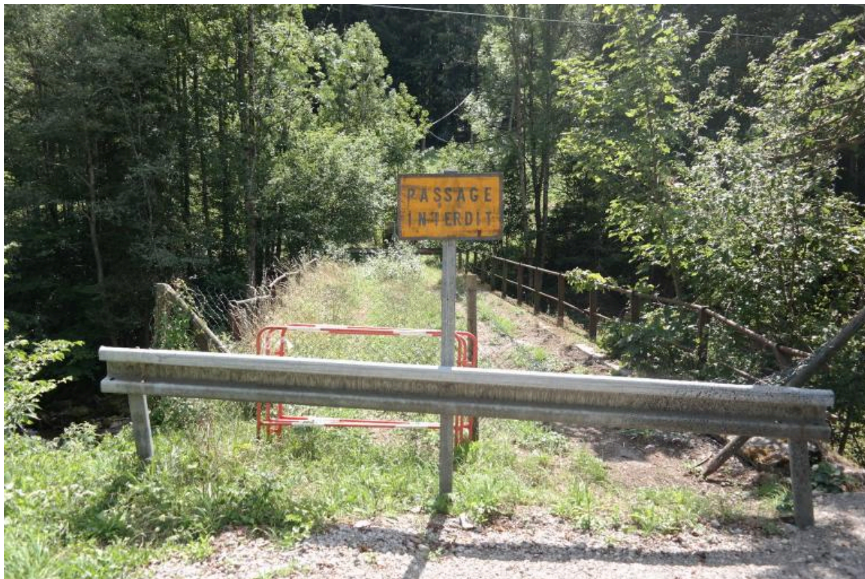
Pont des Portes ancien, vue de la chaussée et des garde-corps