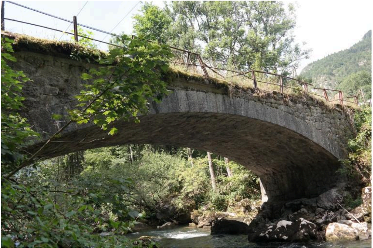
Pont des Portes ancien, vue de la face amont et garde-corps