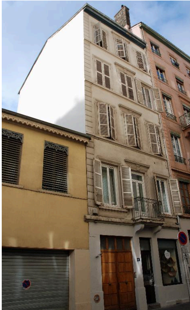
Vue générale de l'élévation sur rue