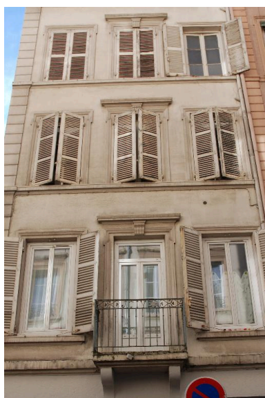
Vue rapprochée de l'élévation sur rue