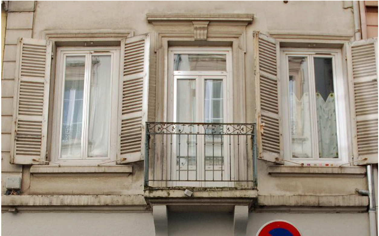
Détail du premier étage