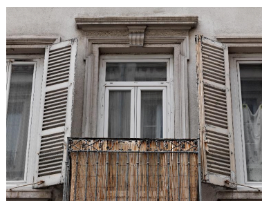
Garde-corps du balcon, inscription en ferronnerie