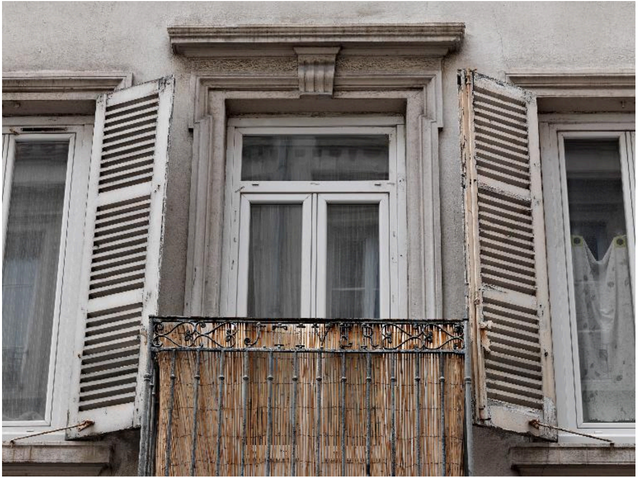
Garde-corps du balcon, inscription en ferronnerie