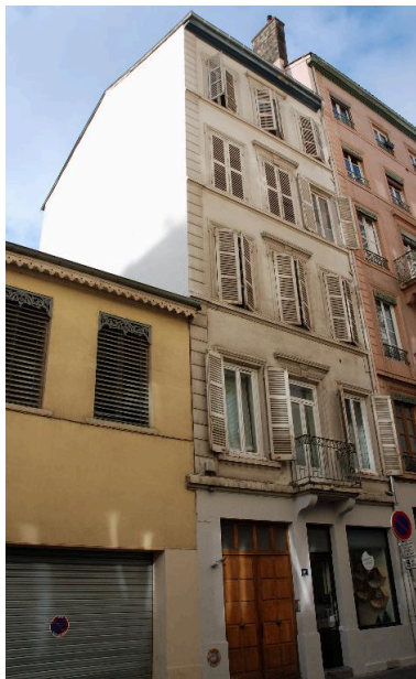
Vue générale de l'élévation sur rue