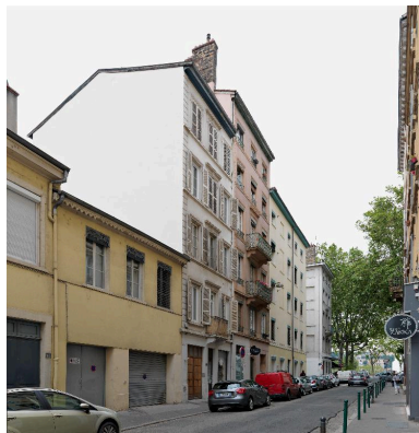
Vue d'ensemble IVR84_20166901457NUCA