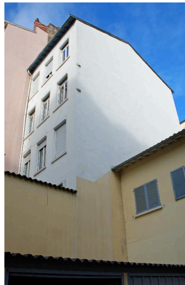
Vue des élévations latérale et postérieure IVR82_20146902960NUCA