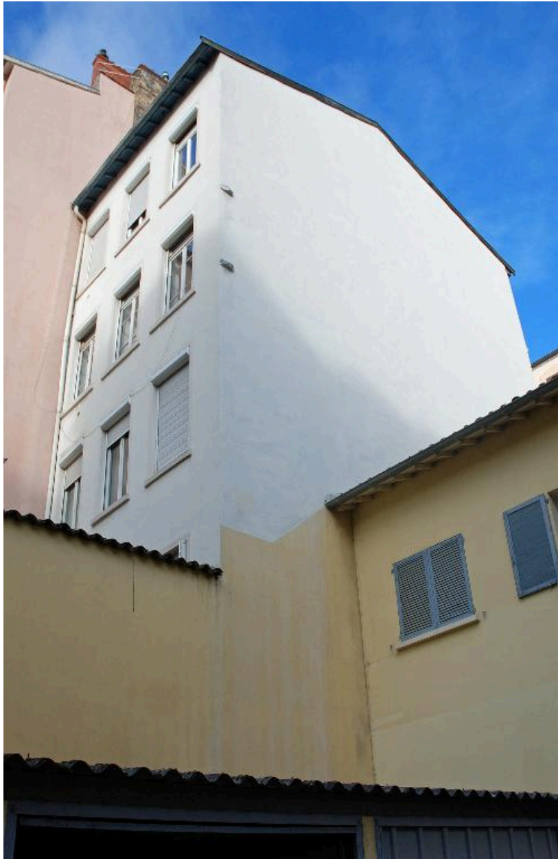
Vue des élévations latérale et postérieure