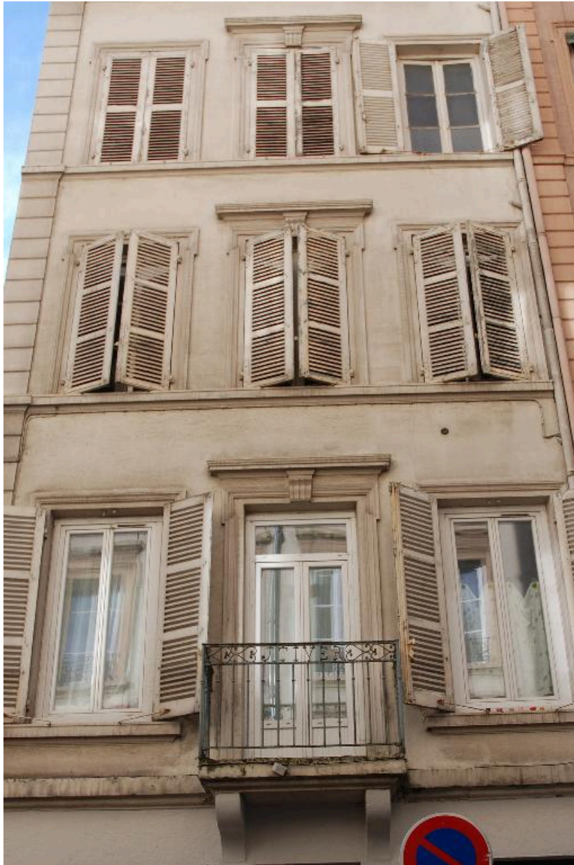
Vue rapprochée de l'élévation sur rue