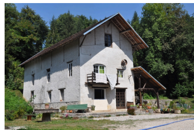
Vue générale IVR82_20107300291NUCA