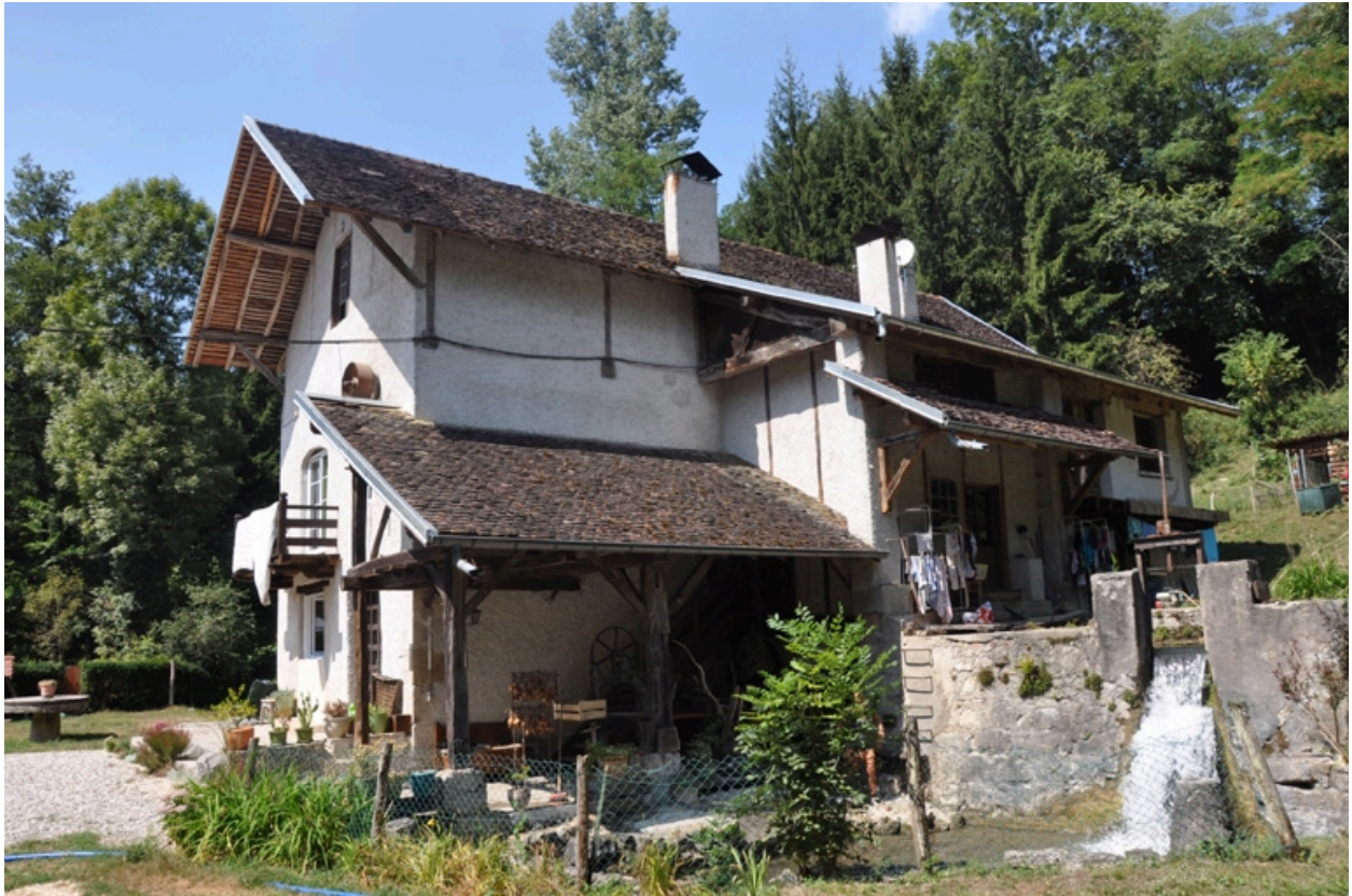
Vue façade est avec la réserve d'eau