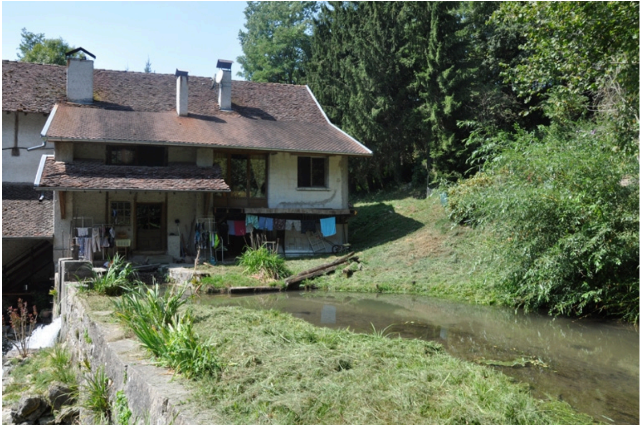
Détail de la réserve d'eau du moulin