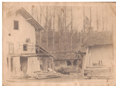
Vue du moulin transformé en scierie au début du 20e siècle IVR82_20107300290NUCA