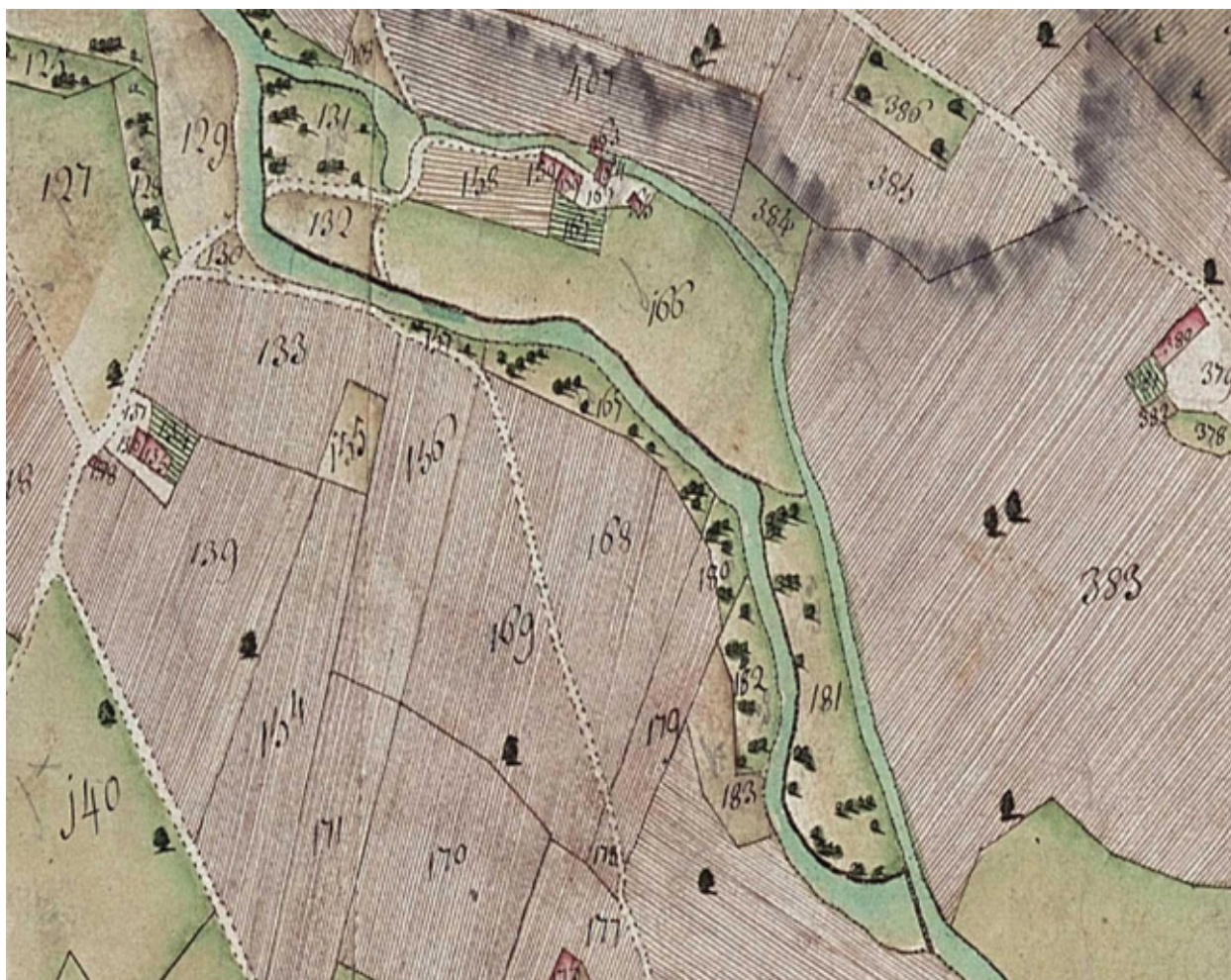
Cadastré de 1732. Cadastre de 1728 AD Savoie. C2213