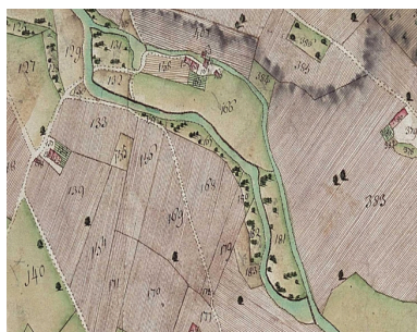
Cadastre de 1732. Cadastre de 1728 AD Savoie. C2213 IVR82_20107300286NUCA