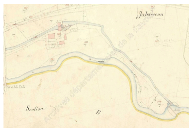
Premier cadastre français, 1909. Cadastre de 1909 AD Savoie. 3P 7039 IVR82_20107300287NUCA