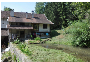
Détail de la réserve d'eau du moulin