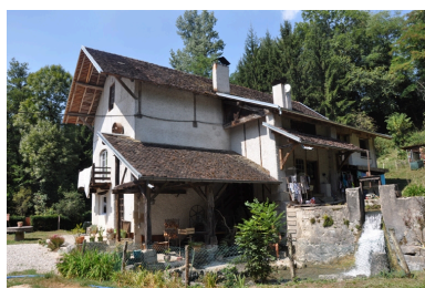
Vue façade est avec la réserve d'eau IVR82_20107300292NUCA