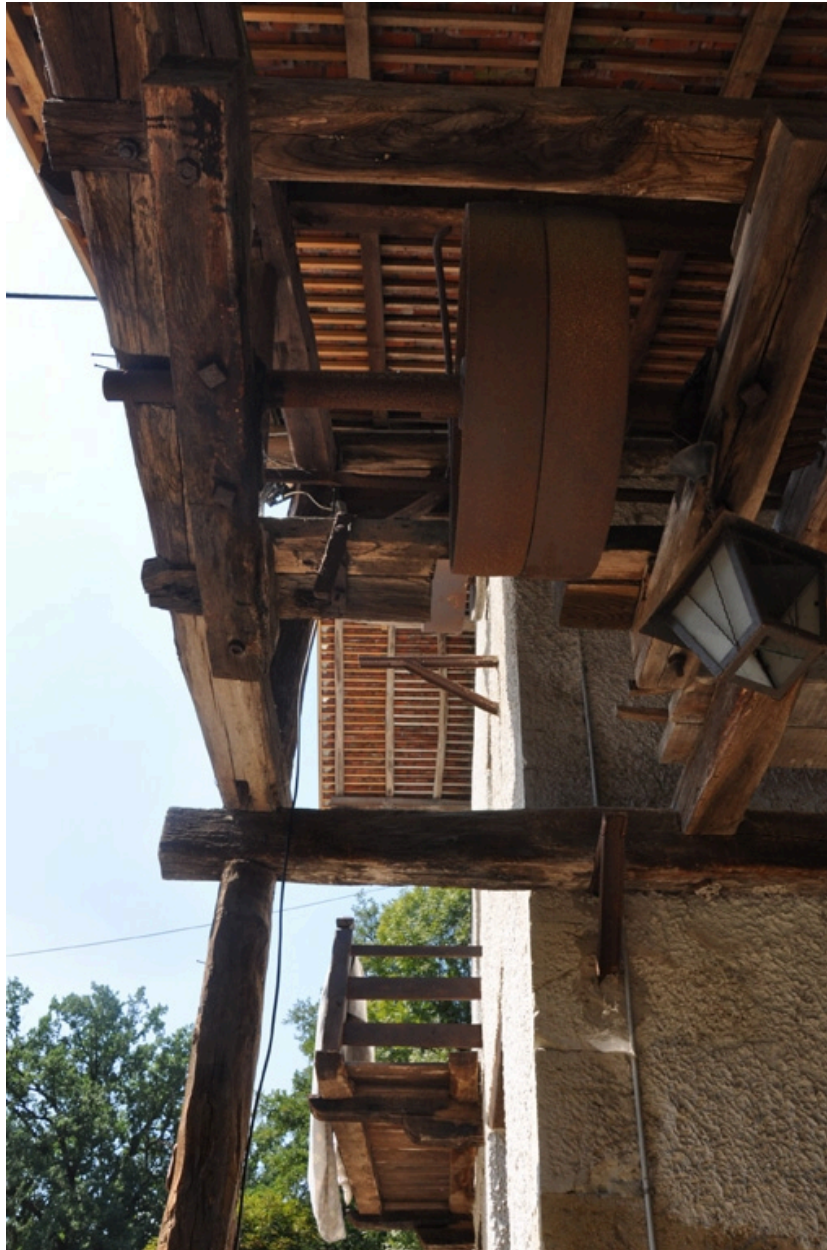
Détails des axes de transmission sur la façade sud