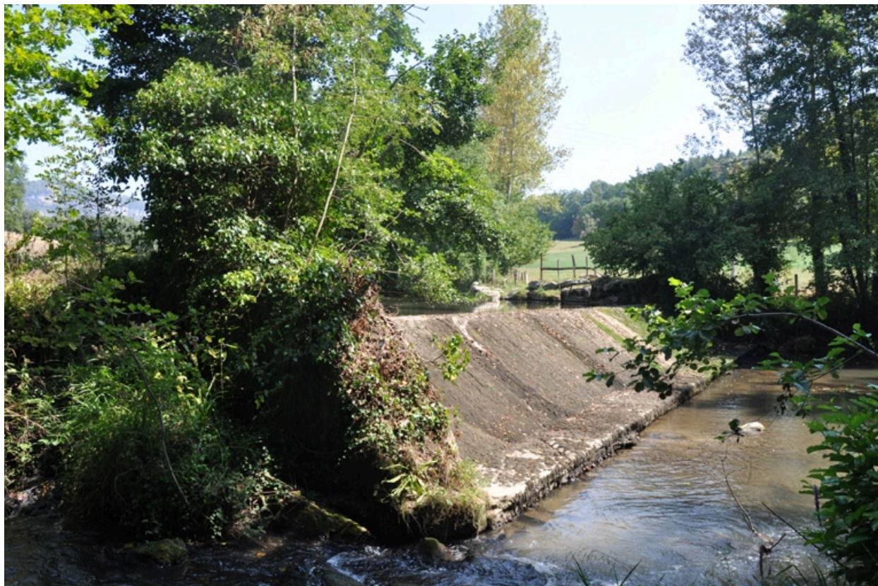
Vue du barrage sur le ruisseau du Tier