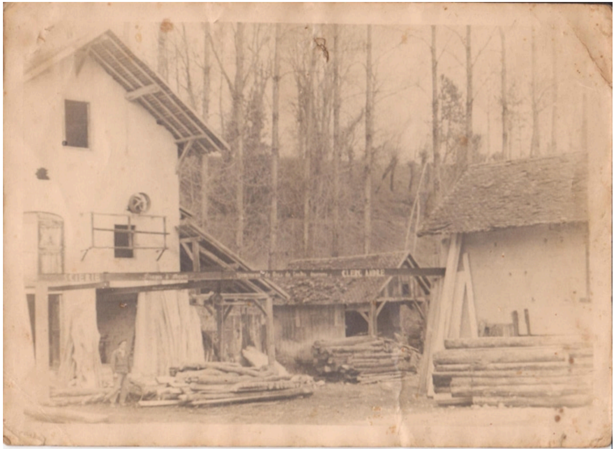
Vue du moulin transformé en scierie au début du 20e siècle