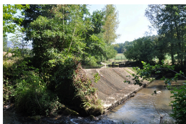
Vue du barrage sur le ruisseau du Tier