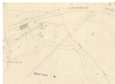
Cadastre rénové, 1952-1988. Cadastre de 1952-1988 AD Savoie. 3P 7036 IVR82_20107300288NUCA