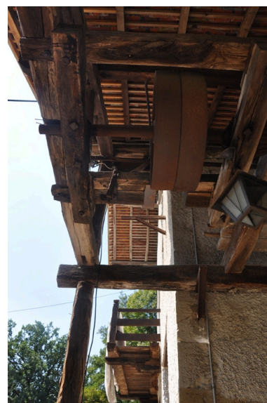
Détails des axes de transmission sur la façade sud