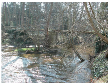
Vue d'ensemble de la passerelle. IVR82_20144200367NUCA