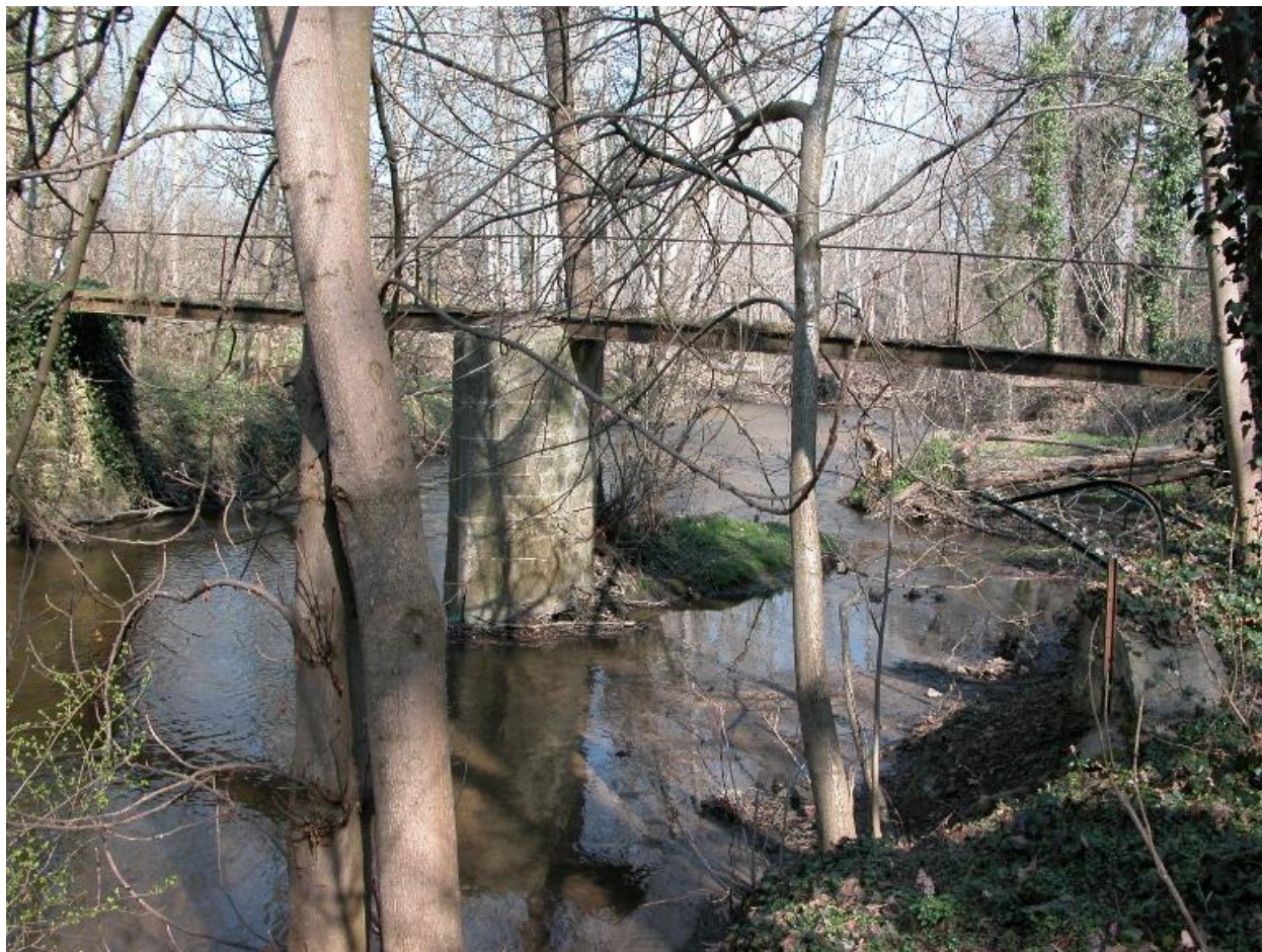
Vue d'ensemble de la passerelle.