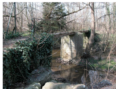
Vue d'ensemble de la passerelle de profil.