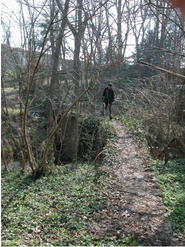
Vue d'ensemble du tablier de la passerelle.