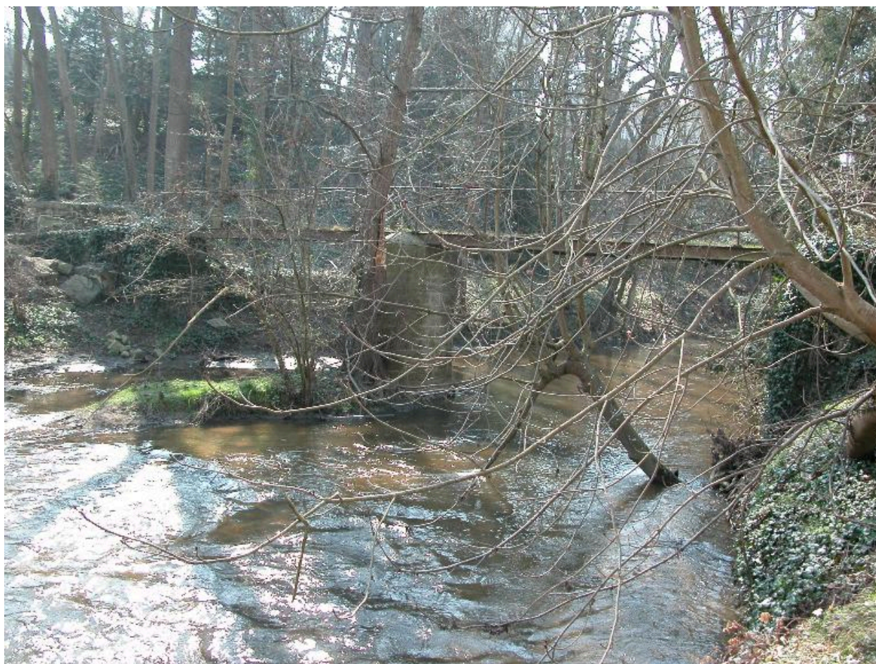
Vue d'ensemble de la passerelle.