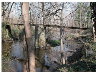
Vue d'ensemble de la passerelle.