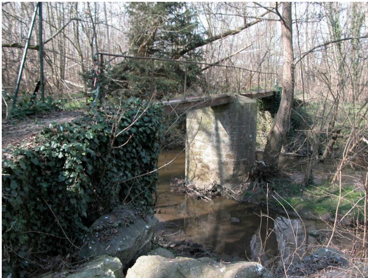
Vue d'ensemble de la passerelle de profil.