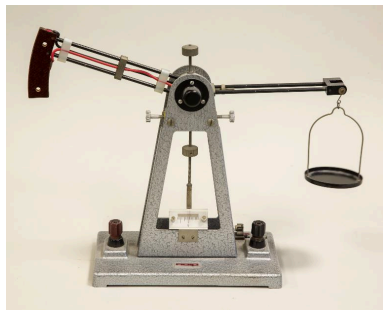
Vue d'ensemble IVR82_20147401829NUCA