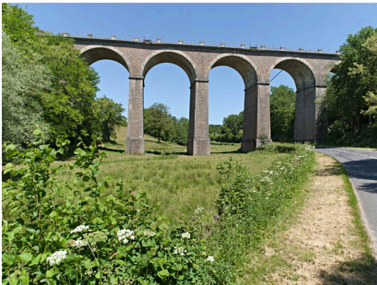
Vue générale du viaduc de Montciant depuis le sud.