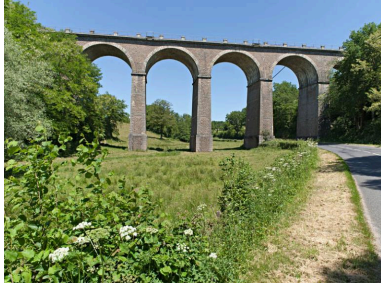
Vue générale du viaduc de Montciant depuis le sud.